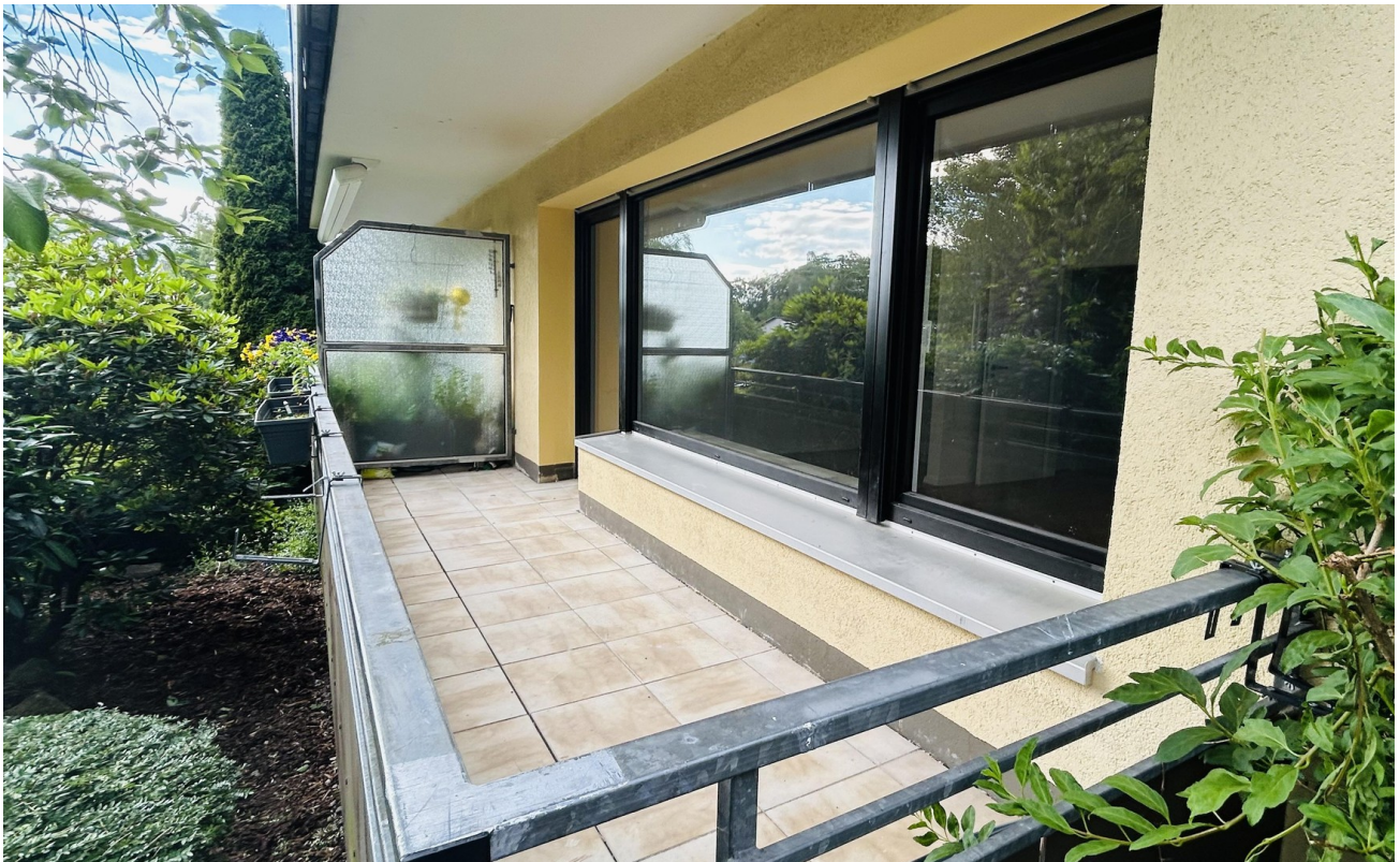
Balkon von außen