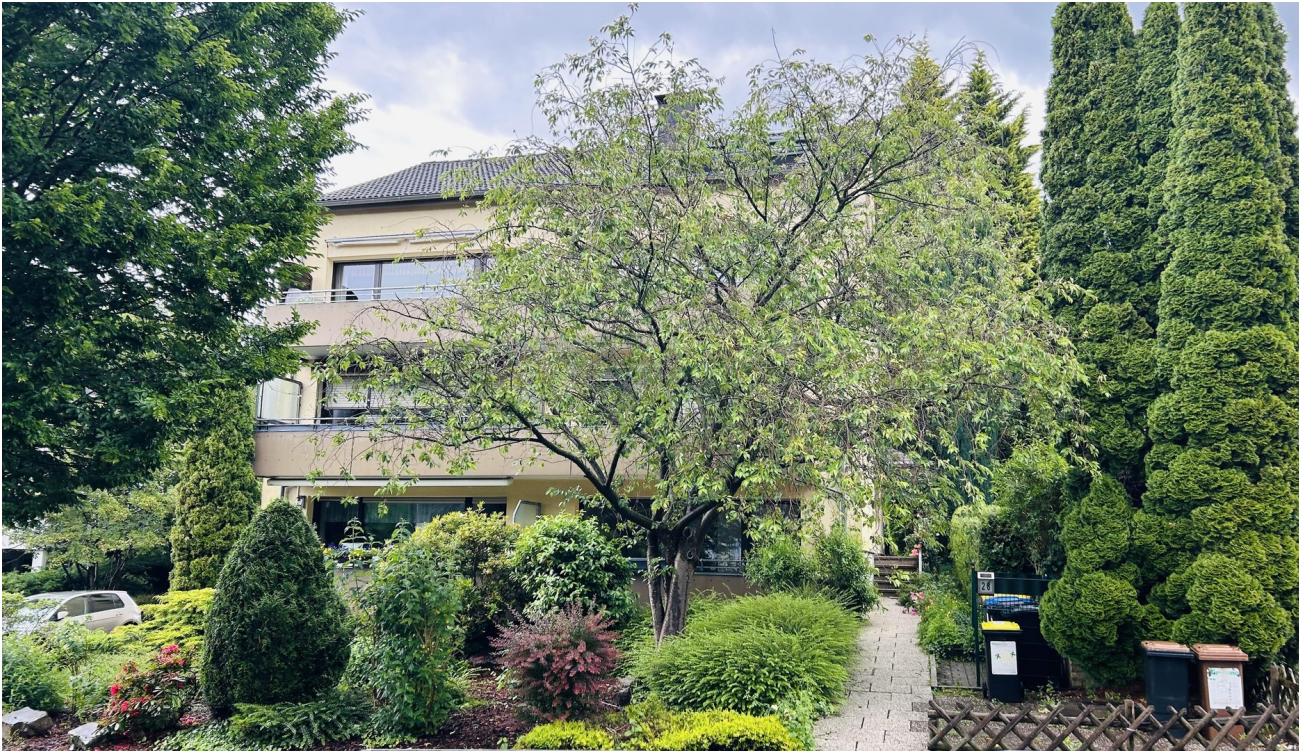
Hausansicht mit Vorgarten