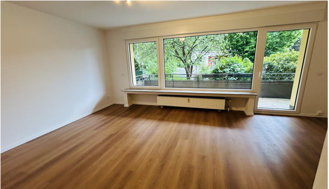
Wohn-/Schlafraum mit Balkon