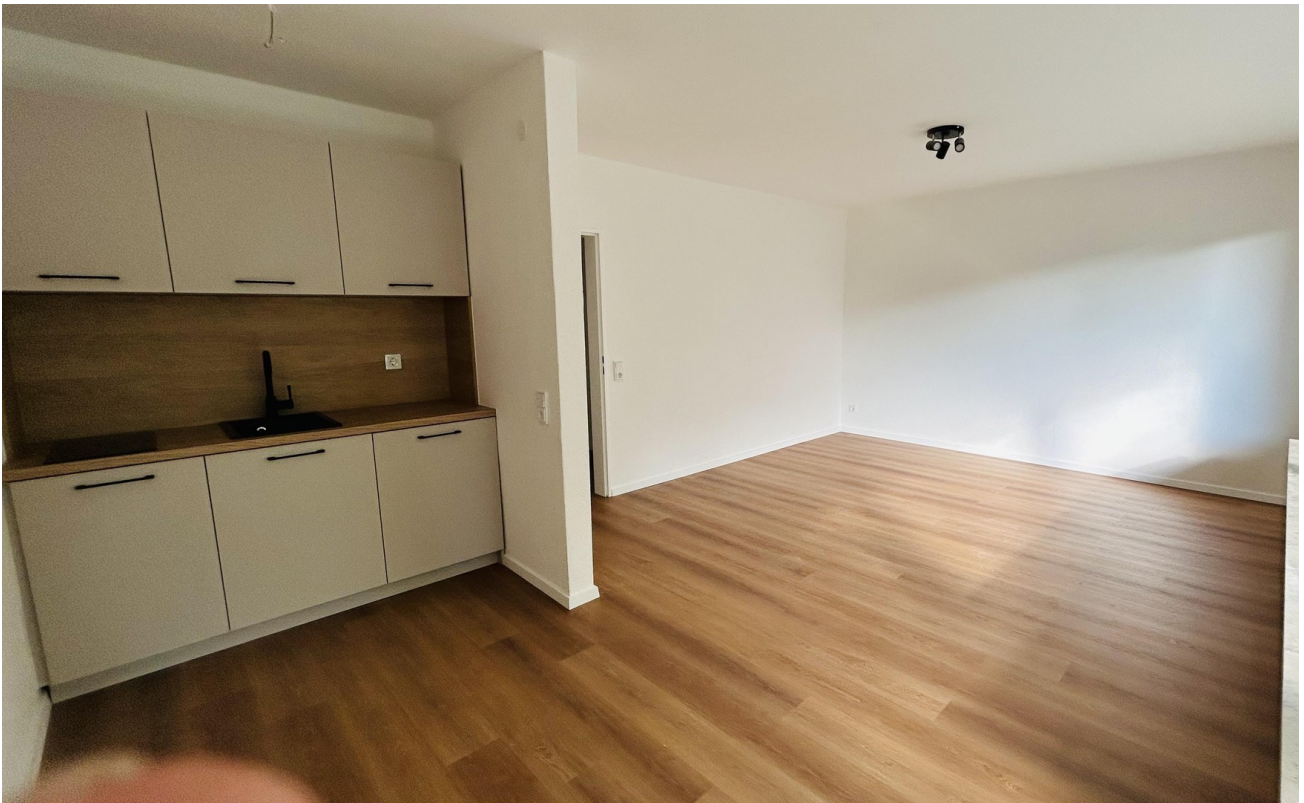
Wohnraum mit Küche