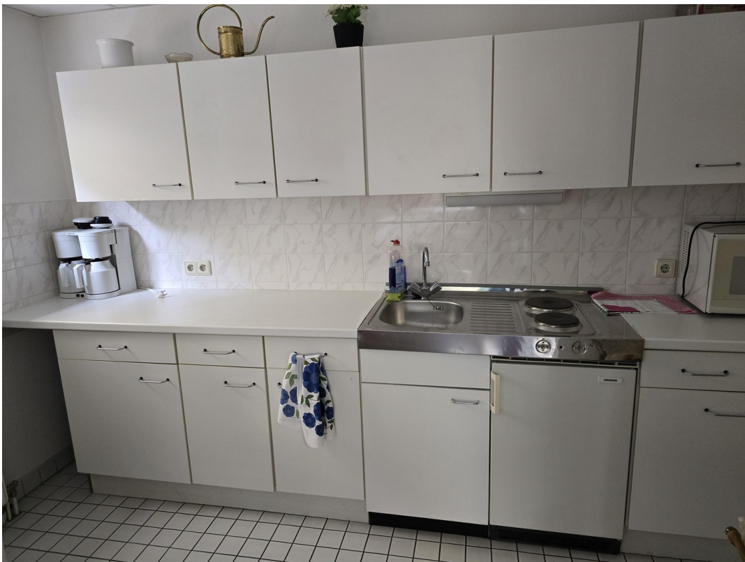
Gemeinschaftsraum - Küche