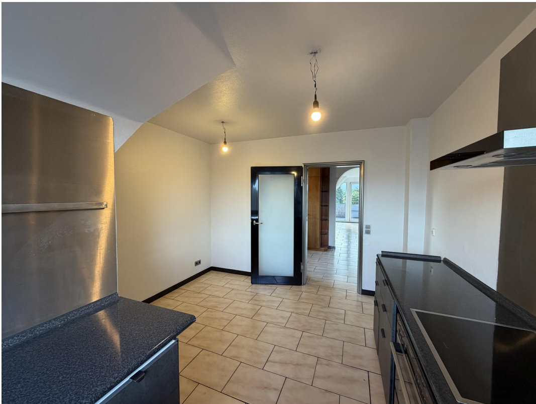
Küche Ansicht 3