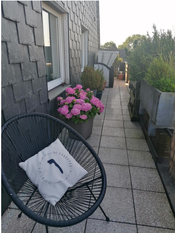
Balkon Seite 2