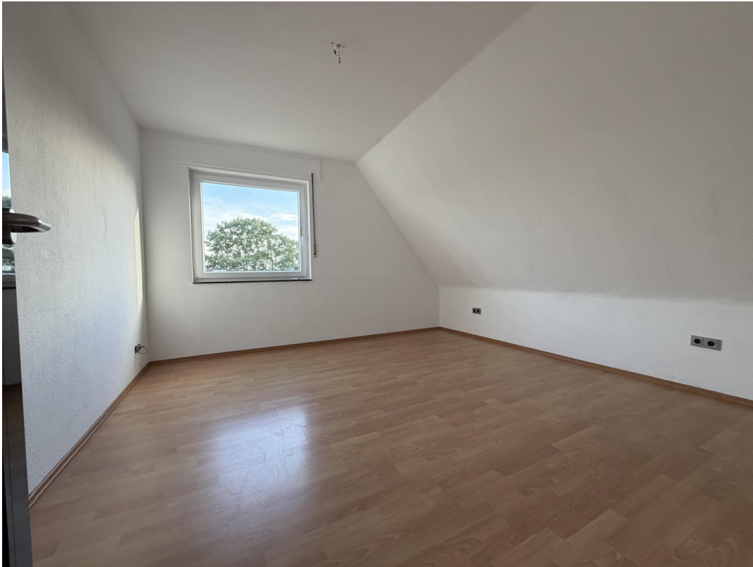
Schlafzimmer 1 Ansicht 1