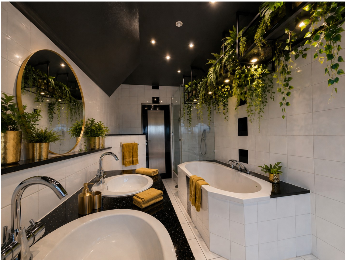
Bad KI eingerichtet