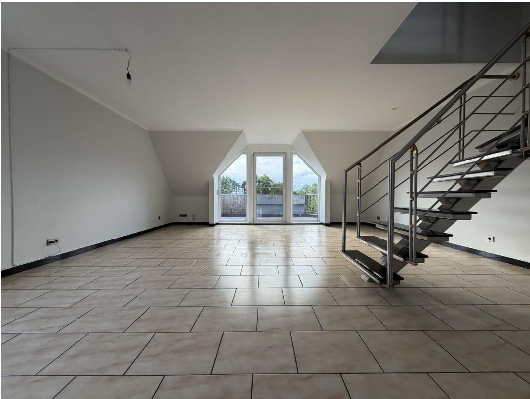
Wohnzimmer Ansicht 3