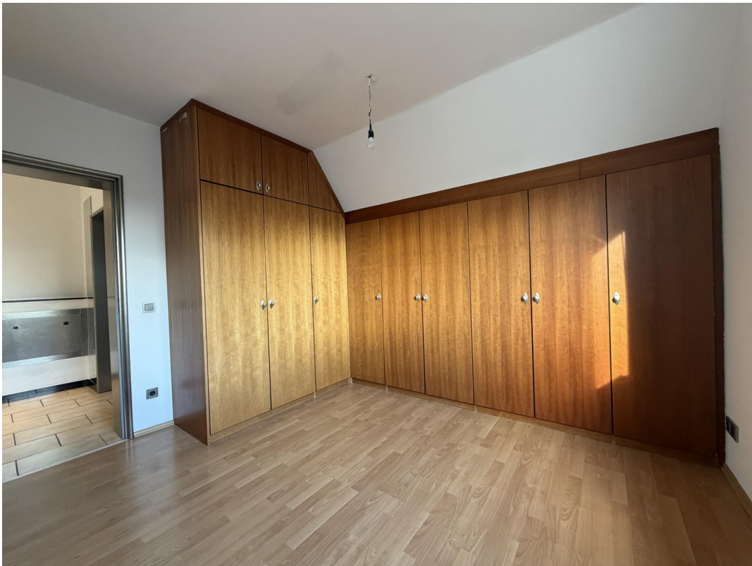
Schlafzimmer 2 Einbauschränk