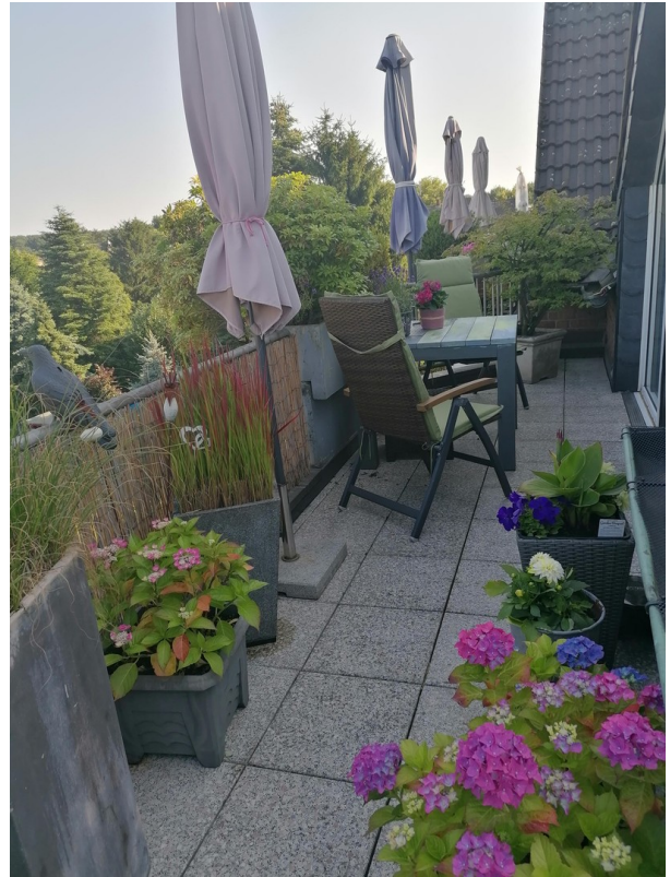
Balkon Seite 1