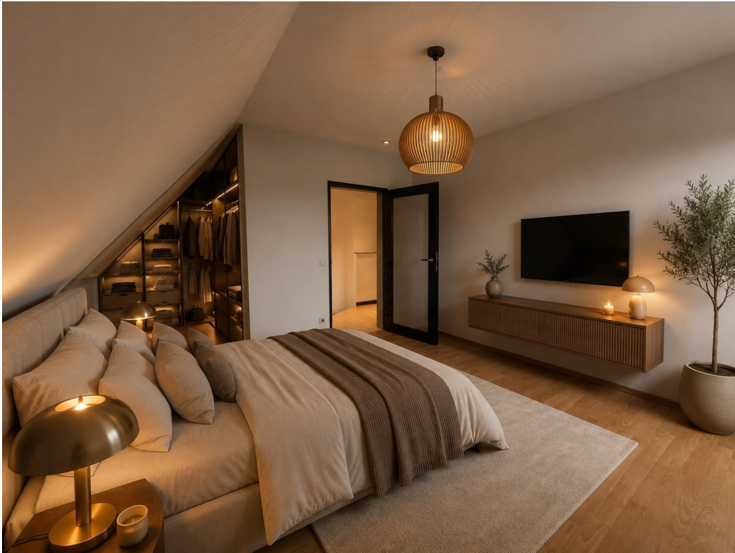
Schlafzimmer 1 KI eingerichtet