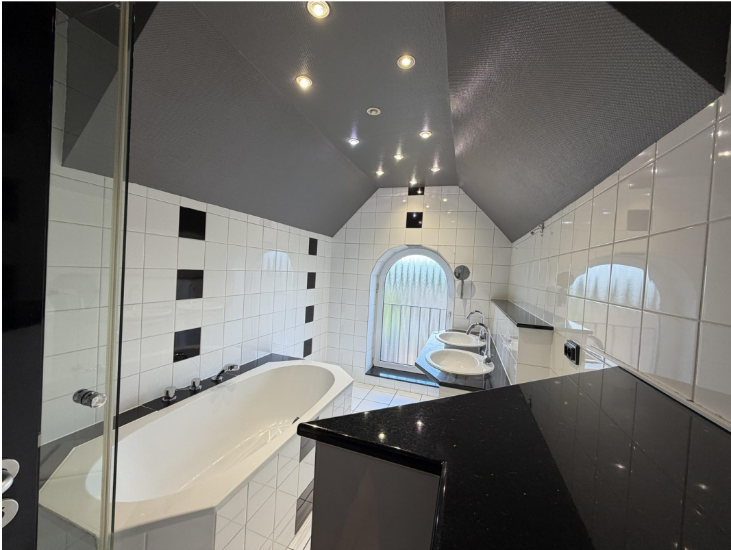
Bad Ansicht 3