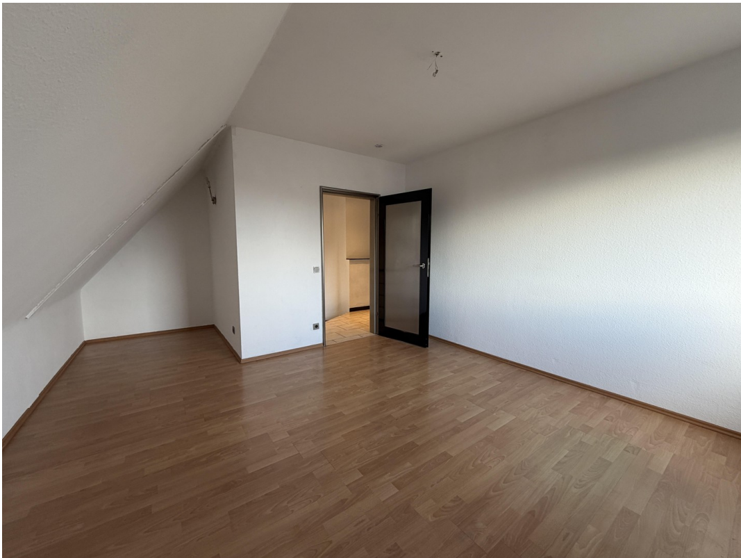
Schlafzimmer 1 Ansicht 2