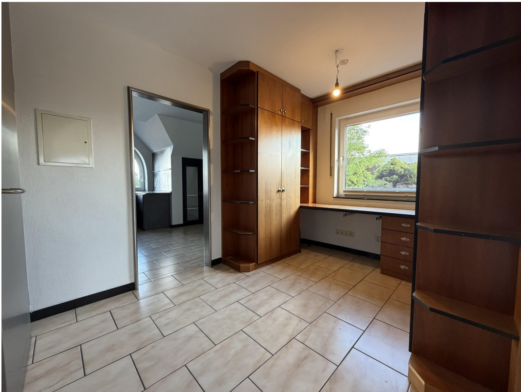
Diele Blick zur Küche