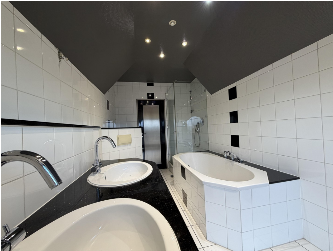
Bad Ansicht 1