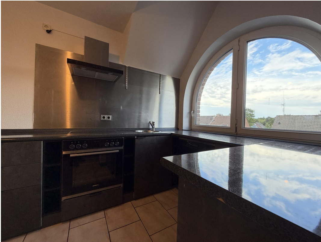
Küche Ansicht 2