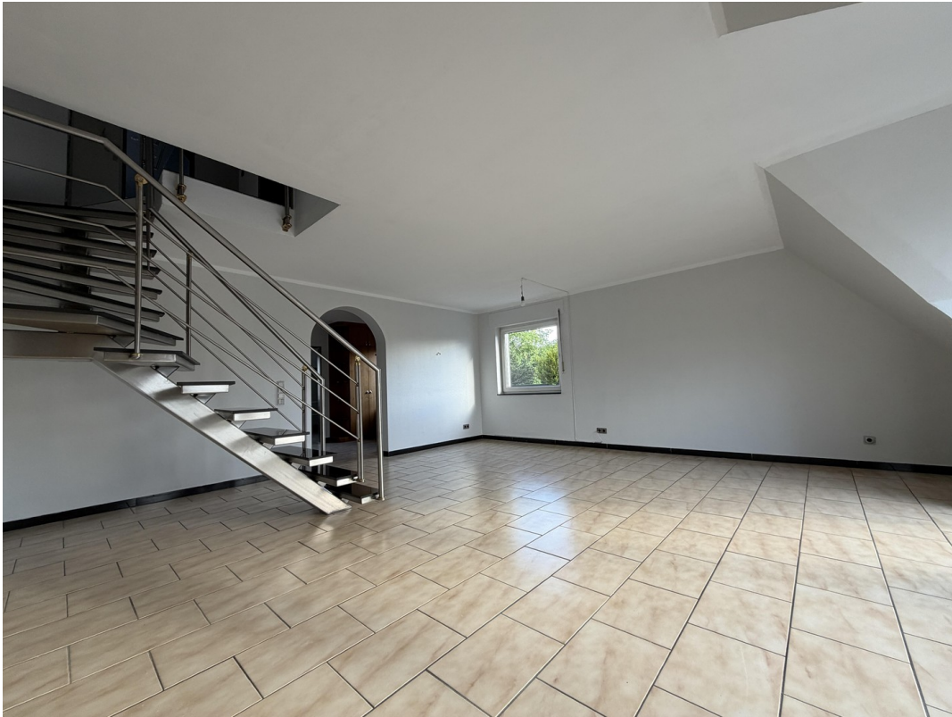
Wohnzimmer Ansicht 1