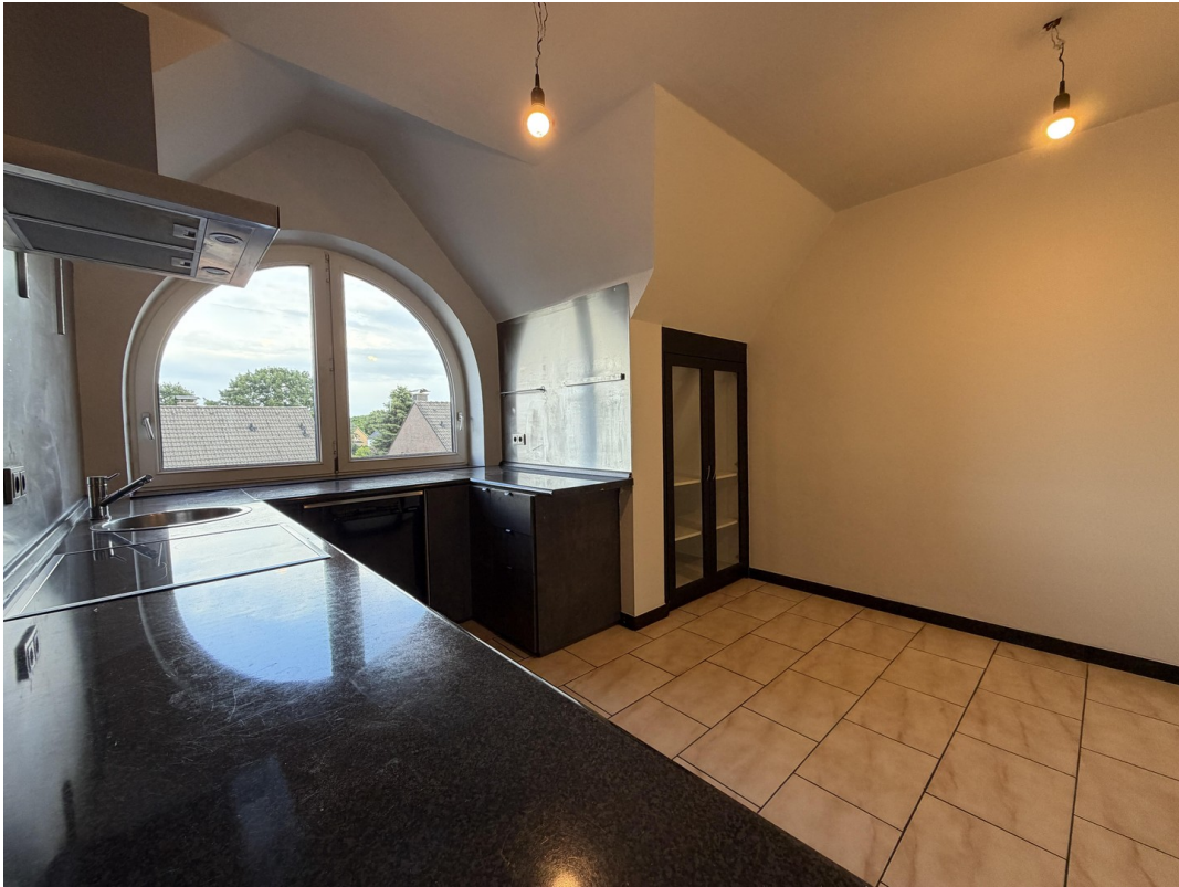
Küche Ansicht 4