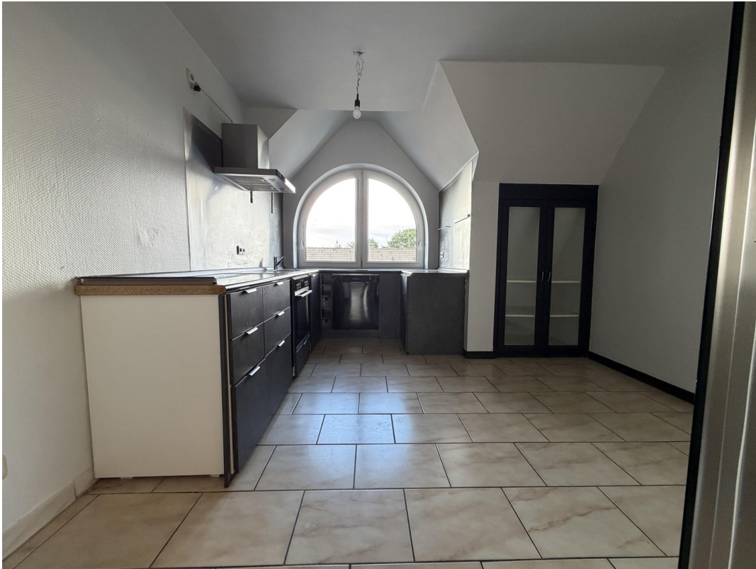
Küche Ansicht 1