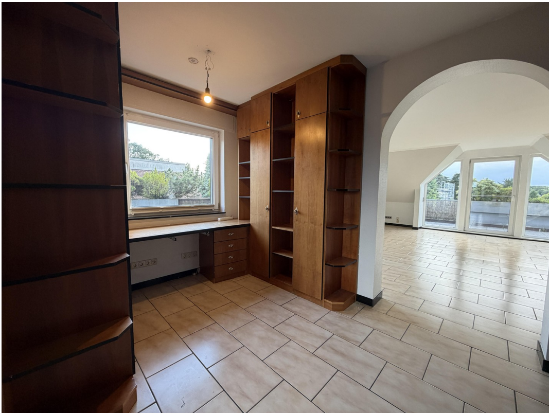
Diele Blick zum Wohnzimmer