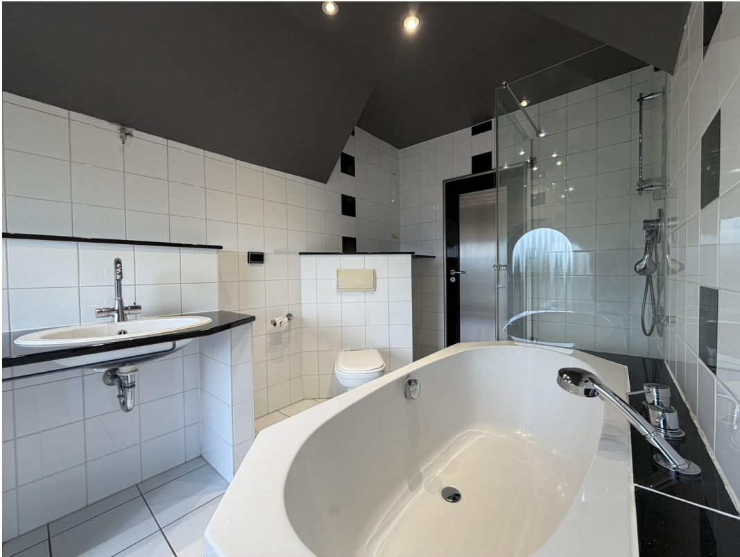
Bad Ansicht 2