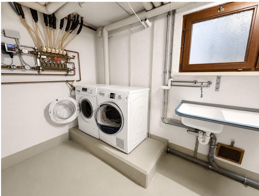
Waschküche + Technik UG