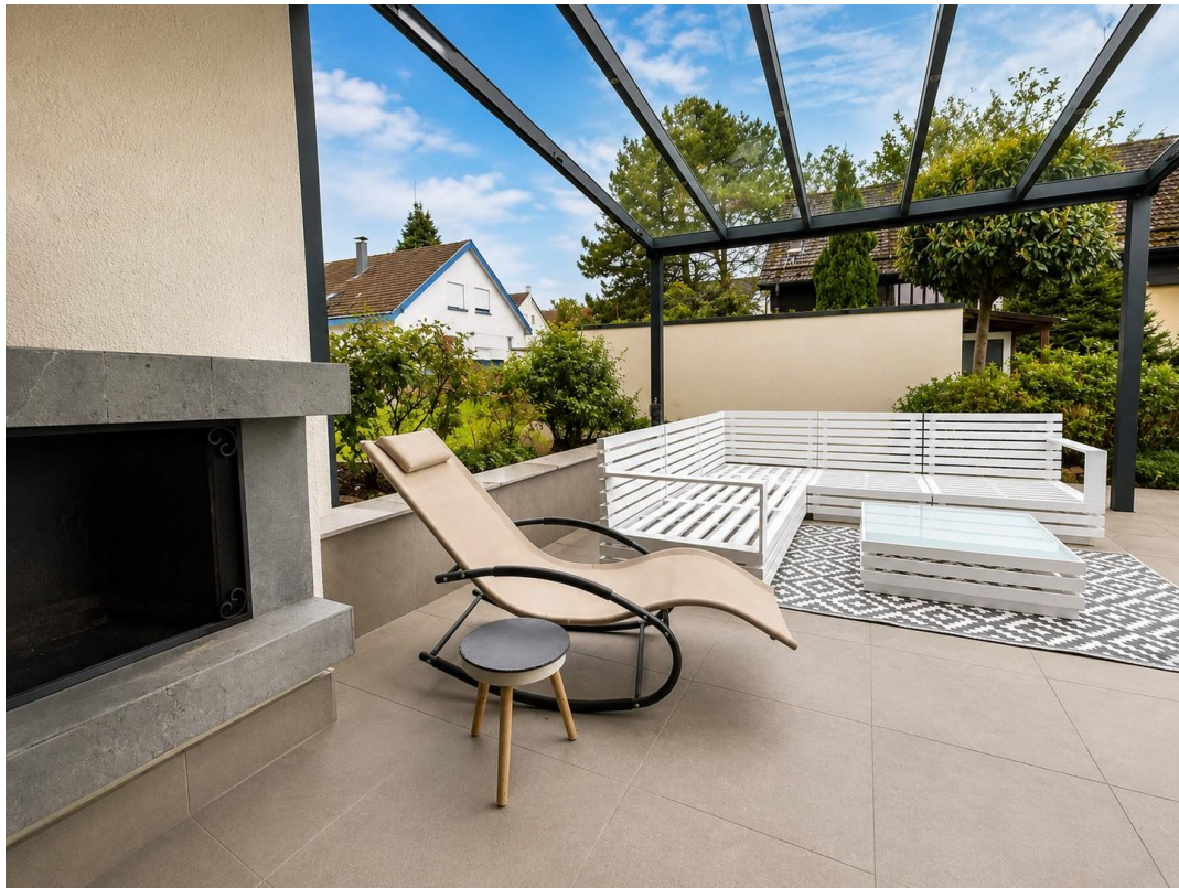
Terrasse + Kamin