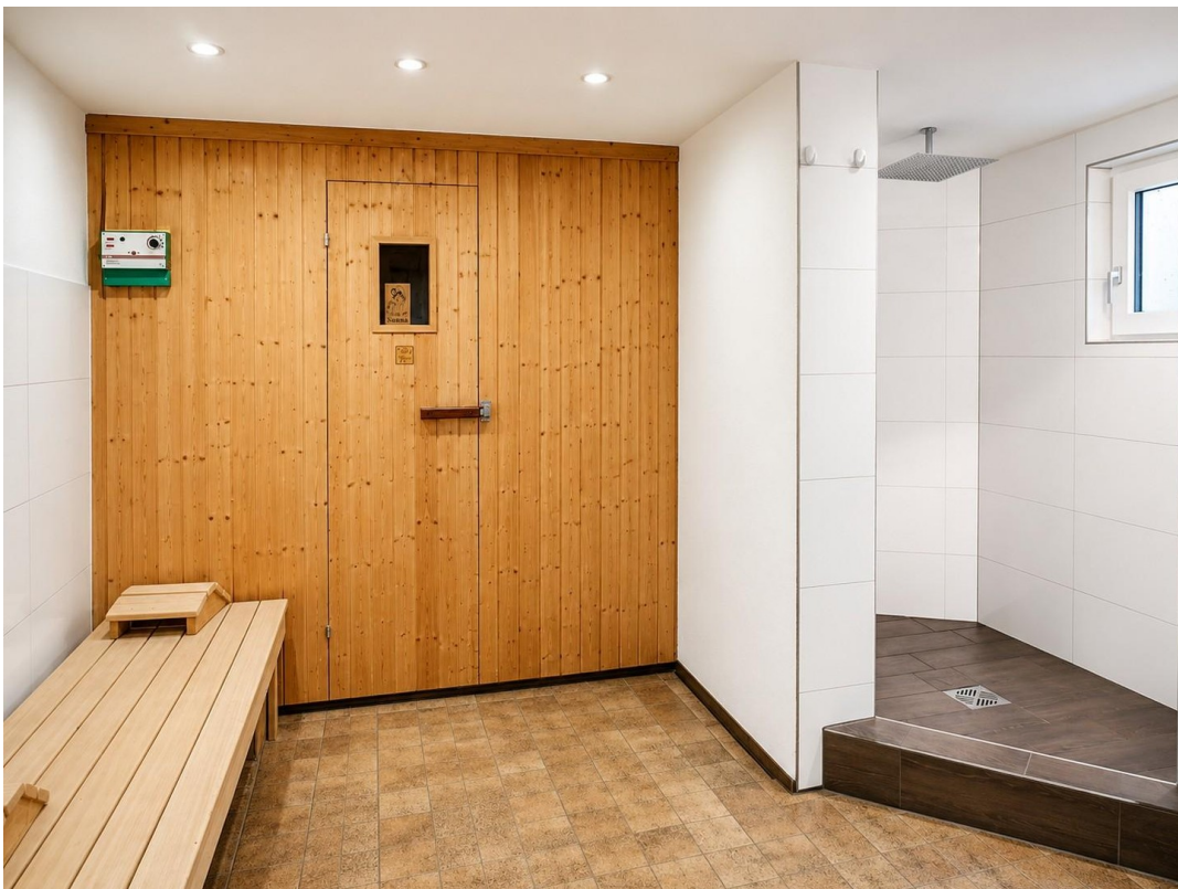
Saunaraum + Dusche UG