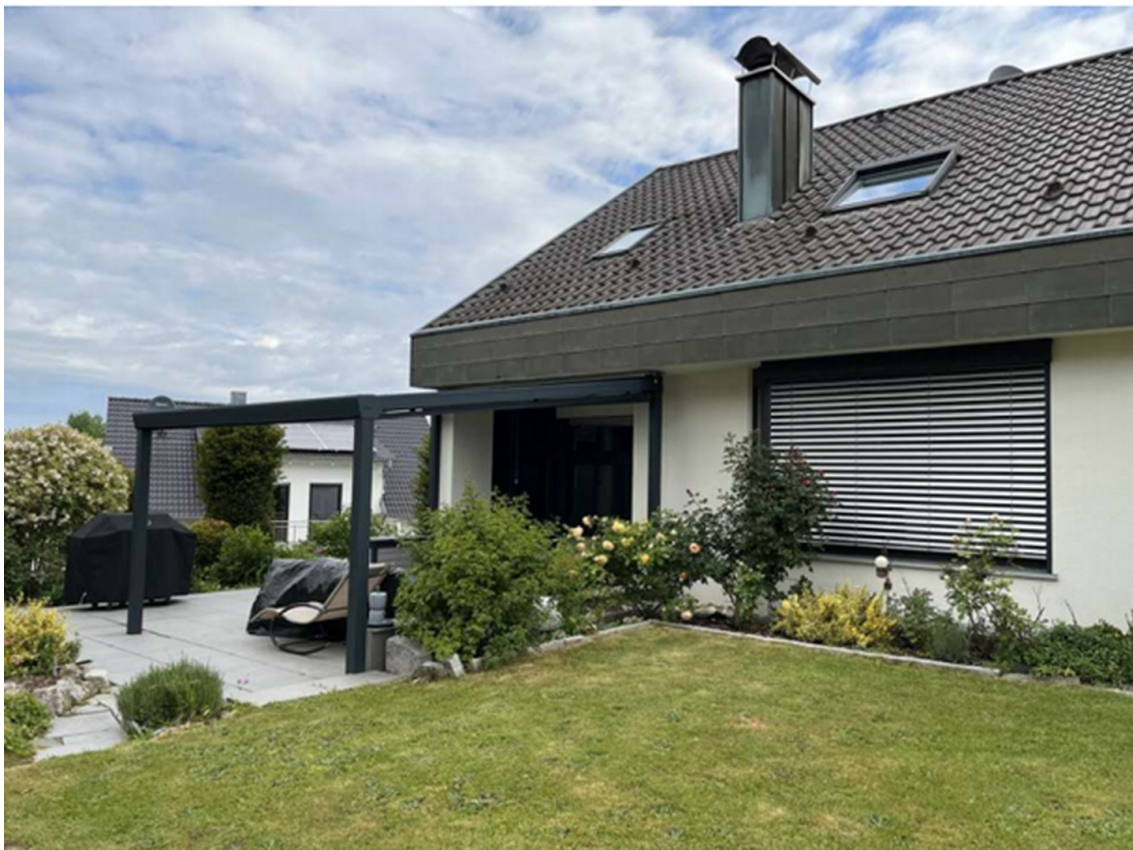
Terrasse + Garten