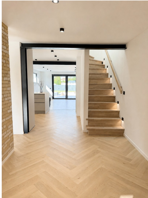
Treppe echte Kalk-Eiche