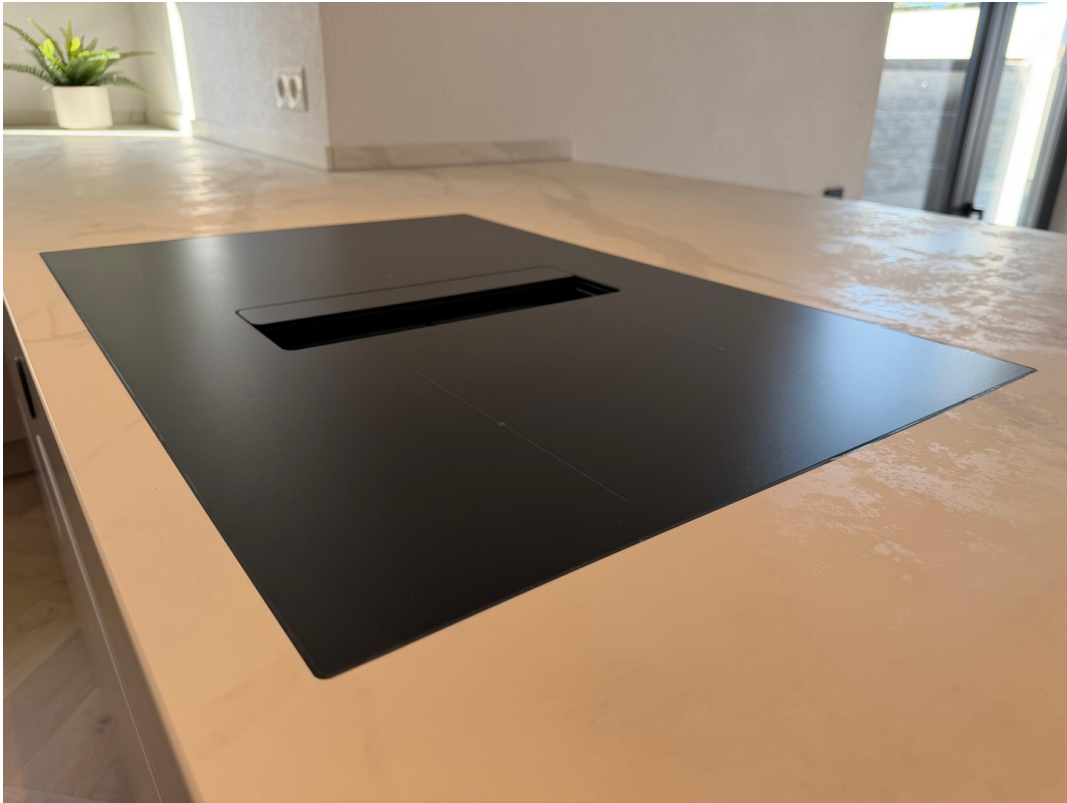
Herd mit Innenabzug