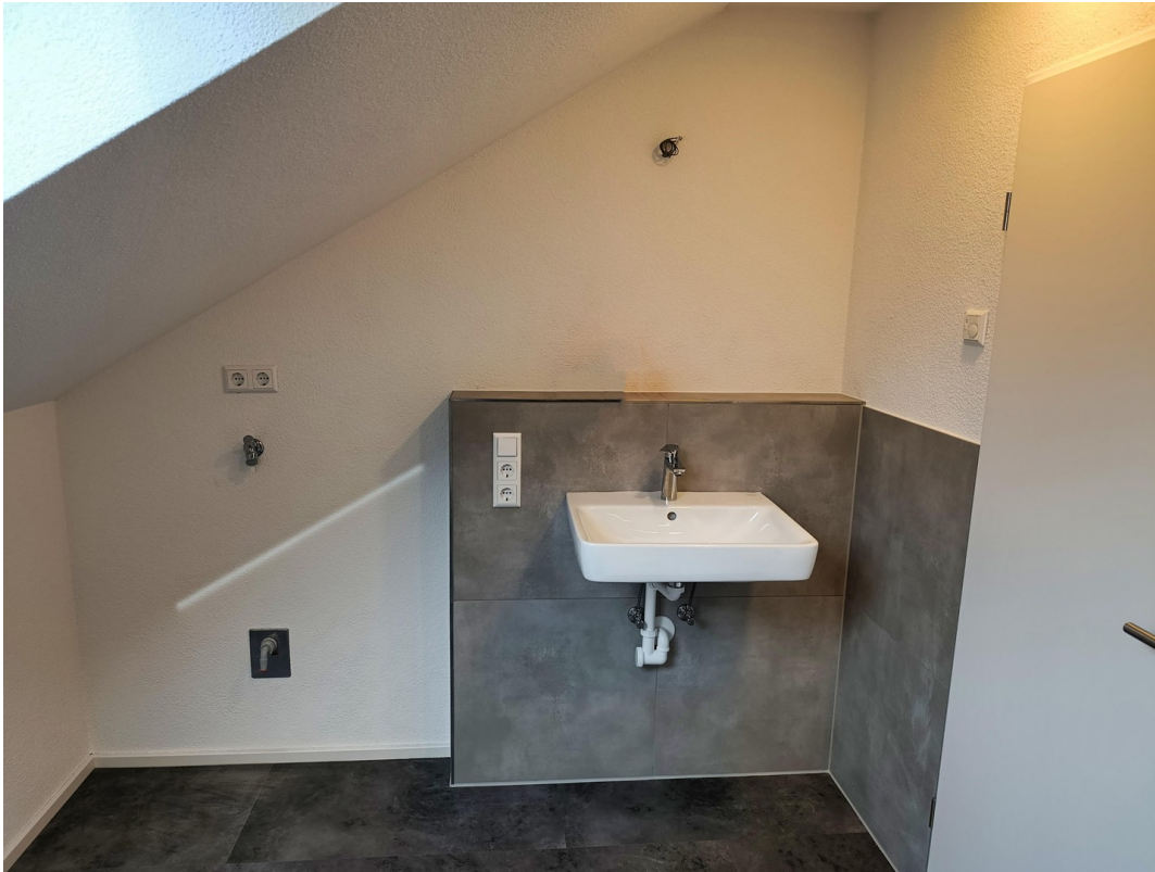
Waschmaschine und Waschbecken