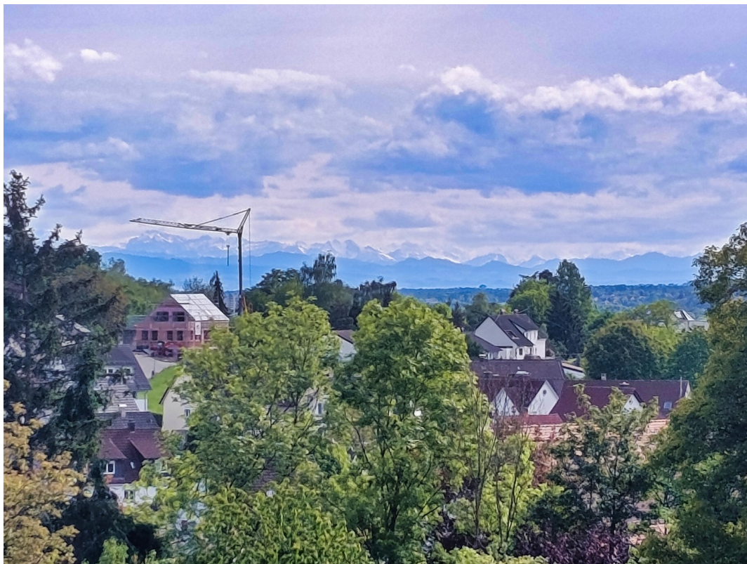
Bergsicht bis in die Alpen