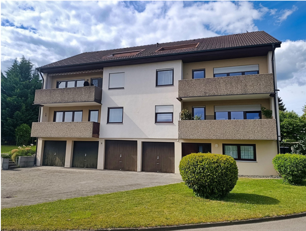
Hausansicht des 6-Fam- Haus