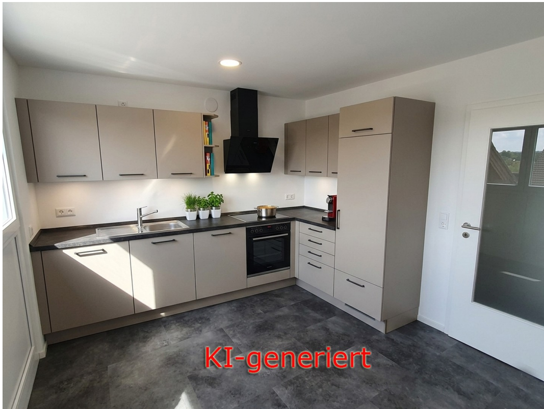
Einbauküche - KI generiert