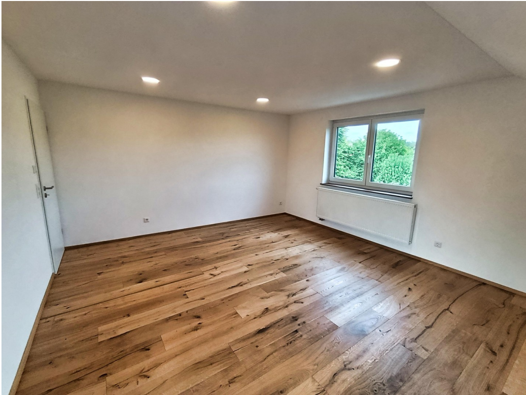
Wohnzimmer mit Einbauleuchten