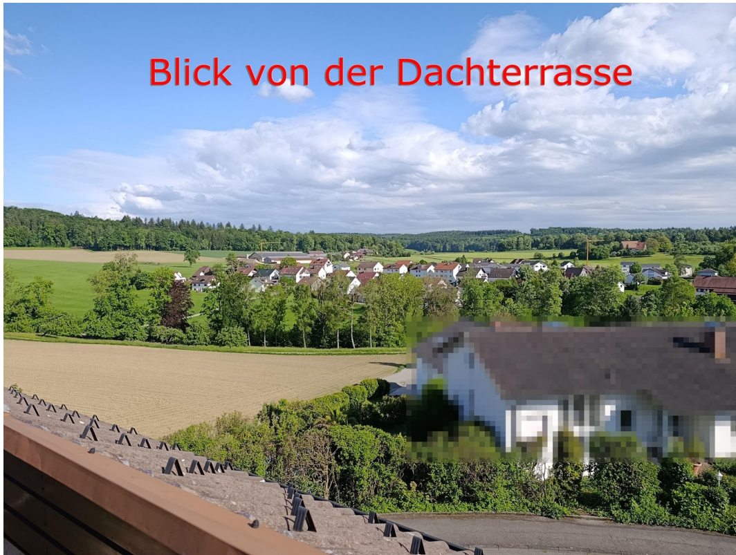
Unverbaubarer Blick ins Grüne