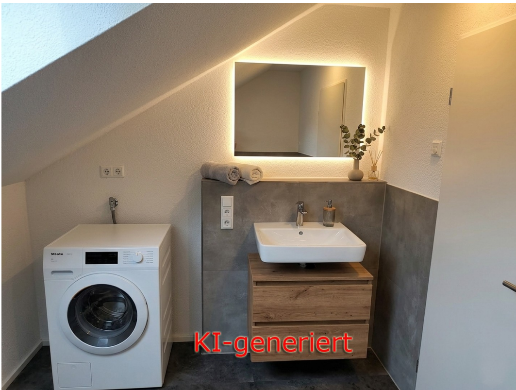
So könnte das Bad aussehen