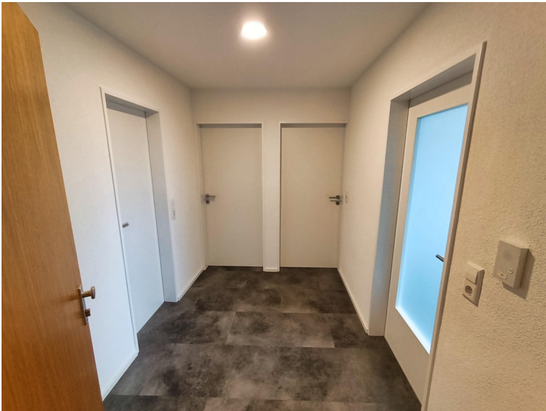
Einblick von der Eingangstür