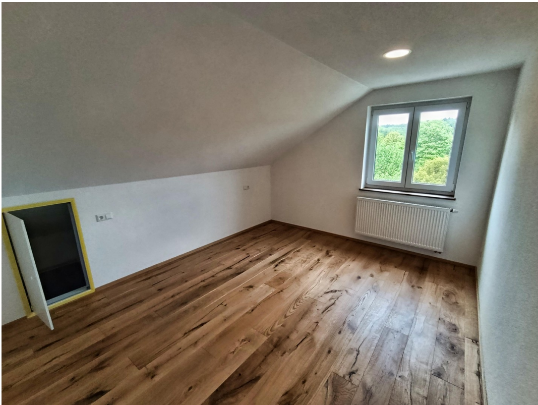
Schlafzimmer mit Drempeltür