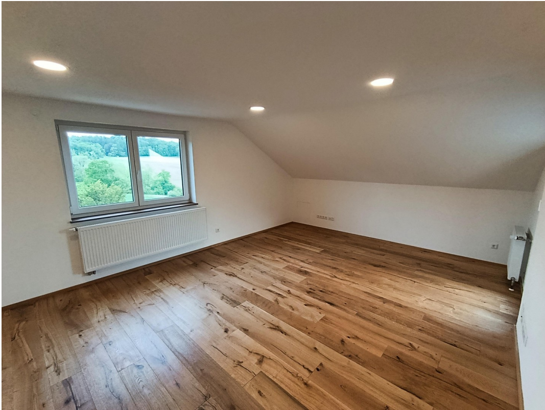
Großes Wohnzimmer mit Parkett