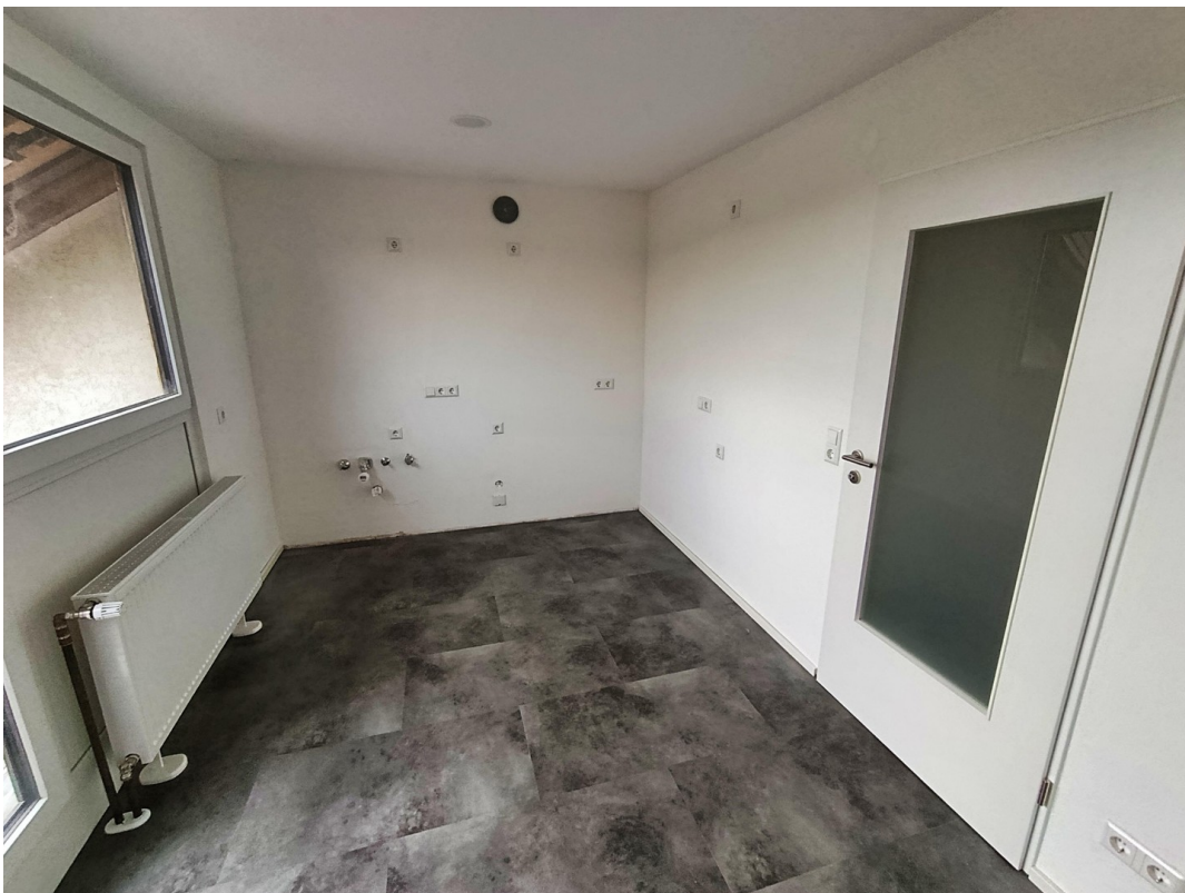
Komplett renovierte Küche