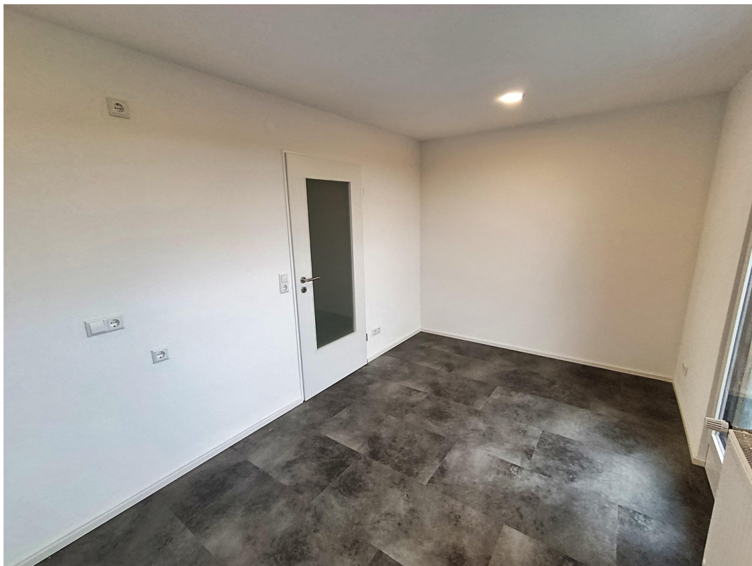
Platz für Esstisch mit Stühlen