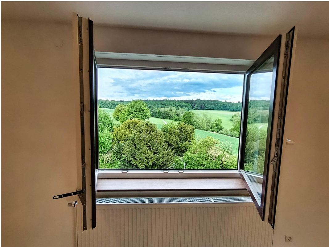
Ausblick vom Wohnzimmer