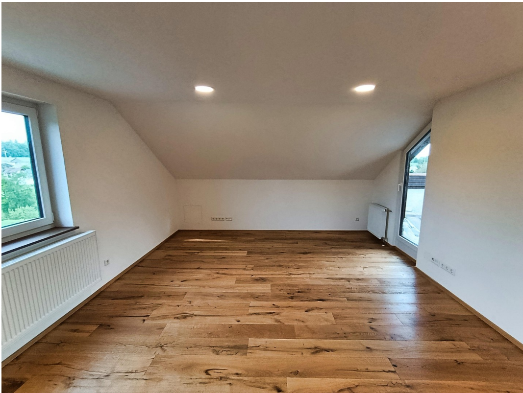
Großes Wohnzimmer - alles neu