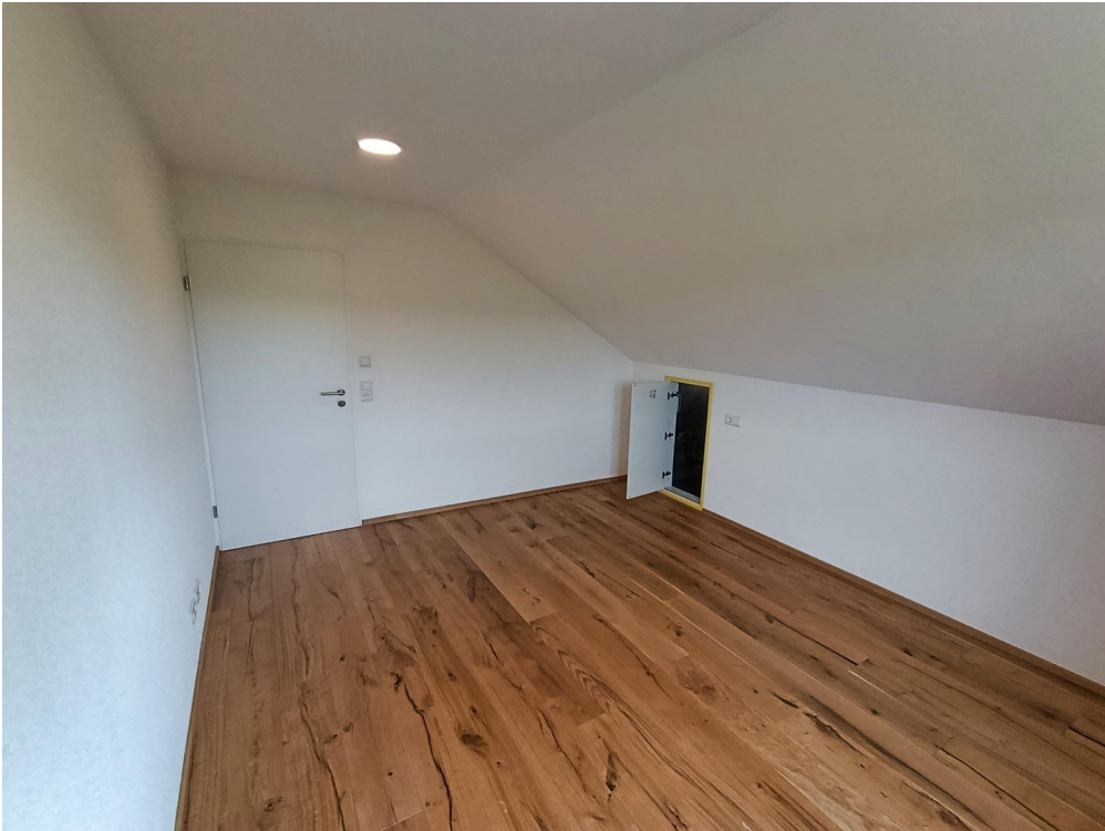
Eichenparkett im Schlafzimmer