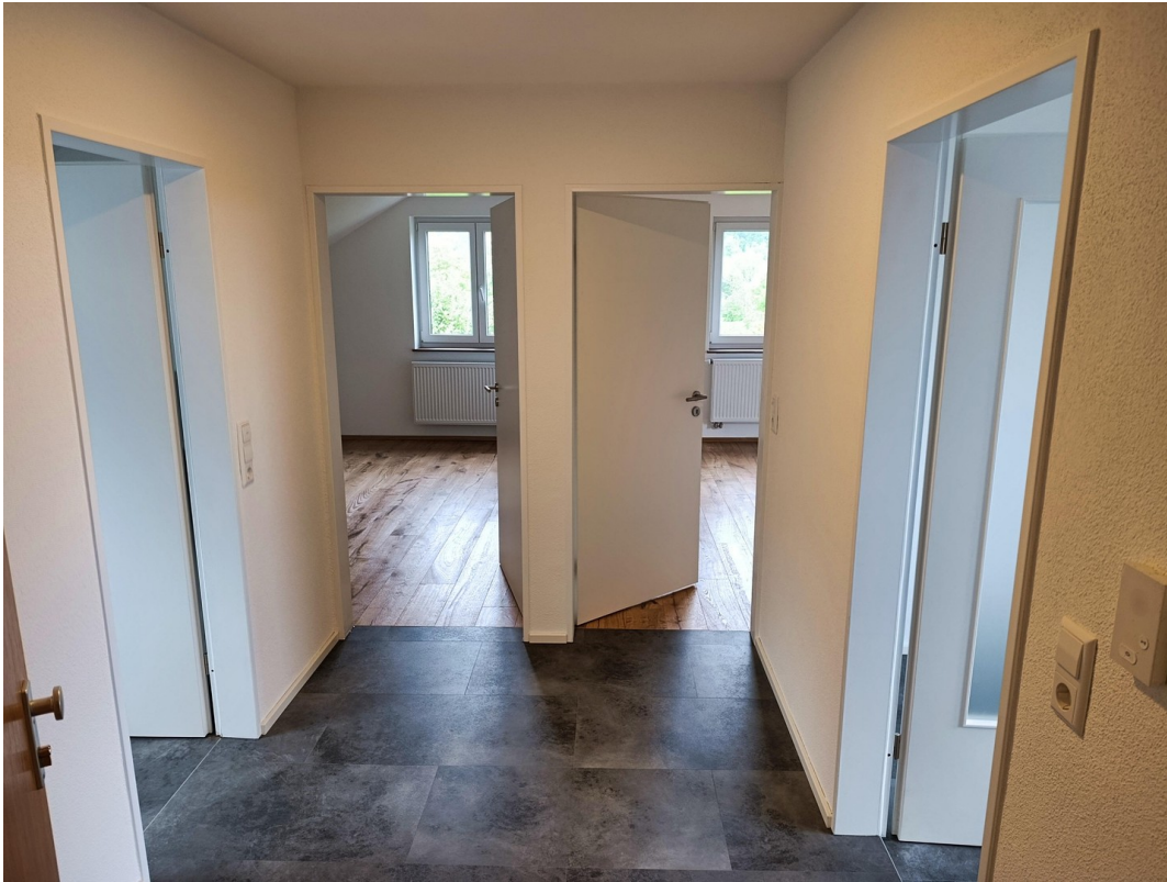
Vom Flur in alle Räume