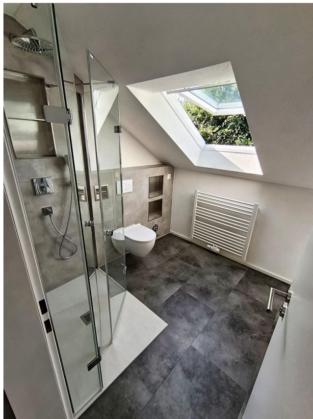
Blick in das neue Bad mit DF