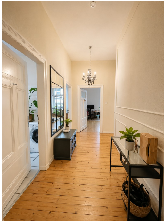
Eingang / Flur