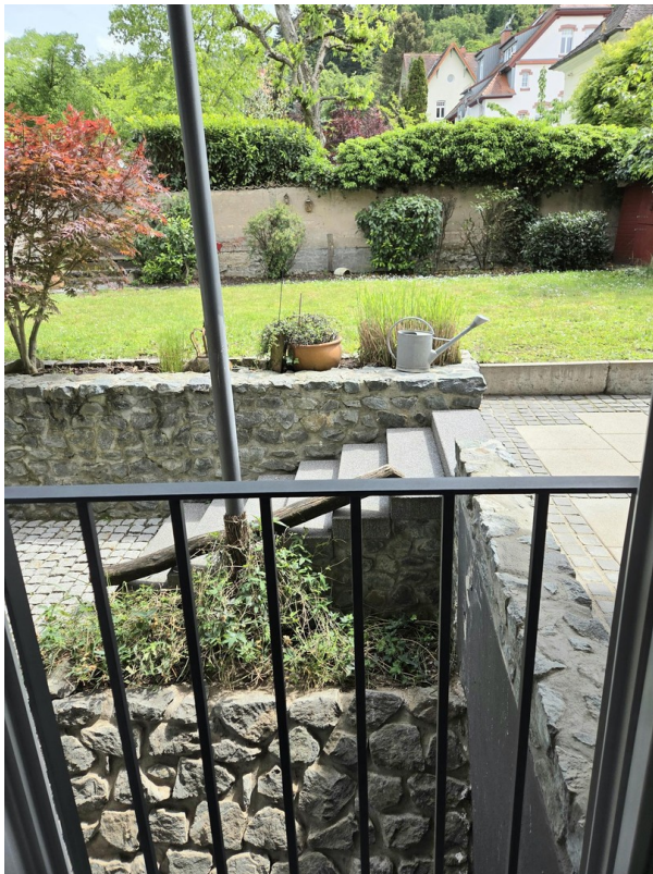
Weg zur Garage