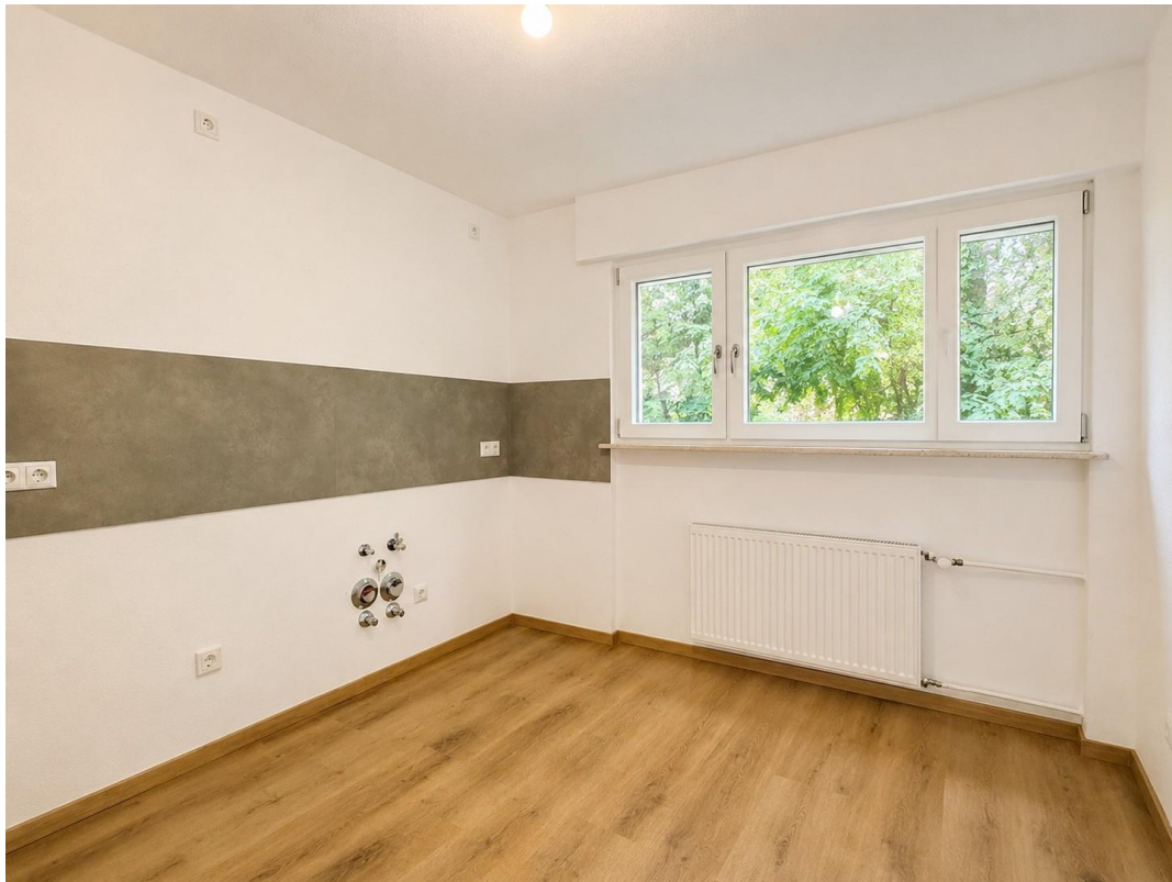
Wohnküche aktuell leer