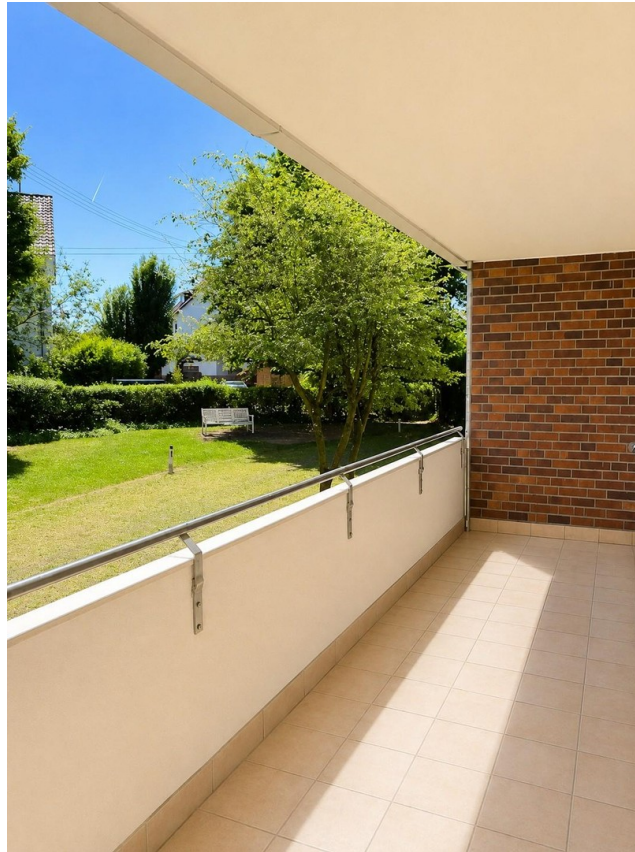
Loggia aktuell leer