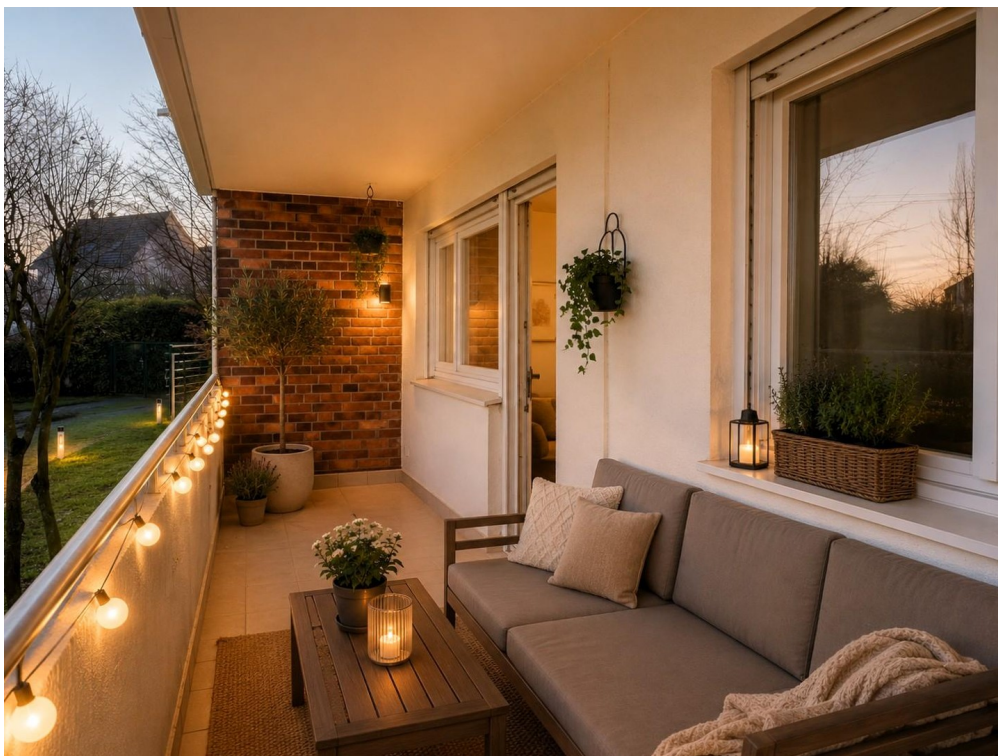
Loggia Beispiel Nacht