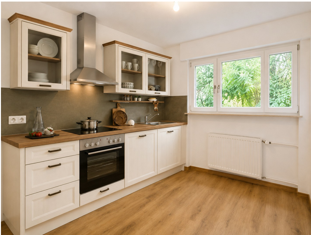
Küche mit der geplanten Zeile