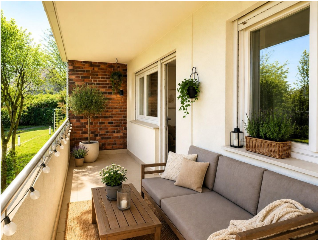
Loggia Beispiel Tag