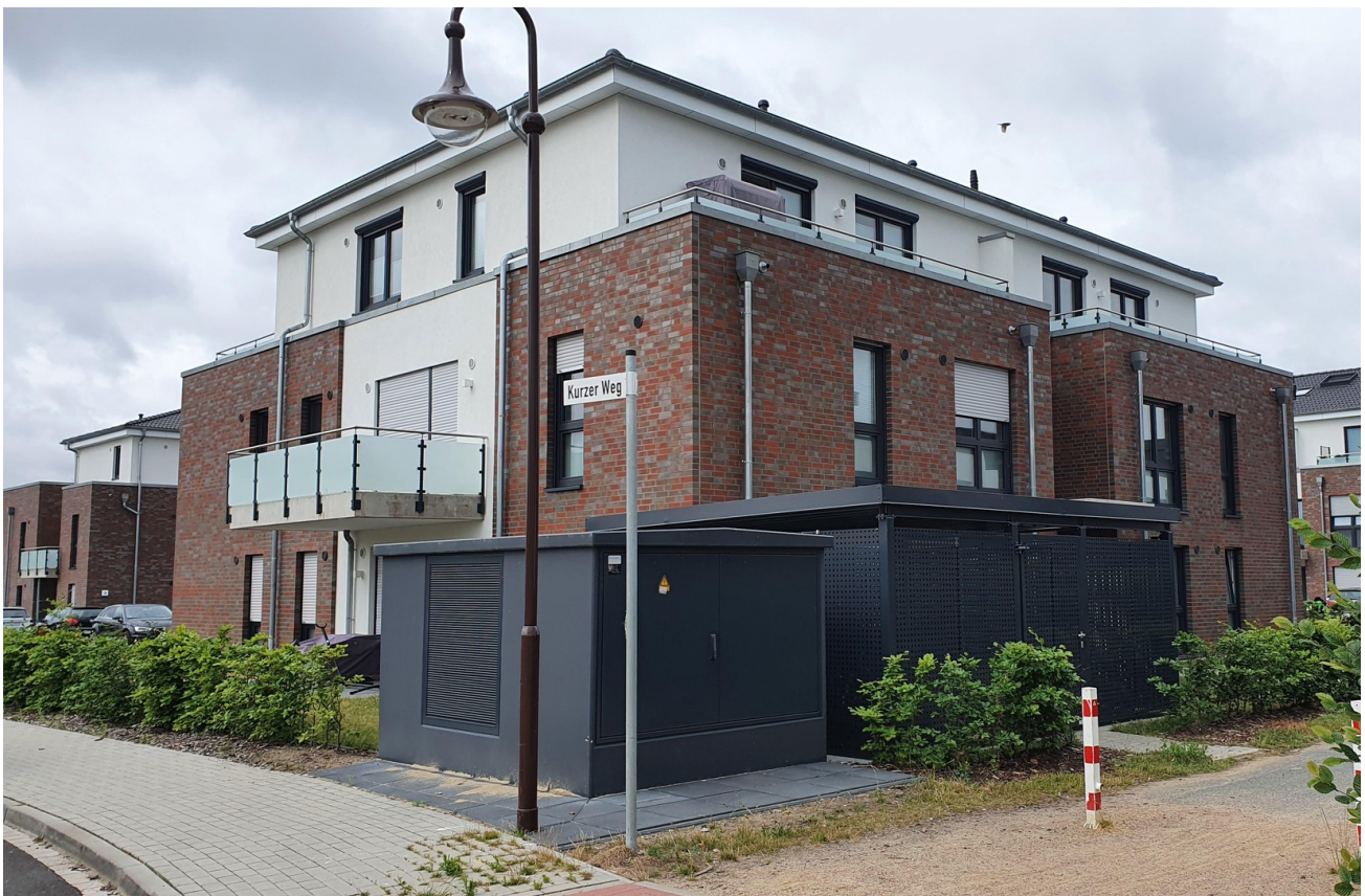
Kurzer Weg 10