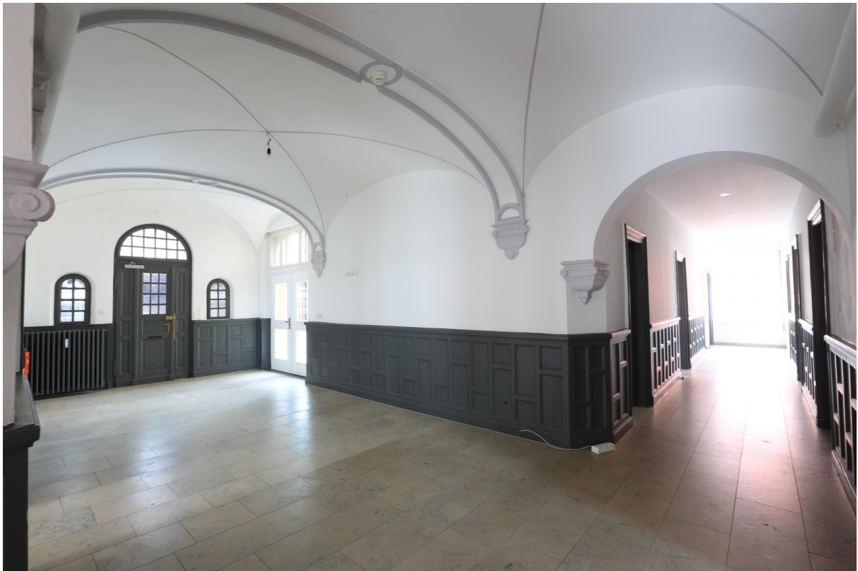
Empfang und Flur