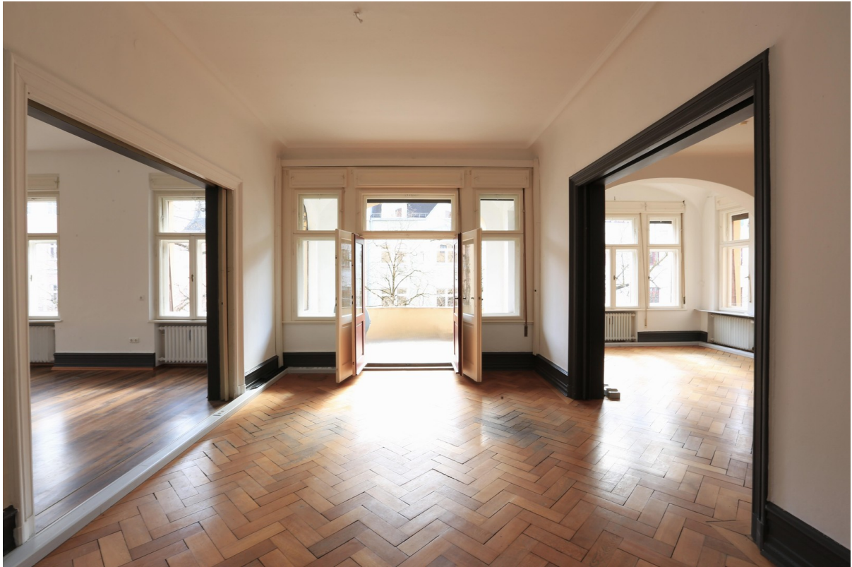
Esszimmer mit Loggia