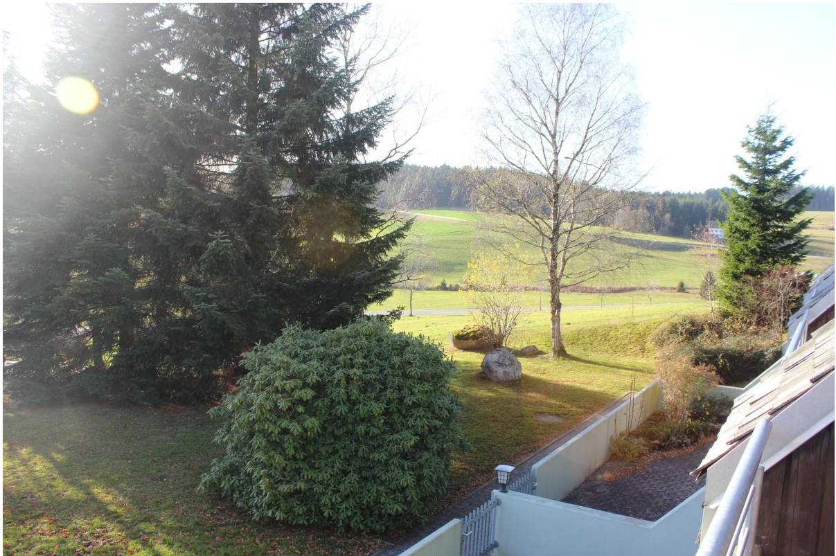
vom Balkon Blick rechts