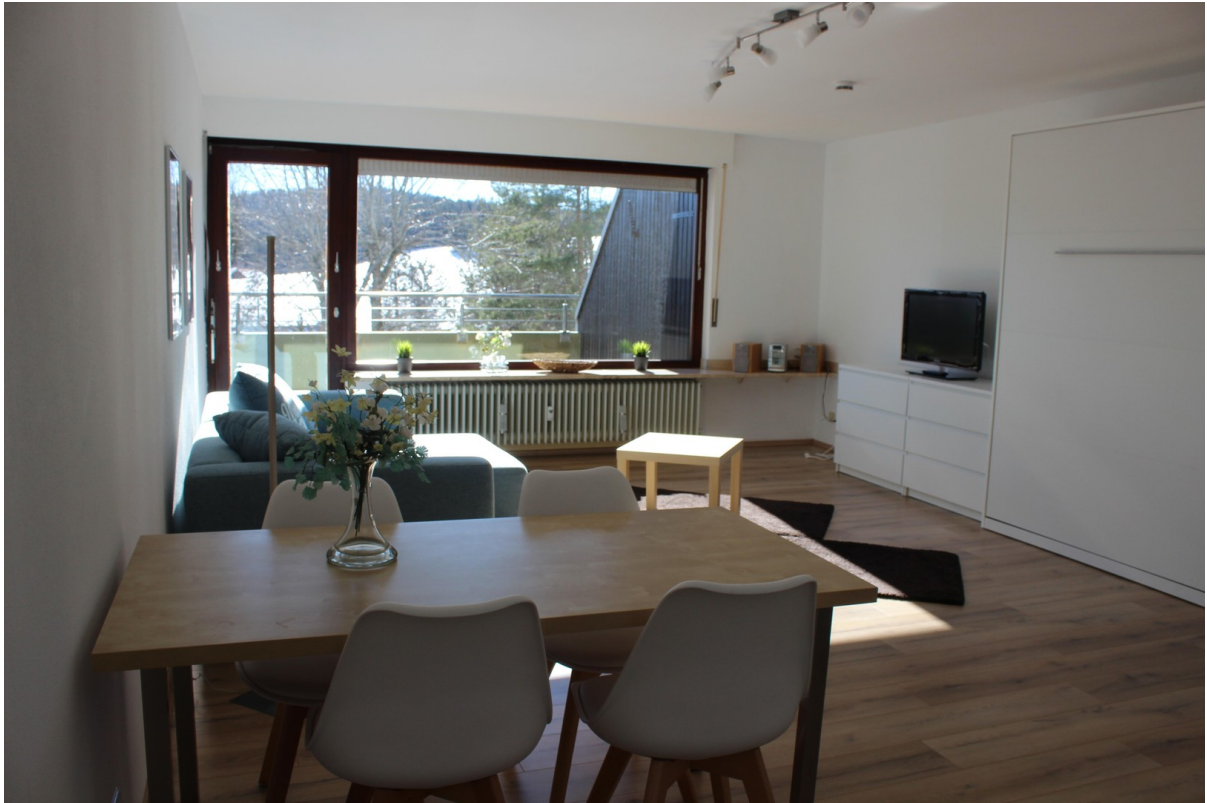
Blick Richtung Fenster