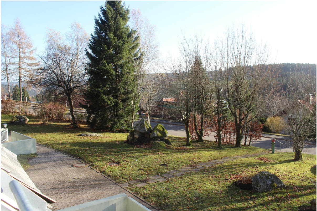
vom Balkon Blick links