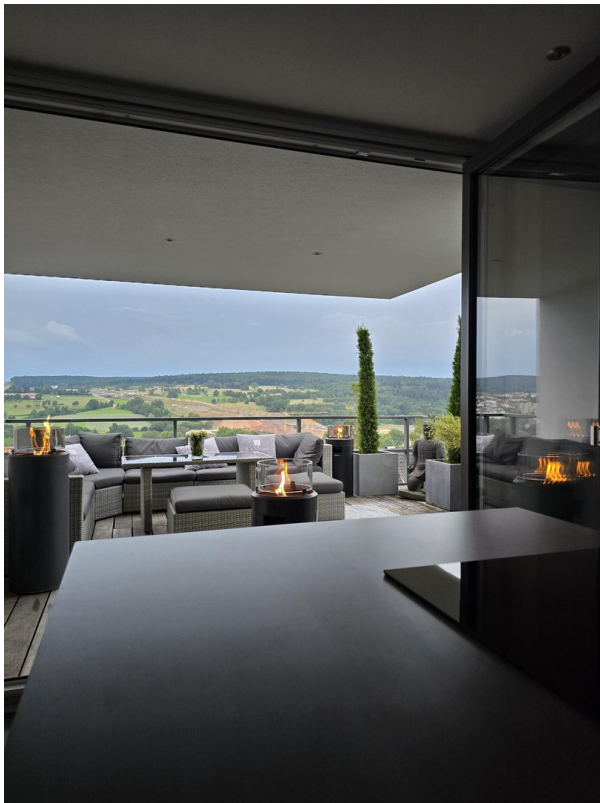
Küche, Blick auf Terrasse