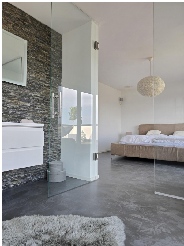
Master-Suite - Schlafzimmer