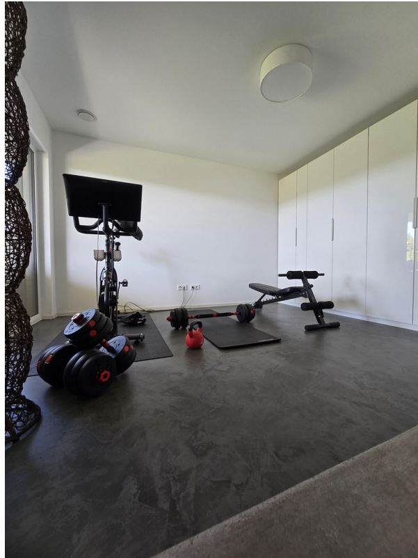
Zimmer 1 untere Etage