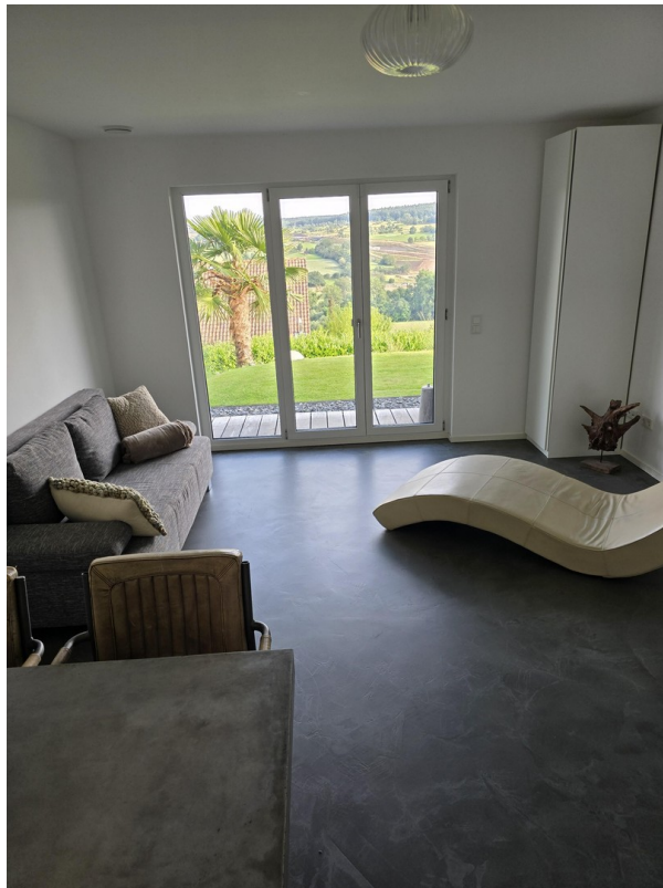
Zimmer 2 untere Etage