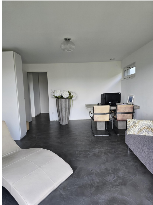
Zimmer 2 untere Etage