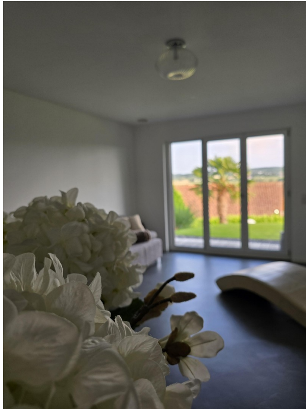
Zimmer 2 untere Etage