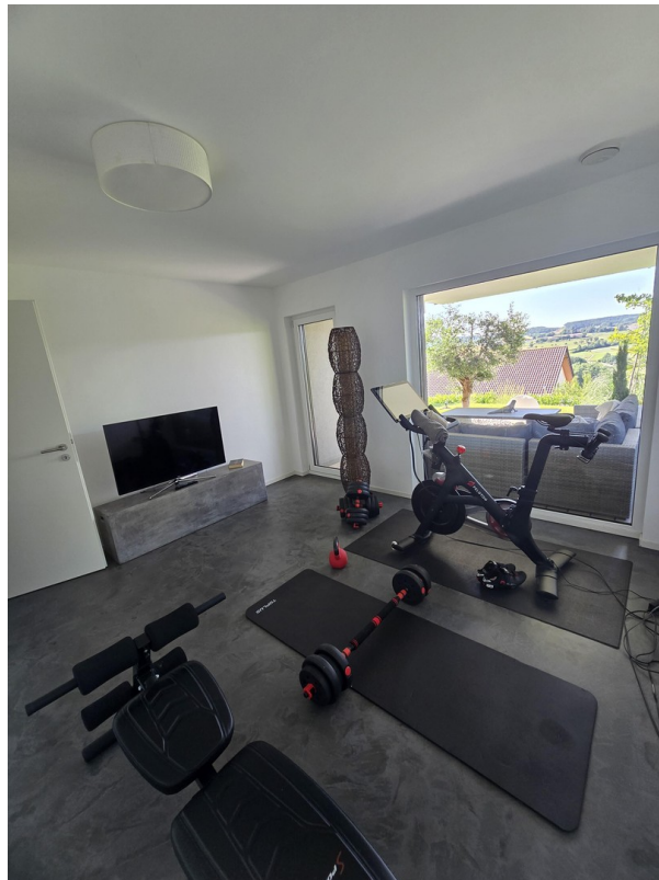
Zimmer 1 untere Etage