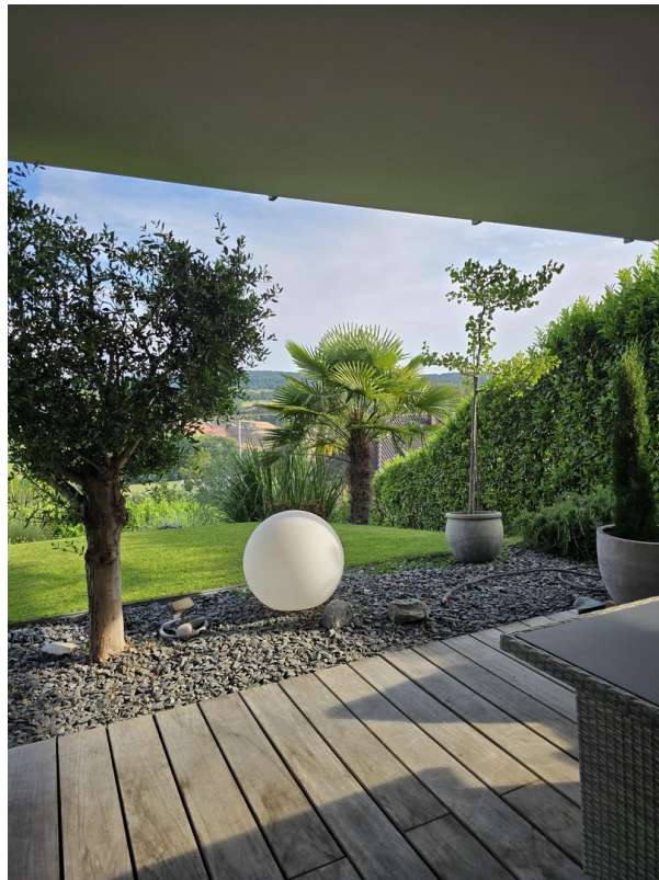
untere Terrasse und Garten