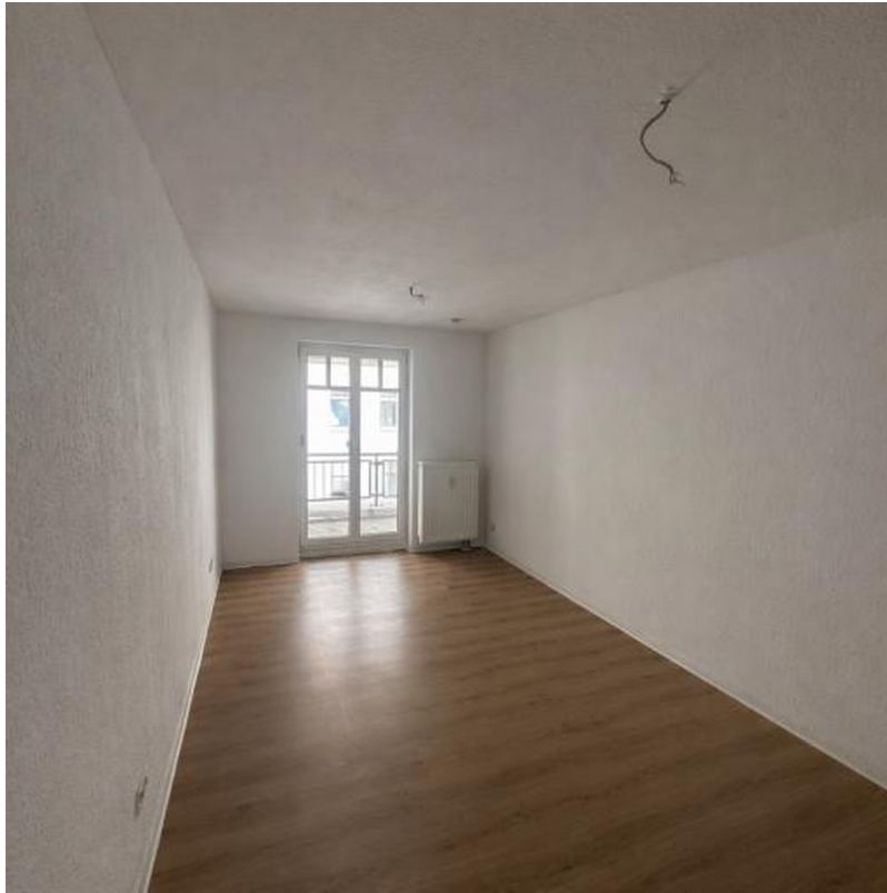
Wohnzimmer Blick zum Balkon