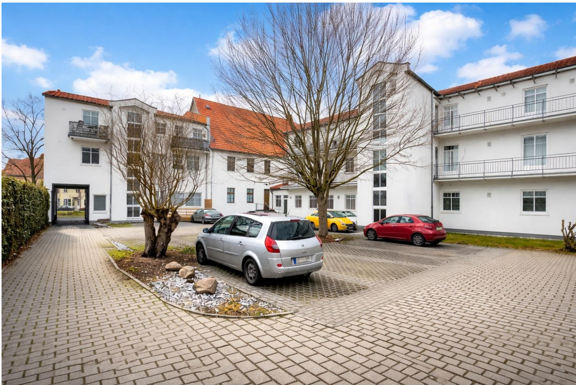
Hof mit Stellplätzen