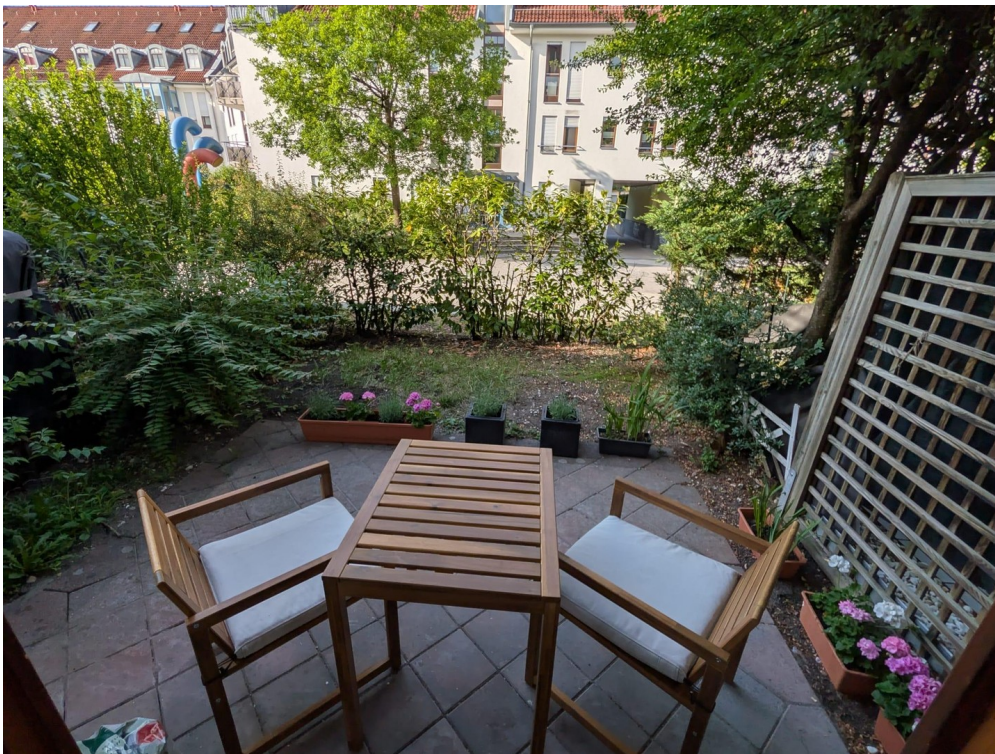
Terrasse mit Blick zum Garten