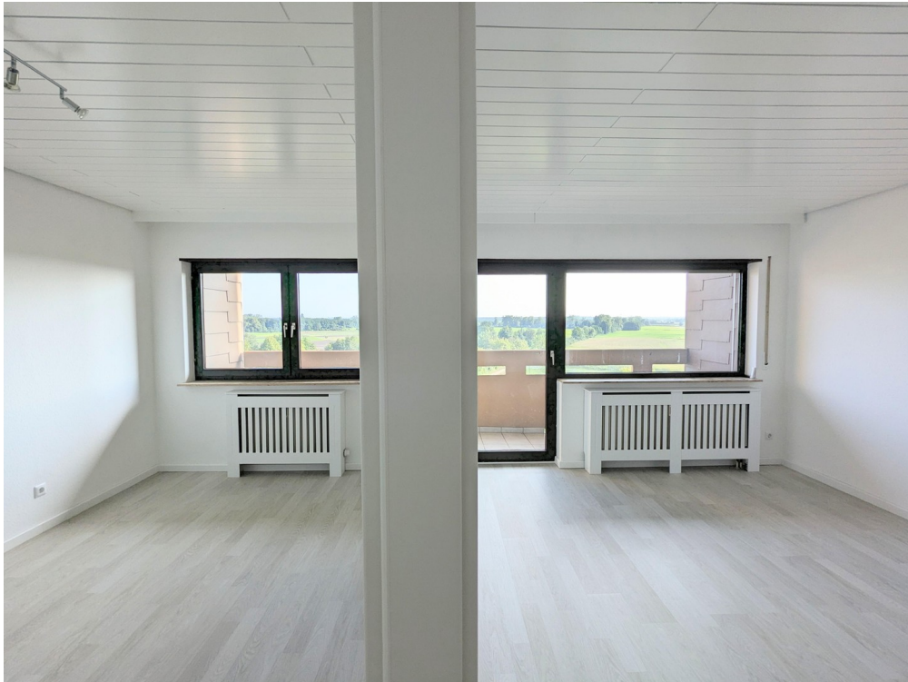
Schlafzimmer / Wohnzimmer