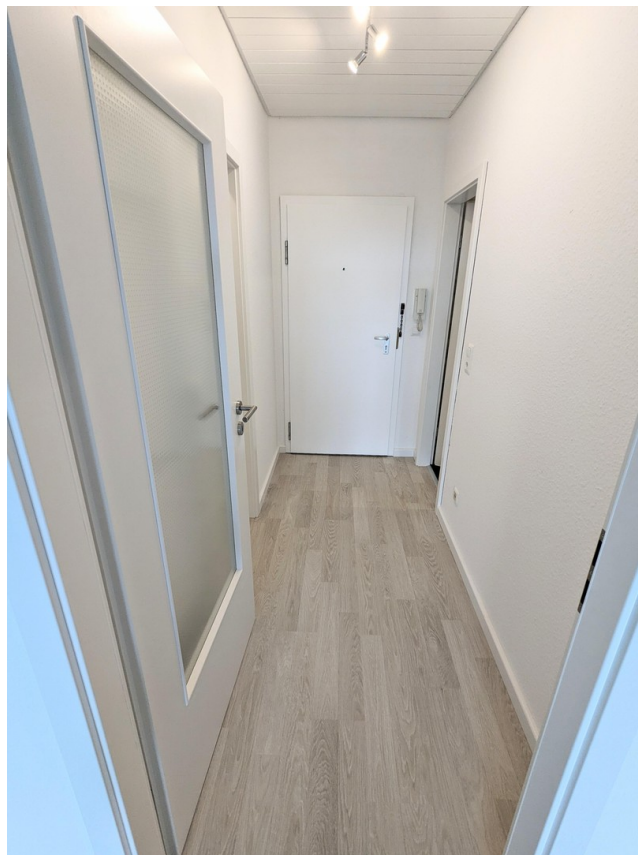
Flur / Eingangsbereich