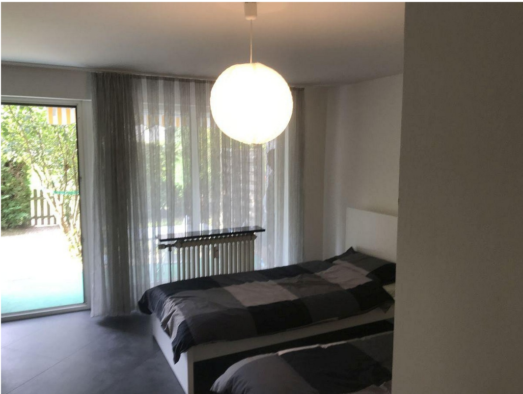
SCHLAFZIMMER ZUM GARTEN