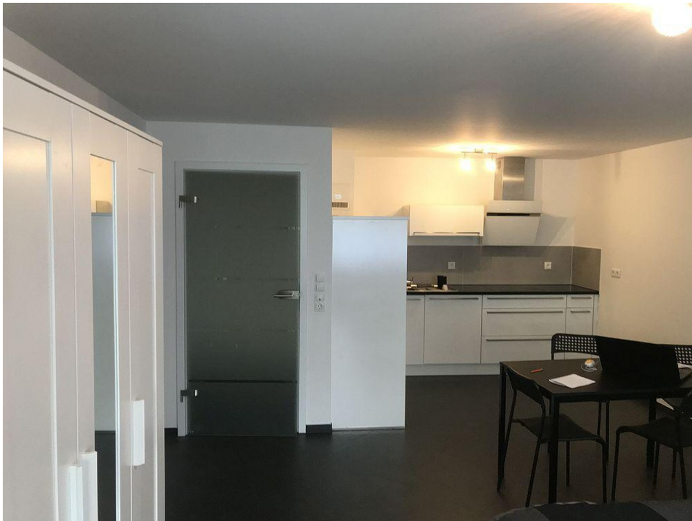
WOHNZIMMER MIT EBK