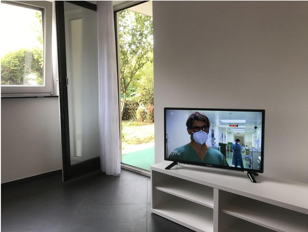
WOHNZIMMER ZUM GARTEN