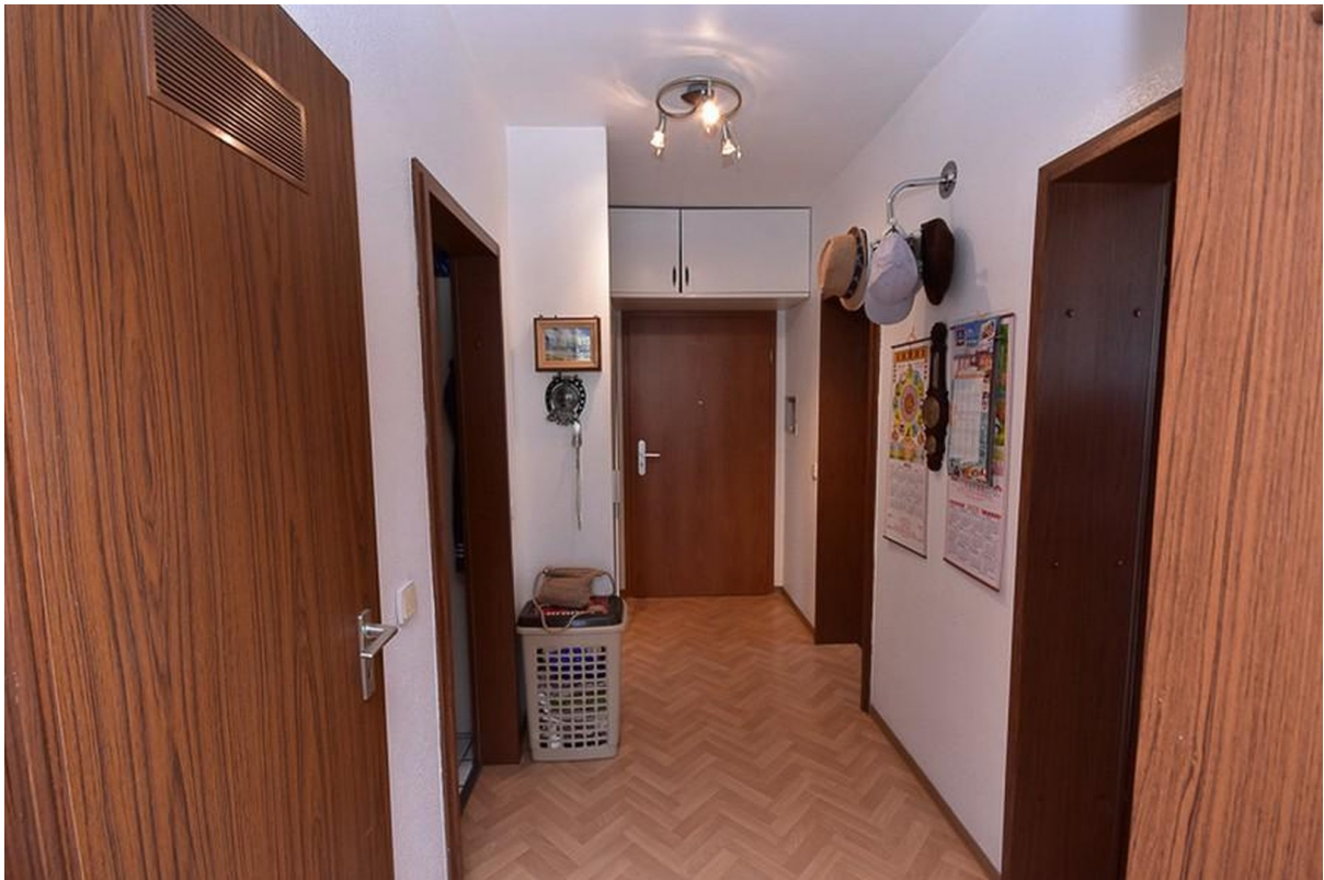
Flur vor der Sanierung