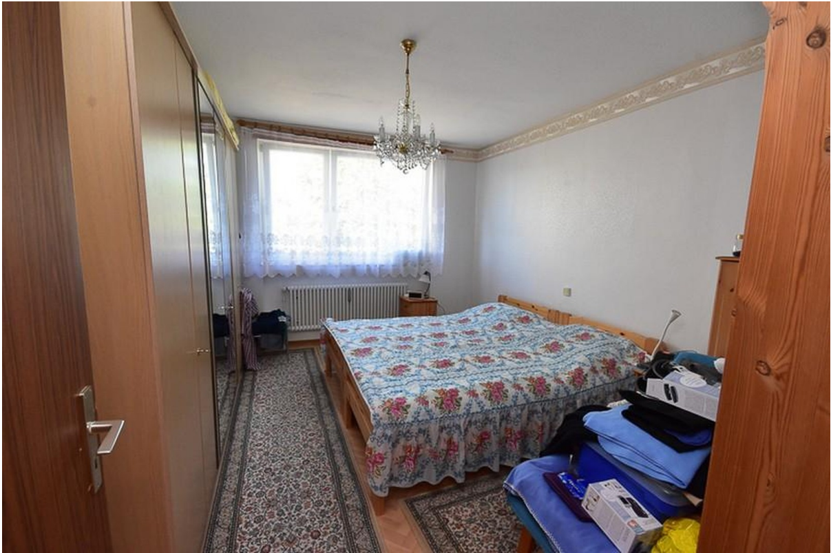
Schlafzimmer vor der Sanierung