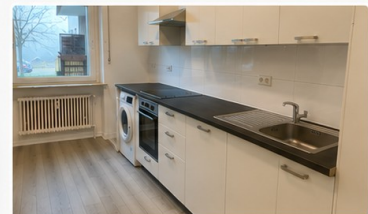
Beispielfoto Einbauküche (nagelneu inkl. Geräte & neuem Wäschetrockner)