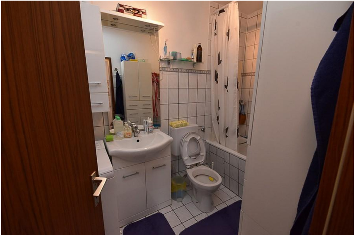
Bad vor der Sanierung