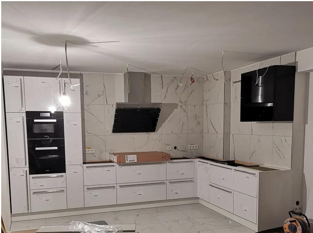
Küche - Aufbau