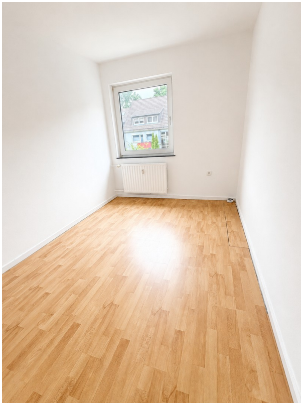
Büro / Kind