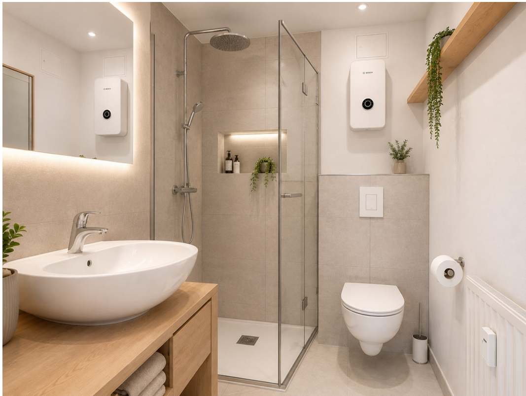
Visualisierung - Beispiel