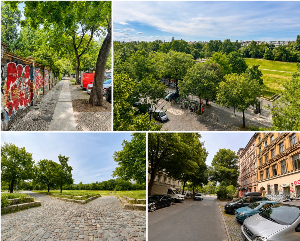
Weitblick über Park