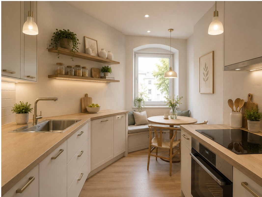
Visualisierung - Beispiel