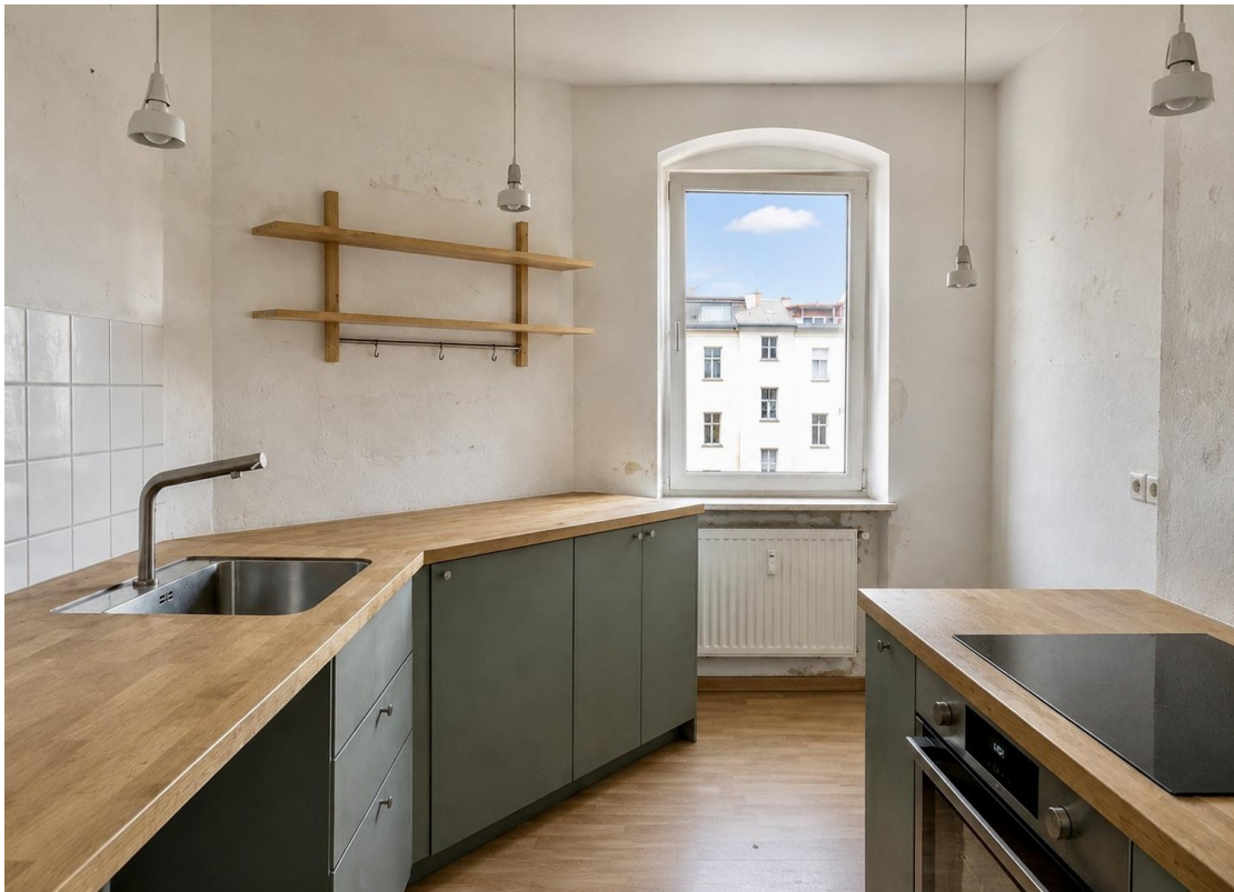
Küche + Küchenzeile - Original