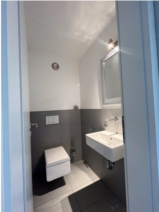
WC im EG