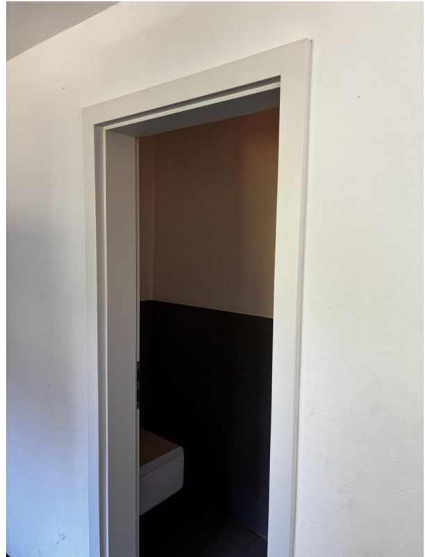
Gäste WC im EG