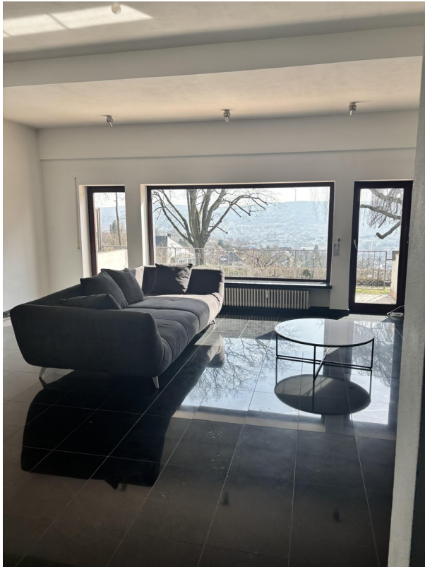
Wohnzimmer mit Stadtblick OG