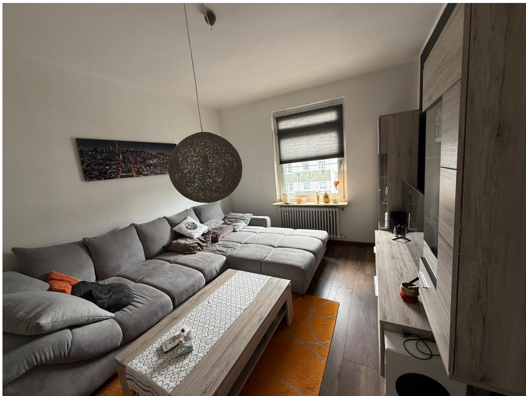
Wohnzimmer oder Schlafzimmer 2