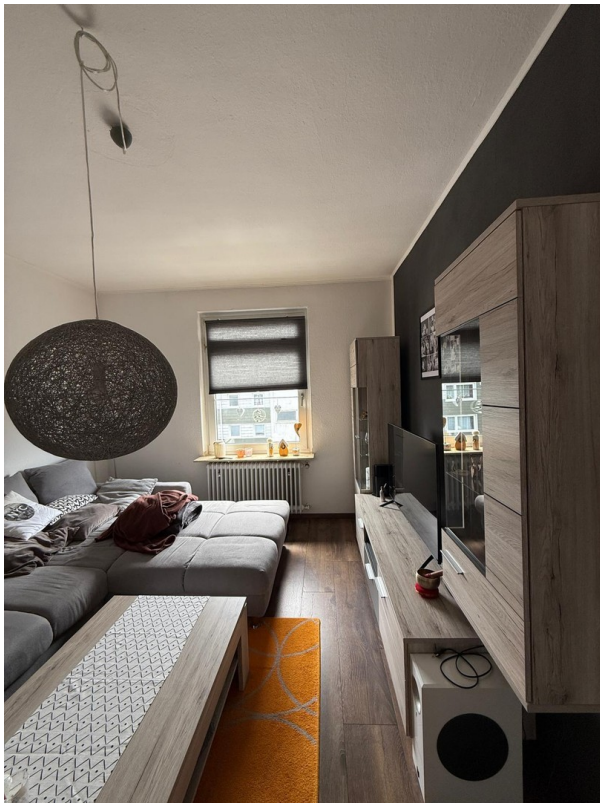
Wohnzimmer oder Schlafzimmer 2