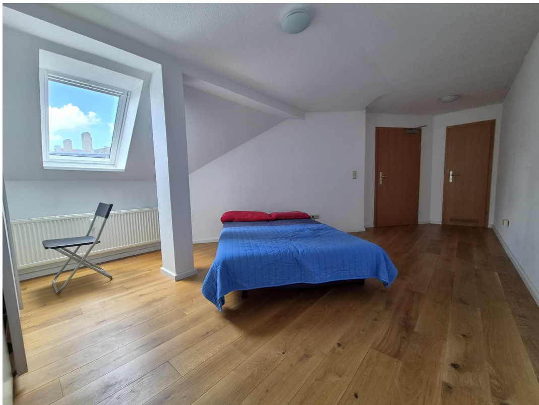
Schlafzimmer 2 / Zugang Treppe