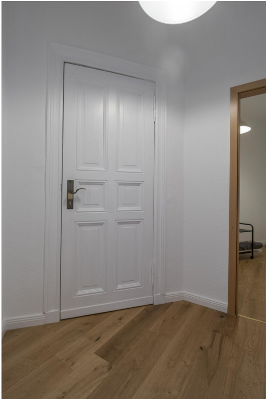
Flug / Zugang Treppe