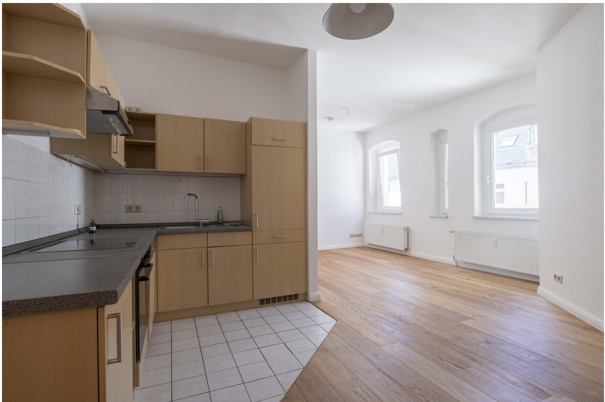
Küche / Essen / Wohnen