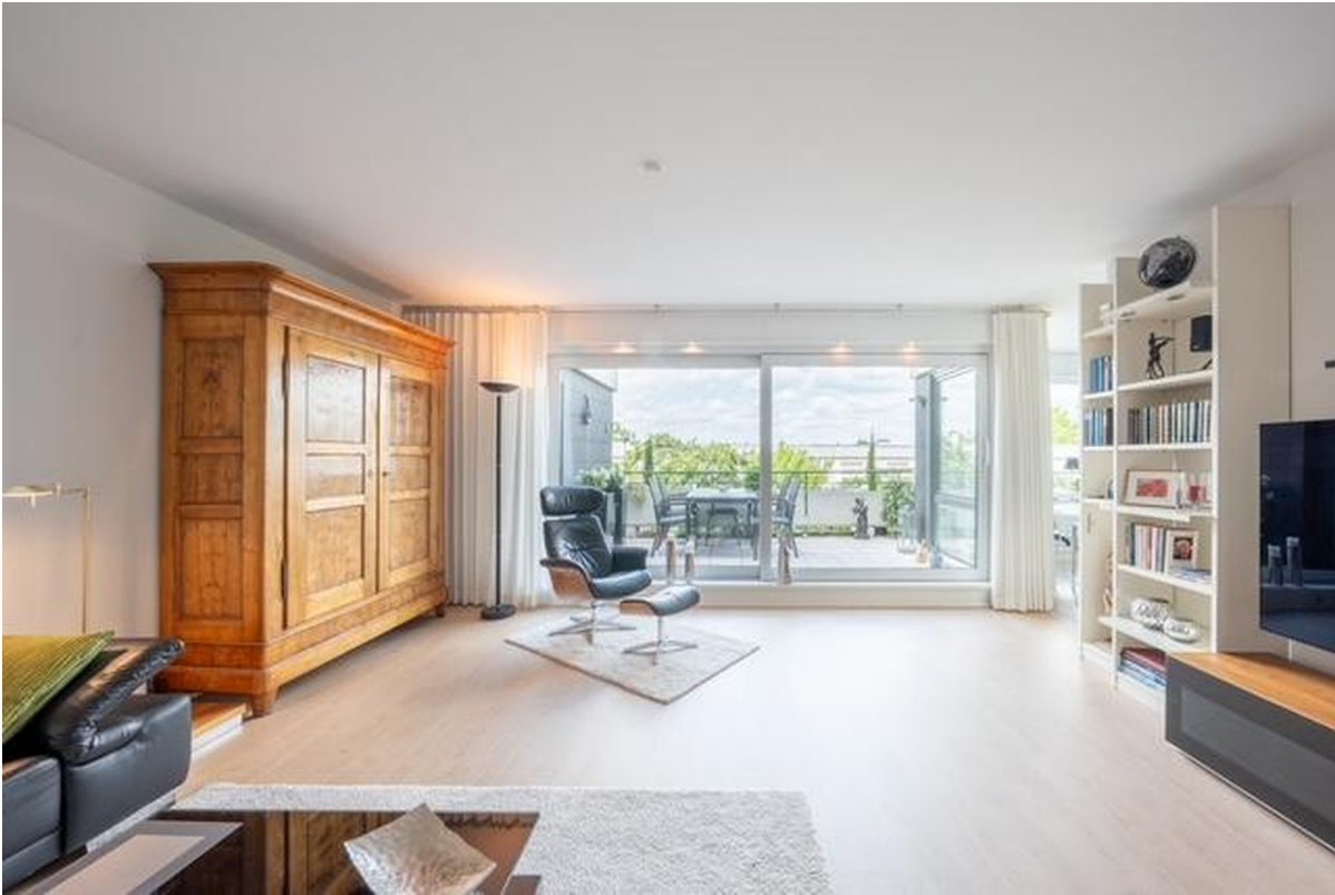
Wohnzimmer mit Terrasse