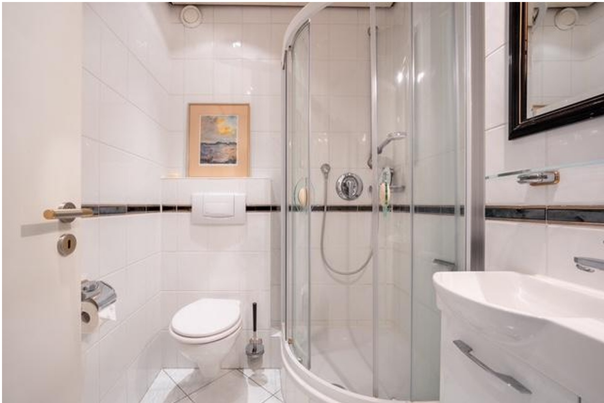
Gäste-WC mit Dusche