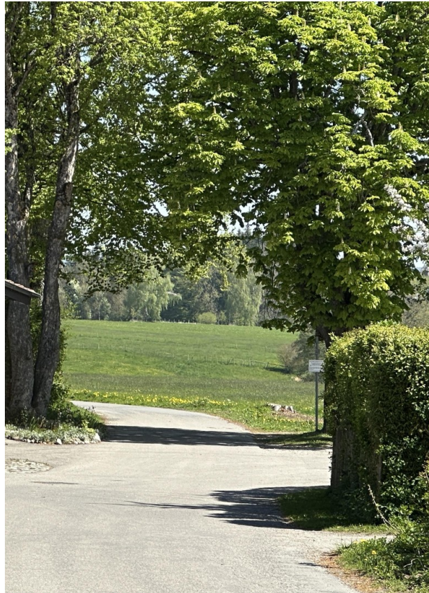
Aussicht v d Grundstücksgrenze