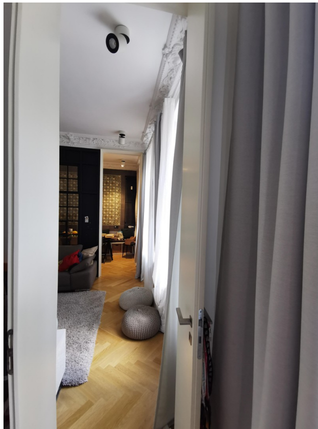
Blick Richtung Küche