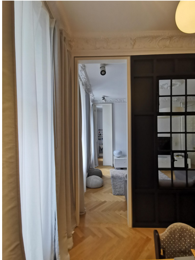
Blick Richtung Zimmer