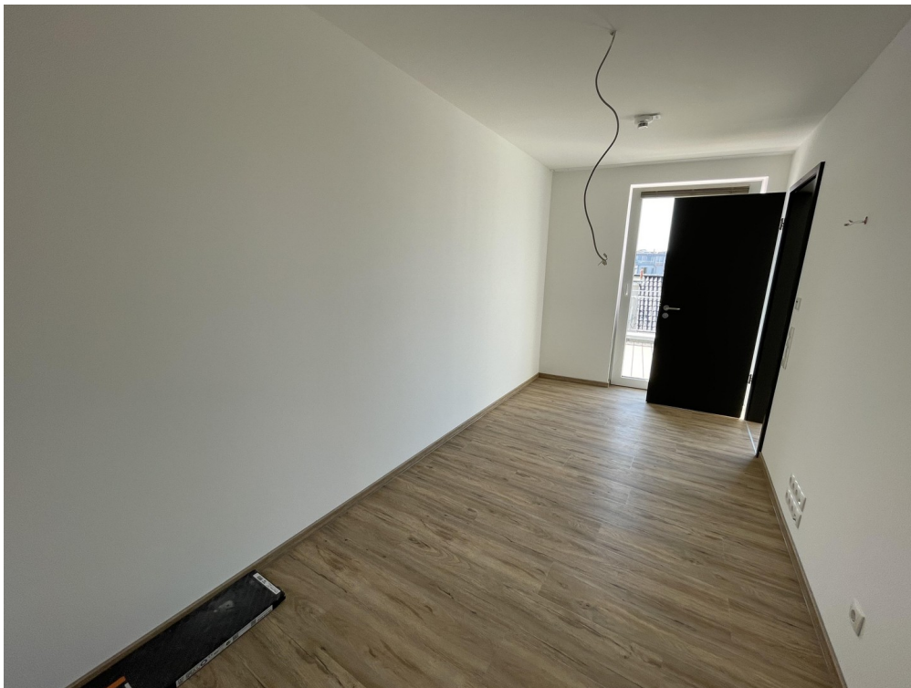
kein Platz für ein Doppelbett!