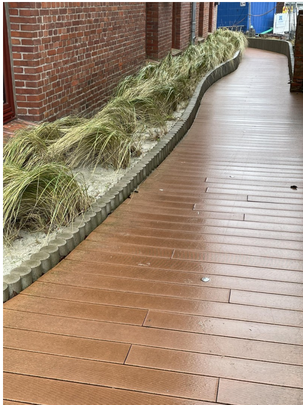
Zugang zum Gebäude