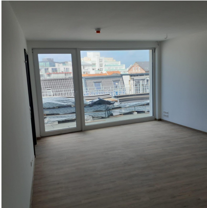
Wohnzimmer kurz vor dem Einzug