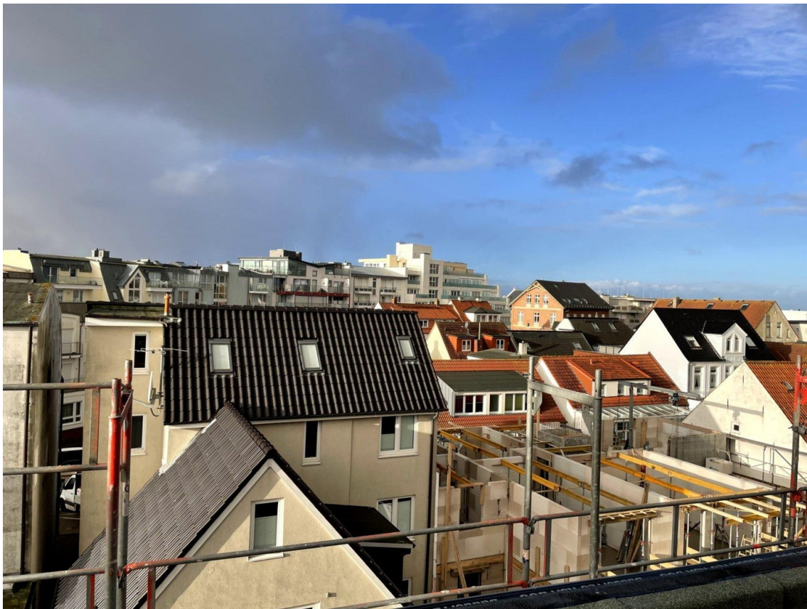
Blick von Dachterrasse 4.OG