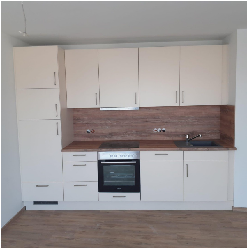
Pantryküche im Wohnzimmer