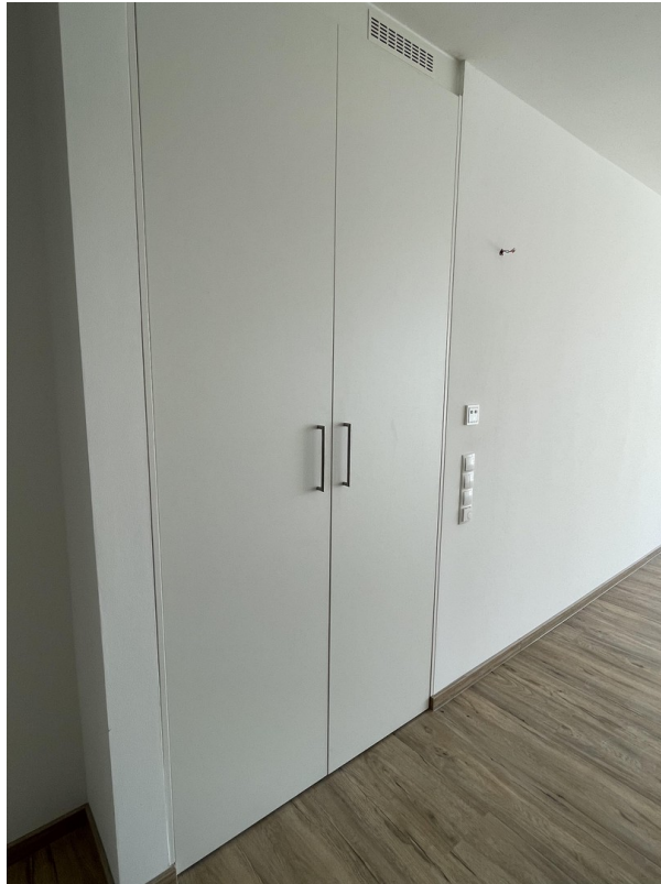
Abstellkammer für Waschmaschin