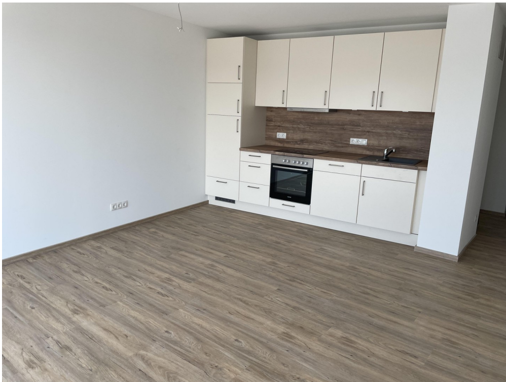
Blick auf die Küche