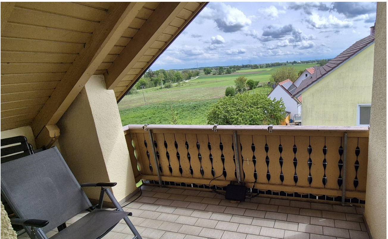
DG Loggia Balkon