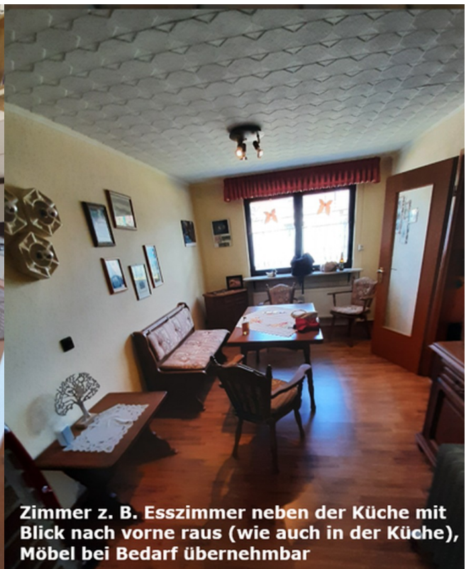
Zimmer z. B. Esszimmer neben der Küche mit Blick nach vorne raus (wie auch in der Küche), Möbel bei Bedarf übernehmbar