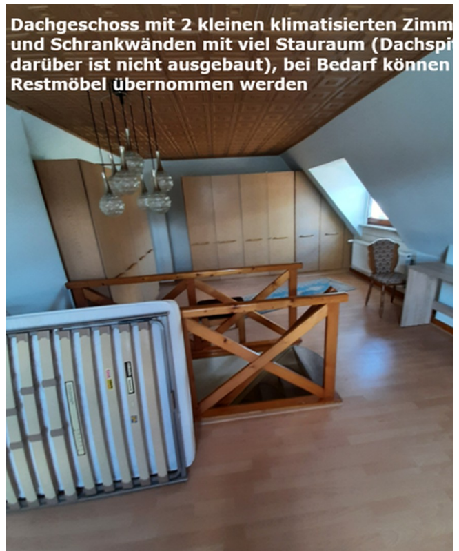
Dachgeschoss mit 2 kleinen klimatisierten Zimmern und Schrankwänden mit viel Stauraum (Dachspitze darüber ist nicht ausgebaut), bei Bedarf können Restmöbel übernommen werden