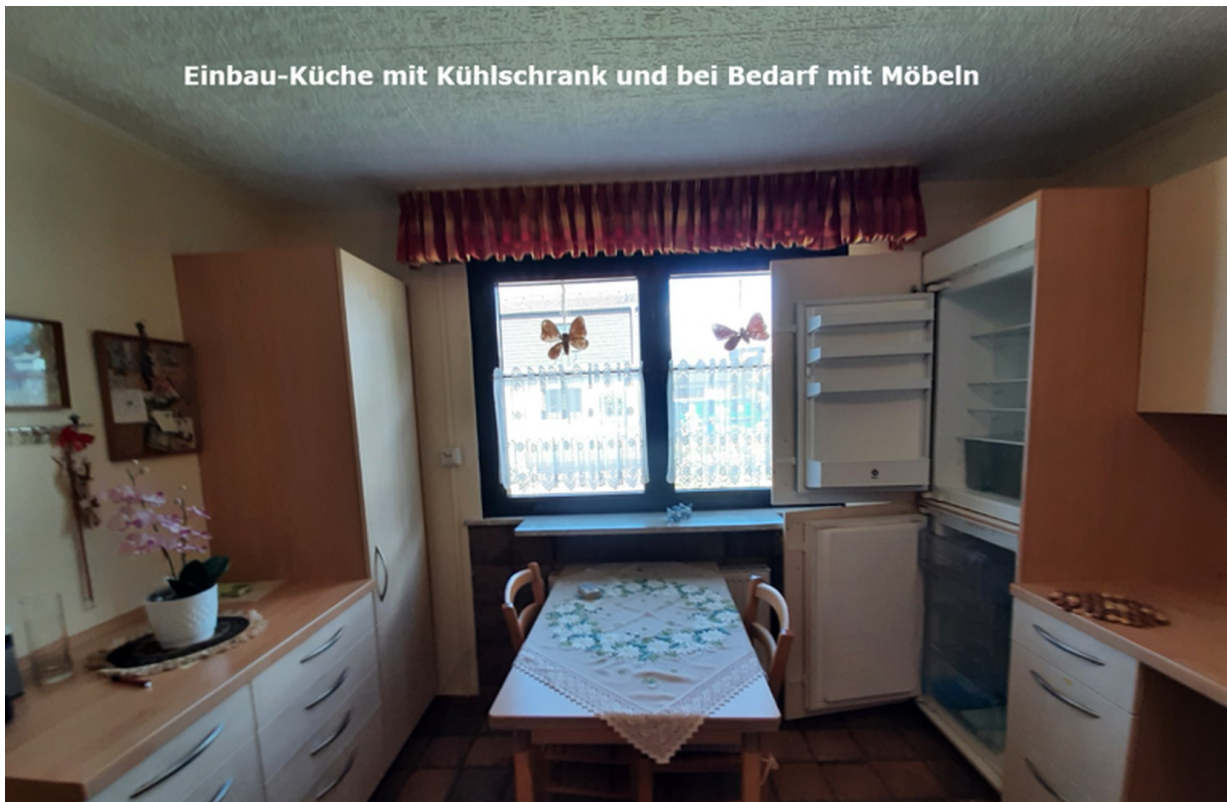
Einbau-Küche mit Kühlschrank und bei Bedarf mit Möbeln