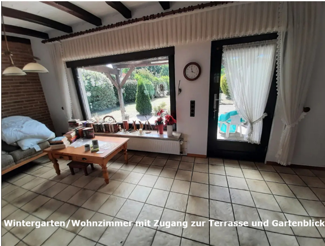
Wintergarten/Wohnzimmer mit Zugang zur Terrasse und Gartenblick