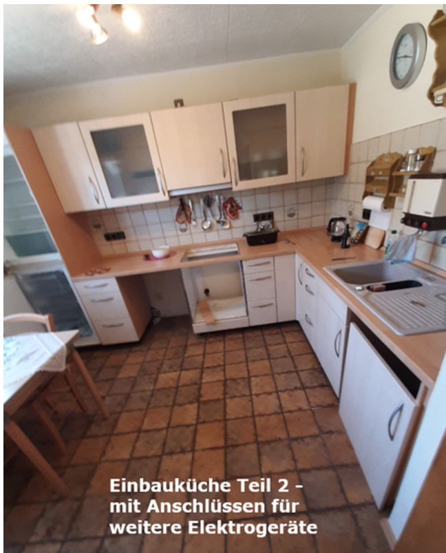
Einbauküche Teil 2 - mit Anschlüssen für weitere Elektrogeräte