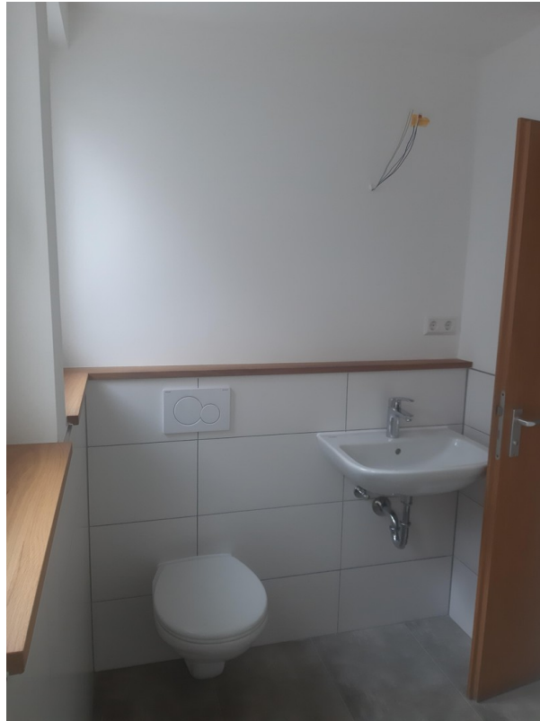
Bad mit WC