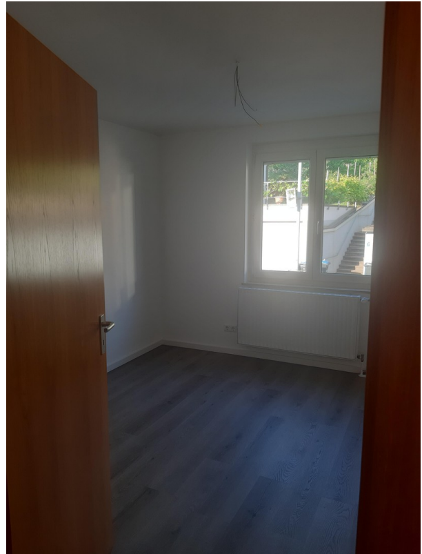
Kinder- oder Arbeitszimmer