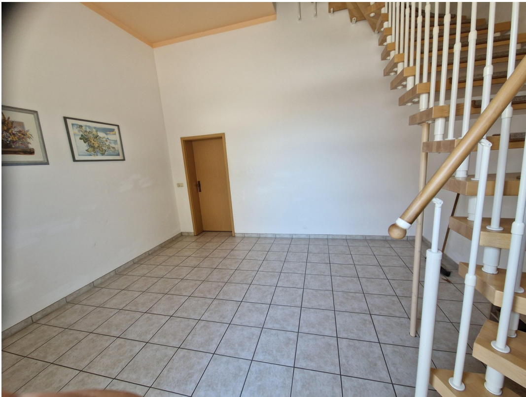
Hausflur mit Wohnungseingang