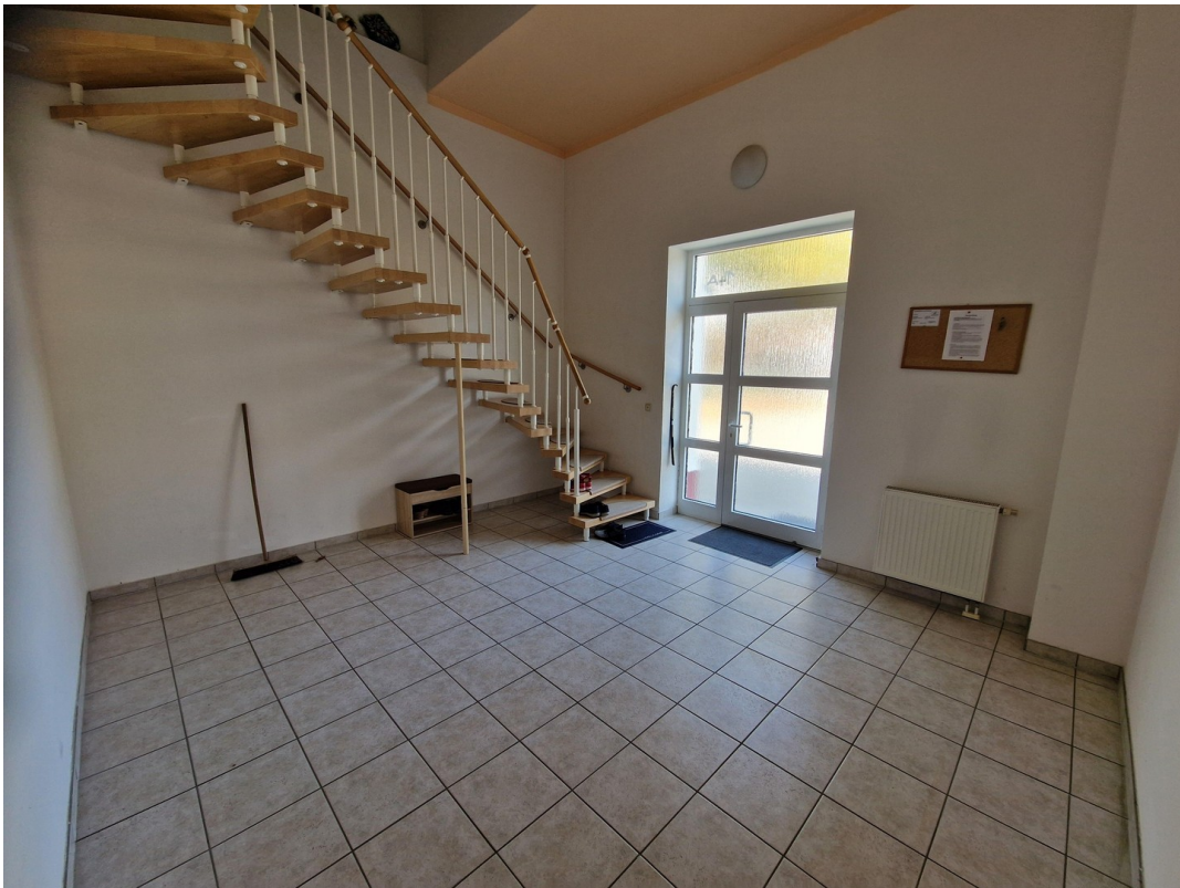
Hausflur mit Eingangsbereich