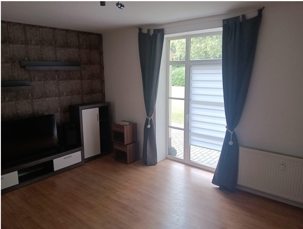
Wohnzimmer mit Terrassentür