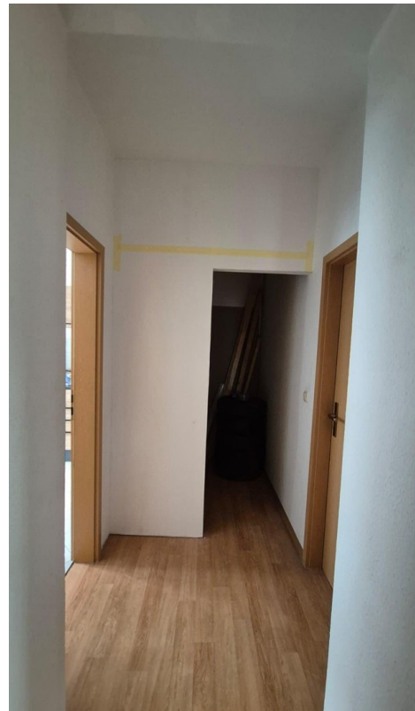
Abstellraum (noch in Bau)