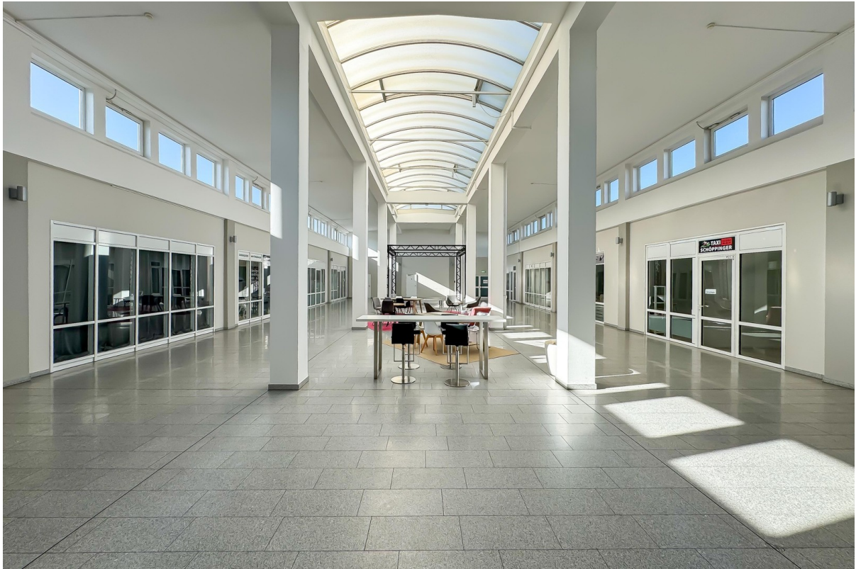
Impression Foyerbereich 2. OG