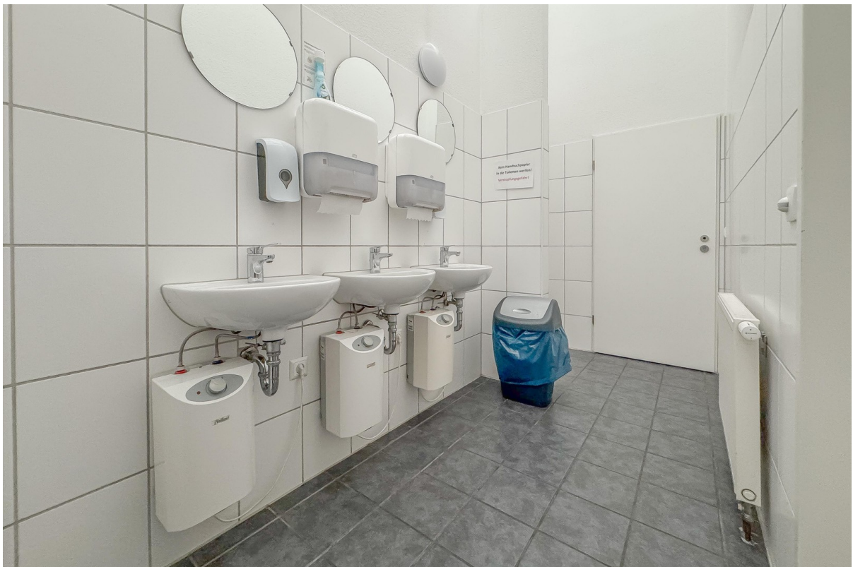
WC-Anlagen (D/H/B getrennt)