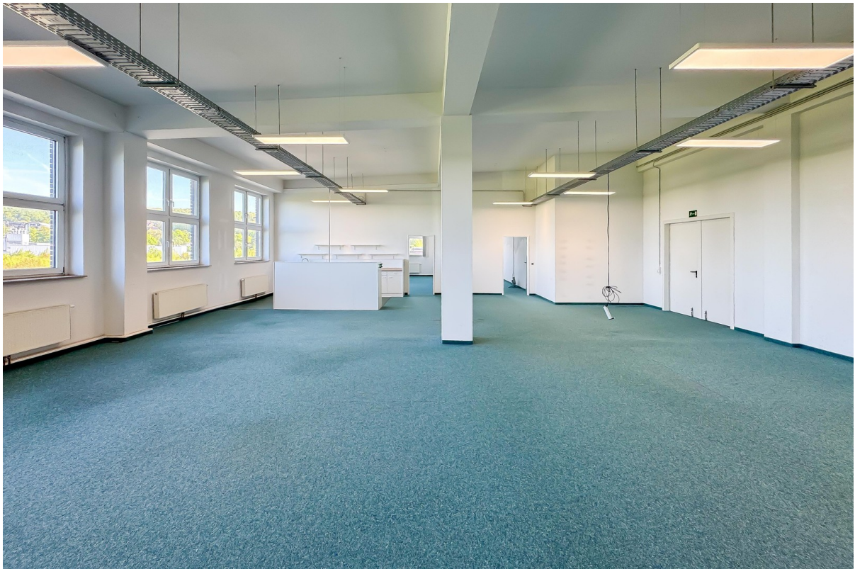
Lagerfläche mit Einbauküche