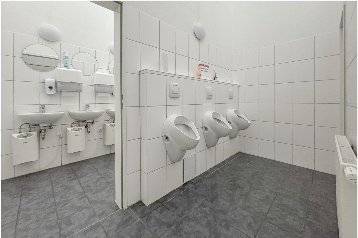
WC-Anlagen (D/H/B getrennt)