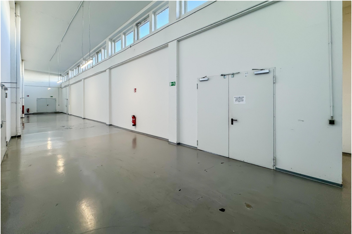
Eingang Einheit - Doppeltür