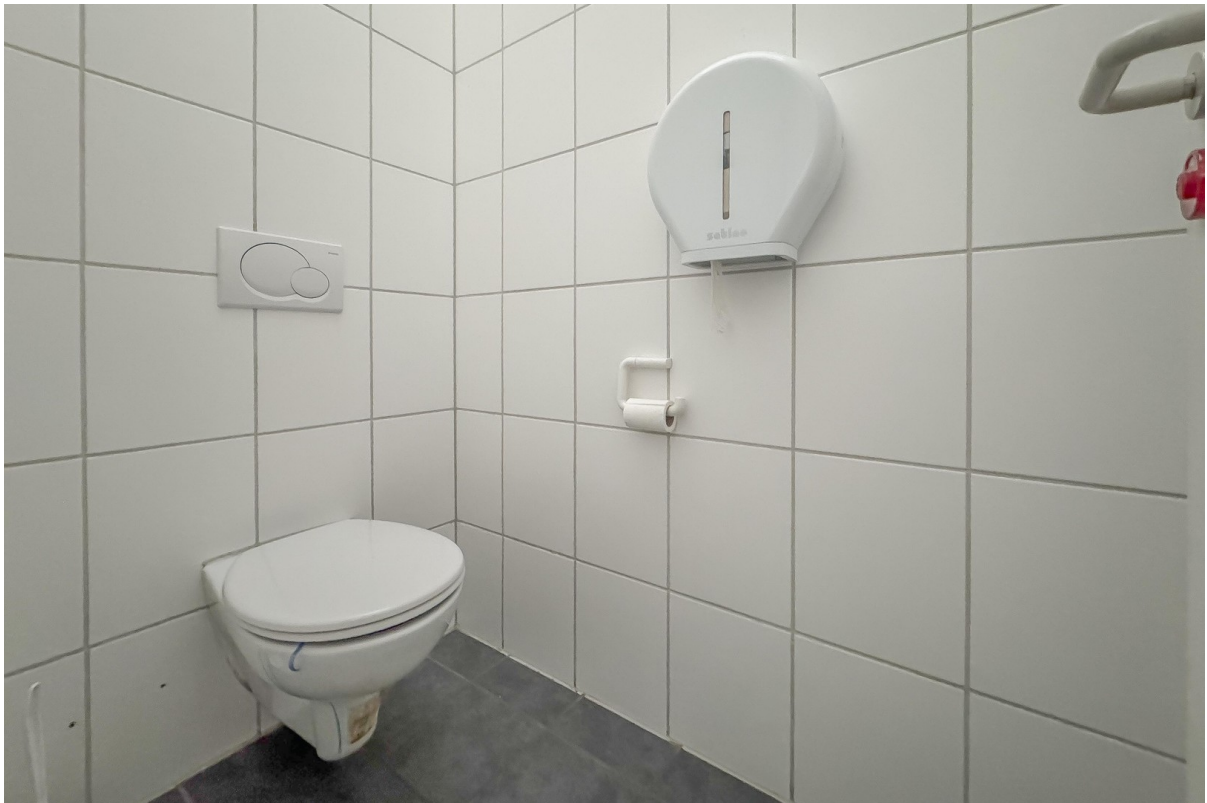
WC-Anlagen (D/H/B getrennt)