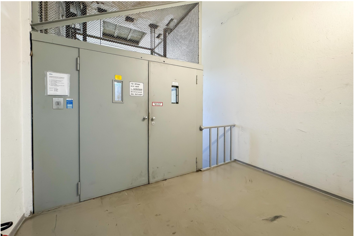
Lastenaufzug bis zu 2 Tonnen