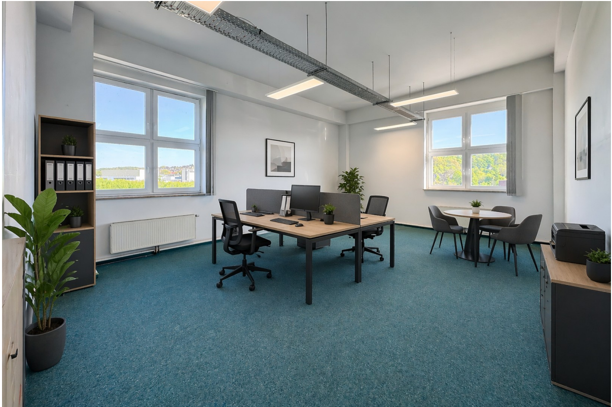
Büro 1 - Visualisierung