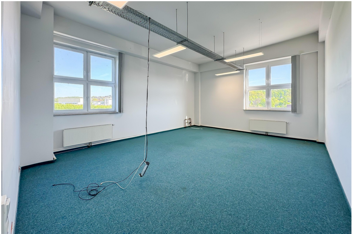
Büro 1 - ca. 43 qm