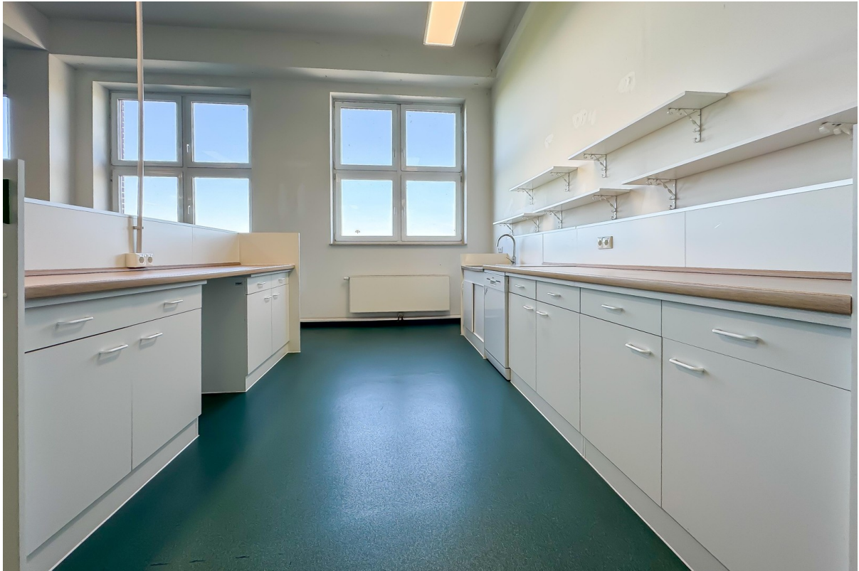
Einbauküche mit Spülmaschine