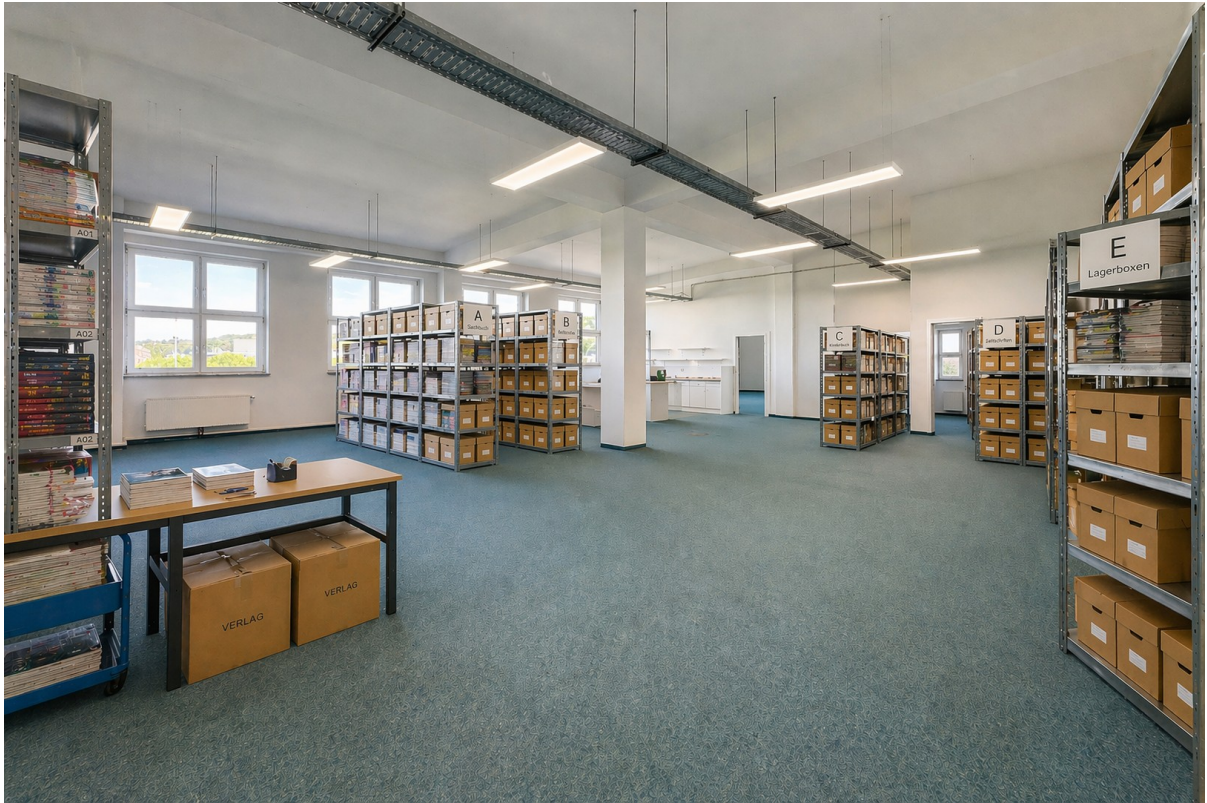
Lagerfläche - Visualisierung