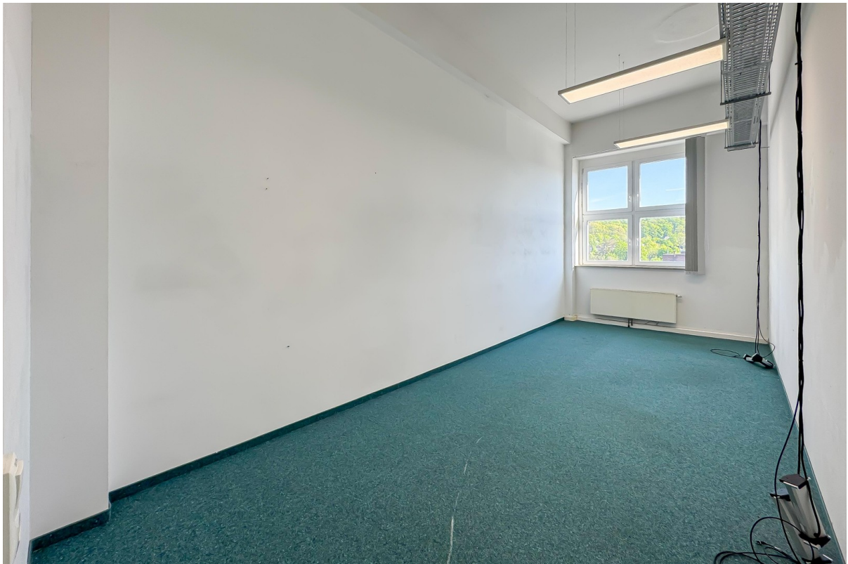
Büro 2 - ca. 23 qm