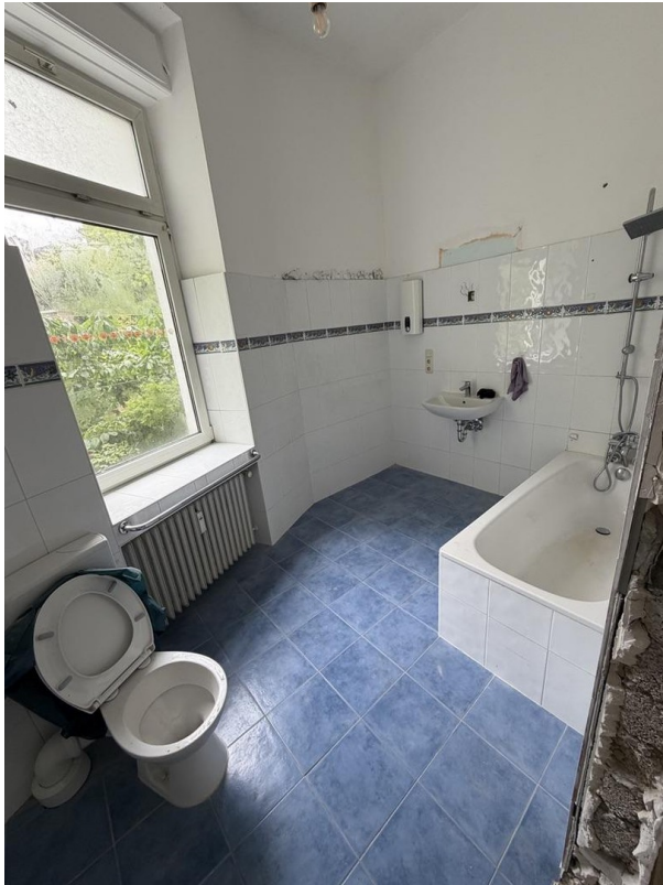
Bad bald mit Wanne & Dusche