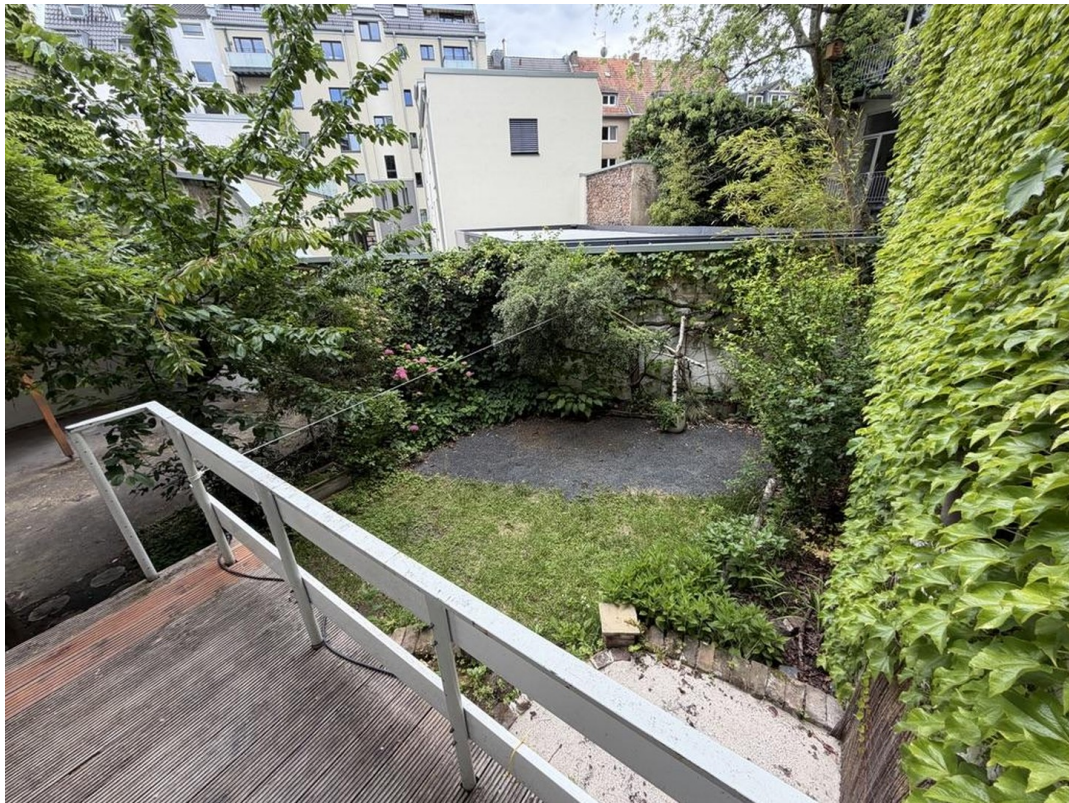
Balkon inkl. Garten/Terrasse