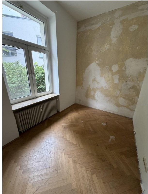
Zimmer 2 nach Eingang links