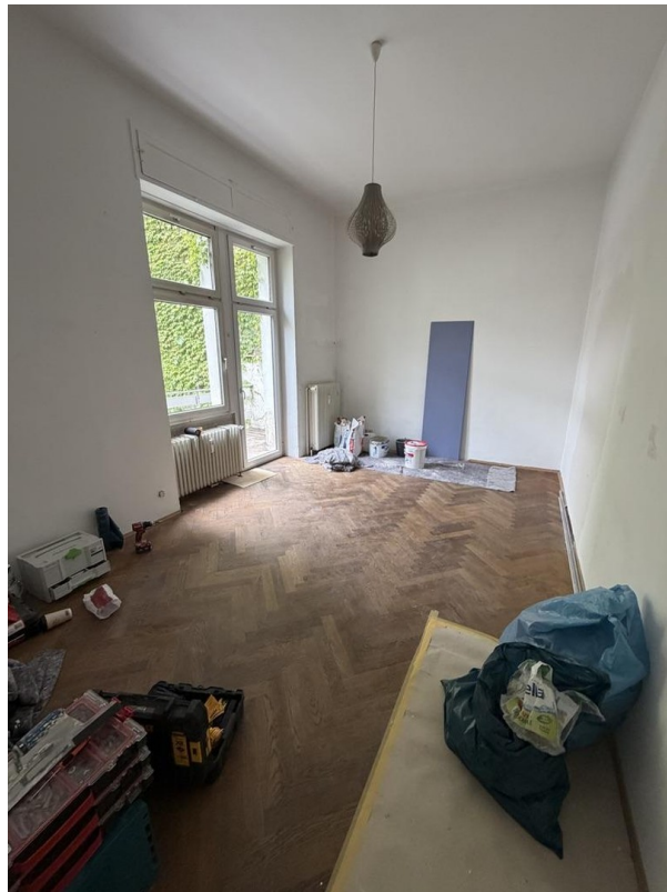
Zimmer 4 mit Gartenzugang