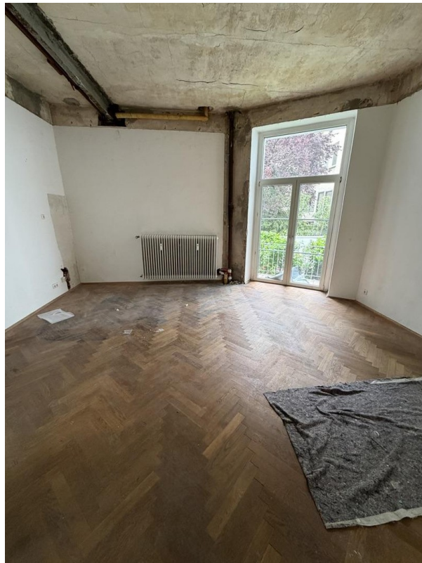
Zimmer 1 mit Balkon