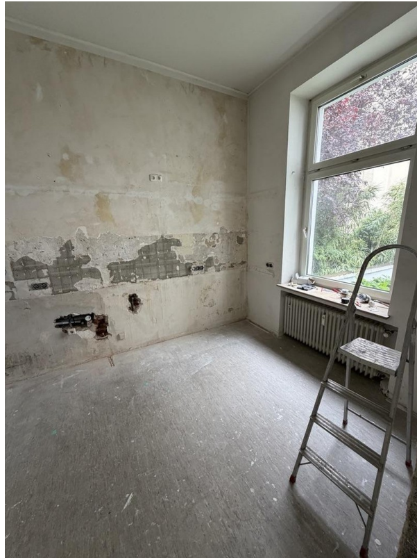
Zimmer 5 hinter Küche