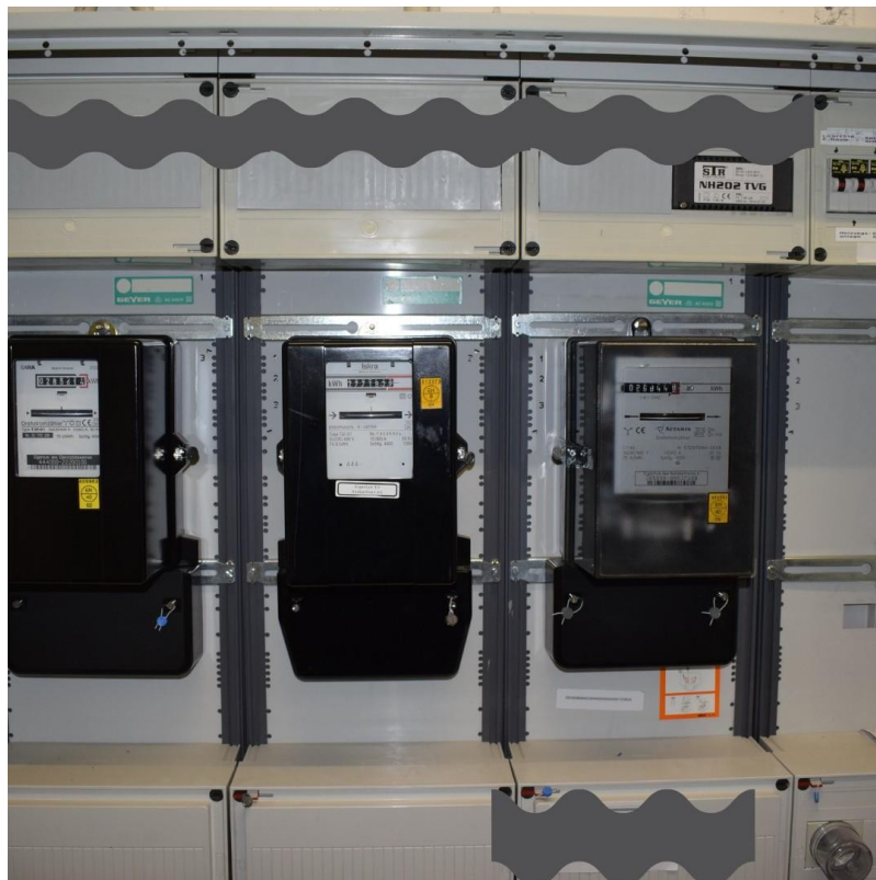
Zähler im Hausanschlussraum