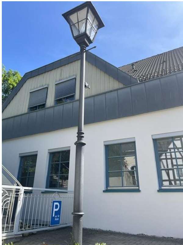
Erdgeschoss und Obergeschoss