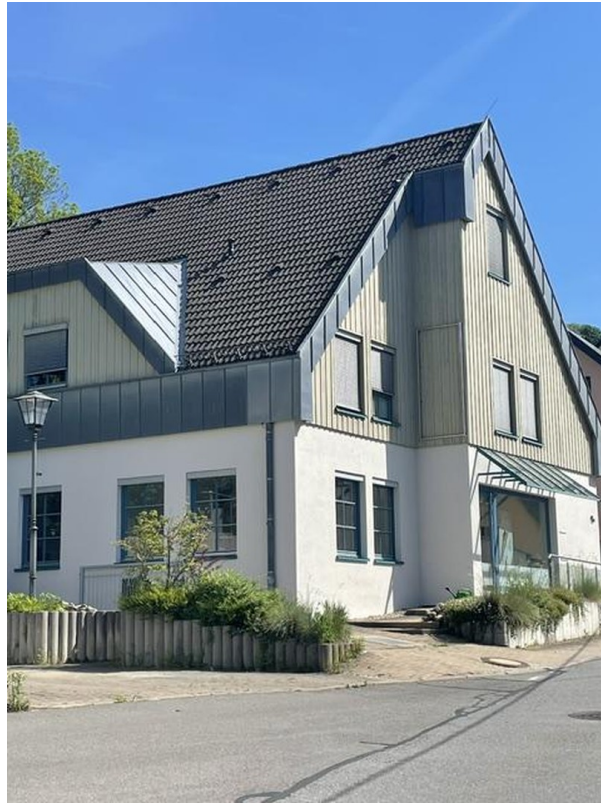
Haus von der Straßenseite