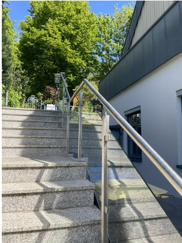
Treppenanlage zum Obergeschoss