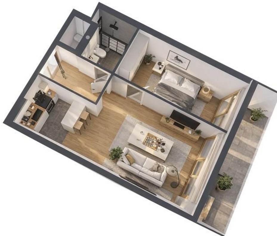
3 D Grundriss