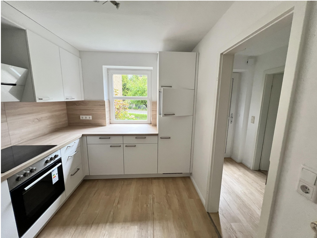
Küche Teil 2