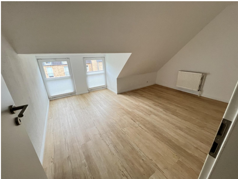
DG-zimmer1 mit Ankleideraum