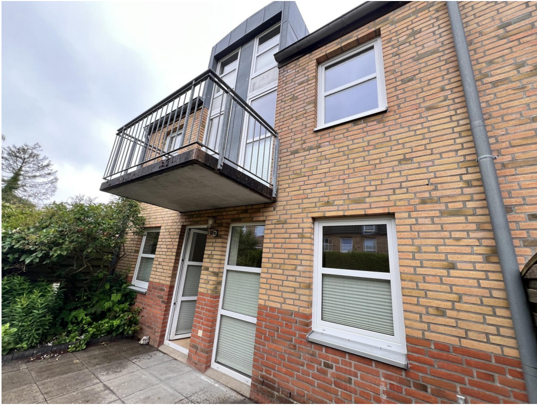
Ansicht Terrasse mit Balkon