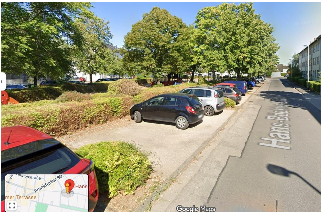
Umgebung mit Bäumen