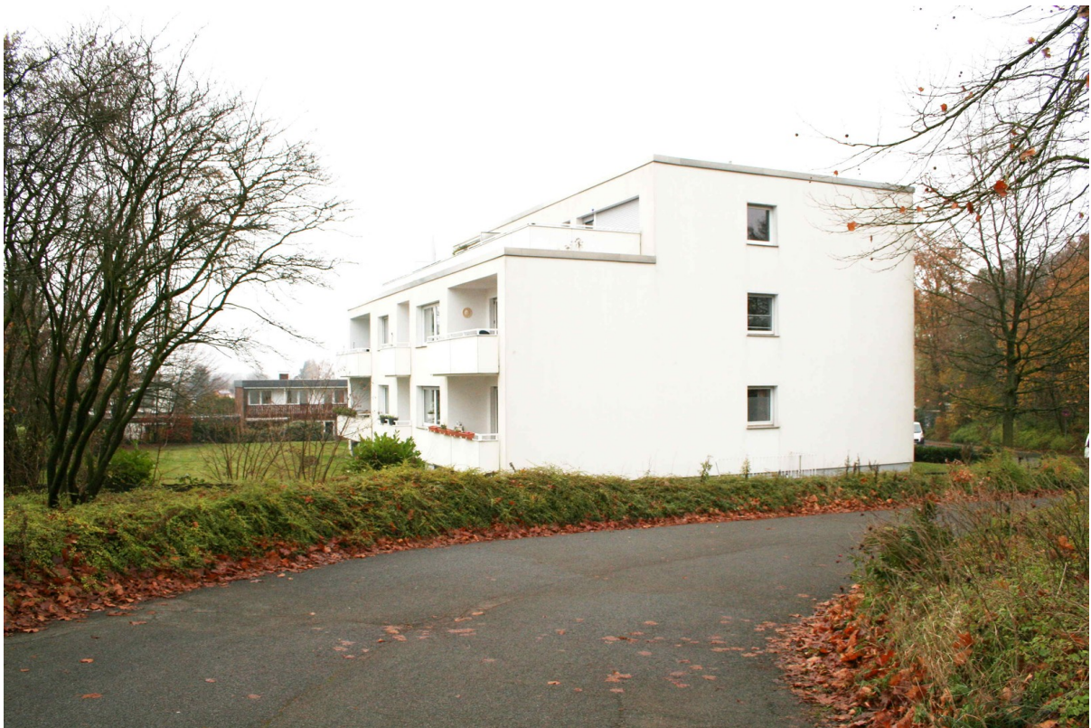
Seitenansicht des Hauses