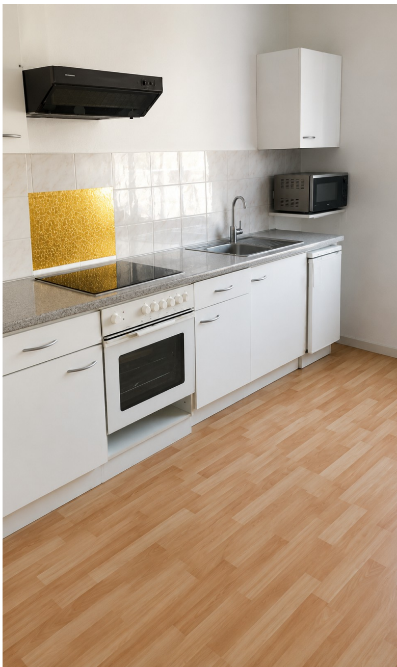
Wohnküche mit Einbauküche