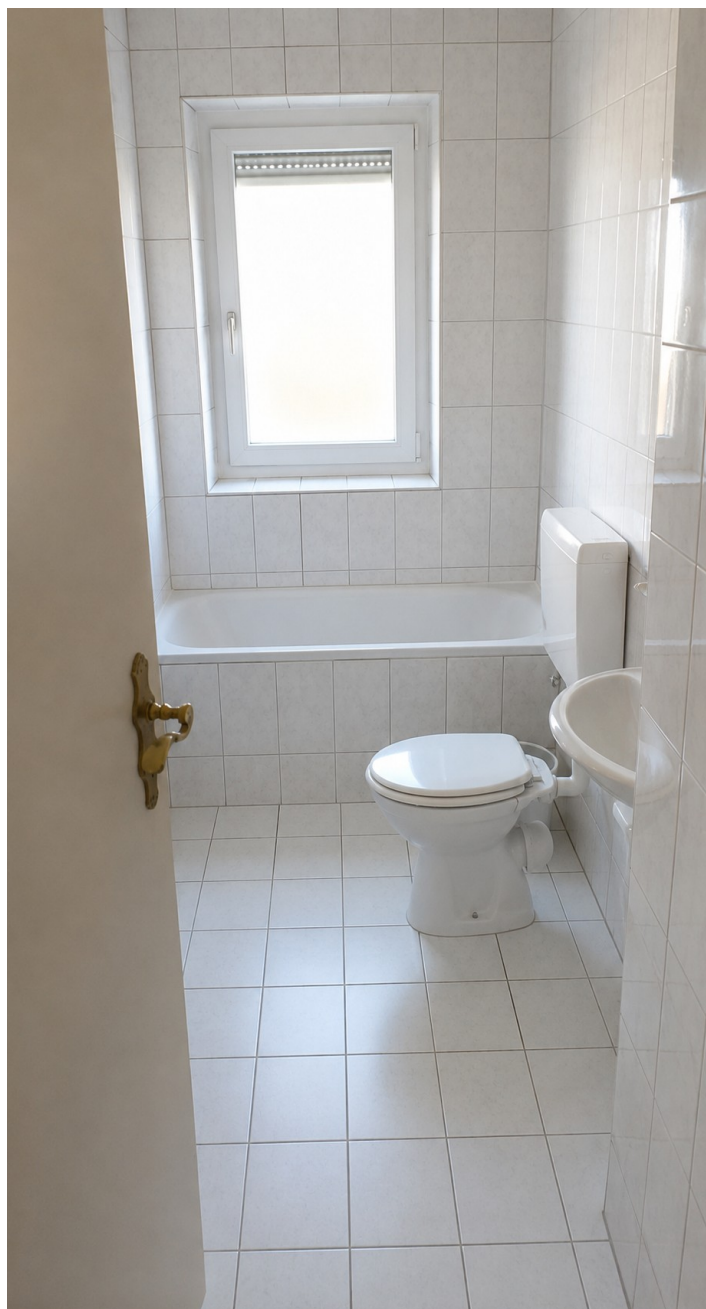
Bad mit weißem WC-Deckel, ohne Teppiche, Klobürste, Waschmaschine und Trockner