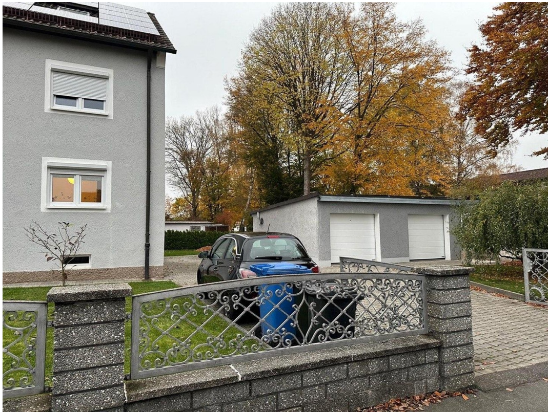
Garagen und Stellplätze