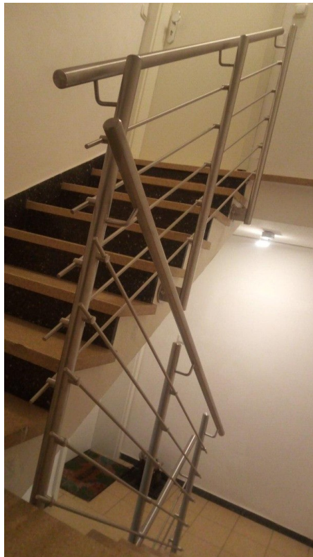
Aufgang zum DG