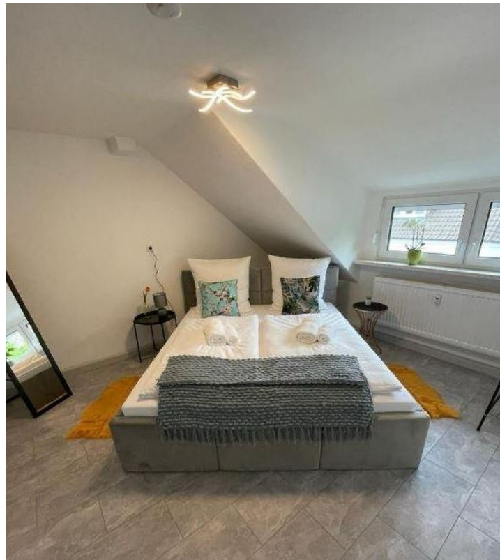
2. Schlafzimmer DG