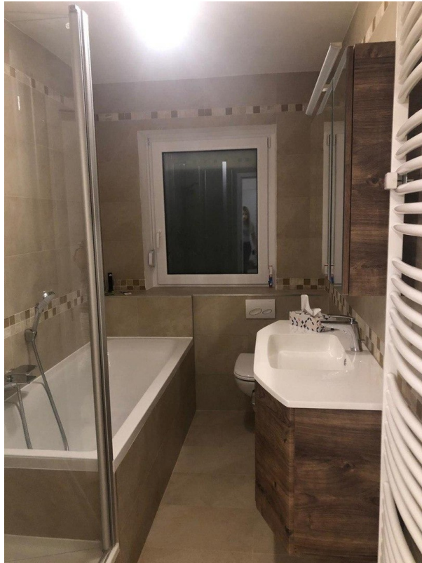
Bad im 1.OG