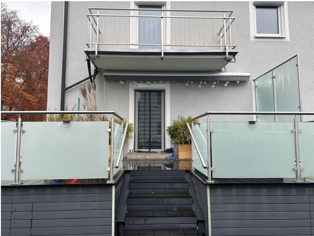
Terrasse mit Garten-Zugang