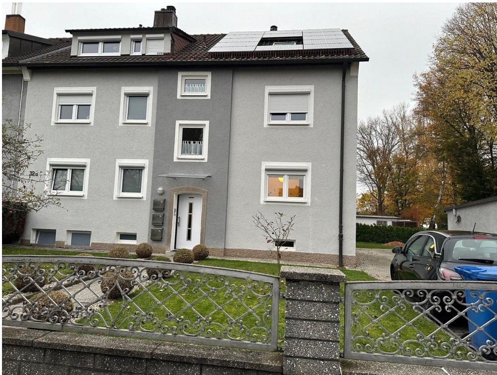
Haus mit Eingang