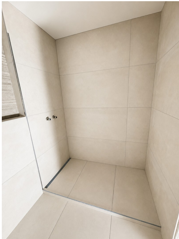
Bad - aktueller Stand