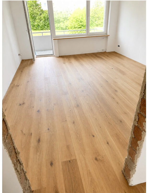
Wohnzimmer - aktueller Stand