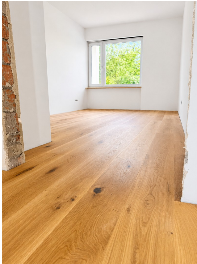
Schlafzimmer1 - akt. Stand