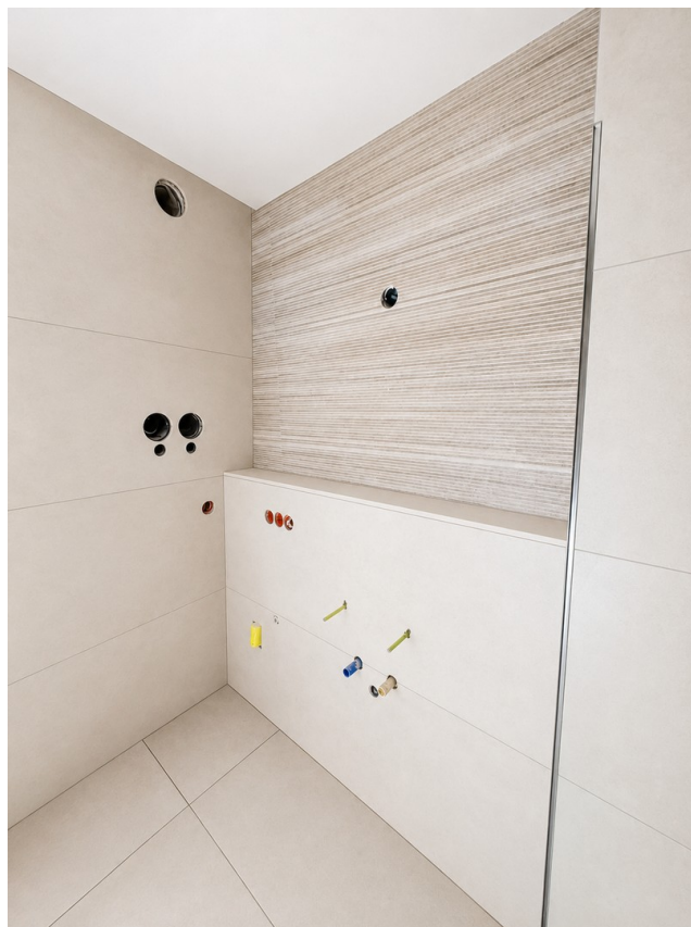
Bad - aktueller Stand