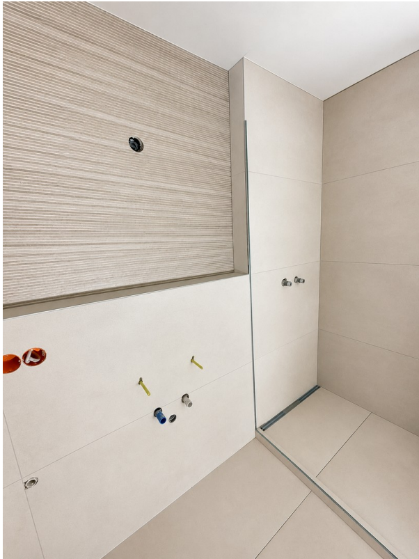
Bad - aktueller Stand