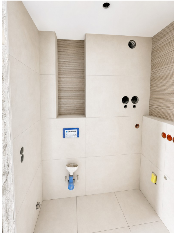
Bad - aktueller Stand