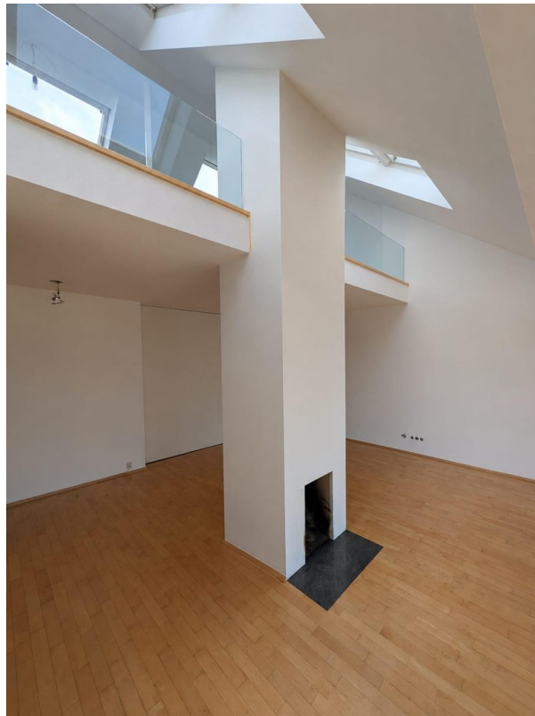
Galerie mit offenem Wohnkonzept