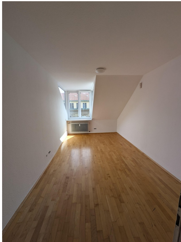
Kinderzimmer / Ankleidezimmer