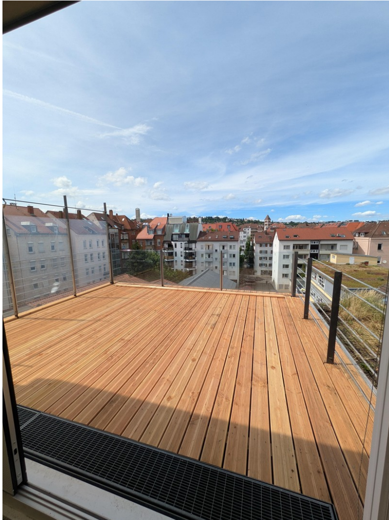
Blick über Stuttgart West