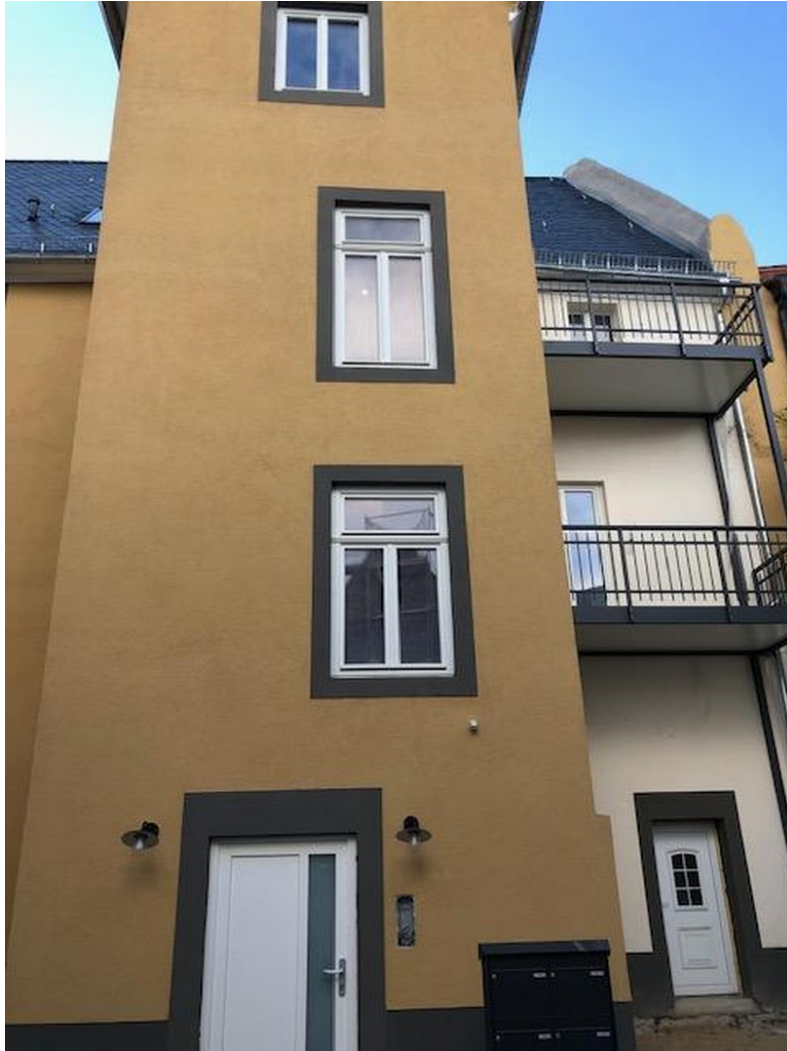
Stadthaus aus dem 12. Jhd.