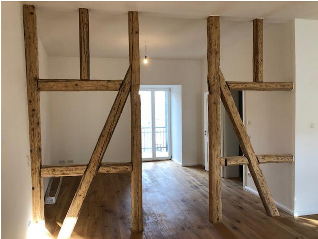
Arbeitszimmer / Lesezimmer