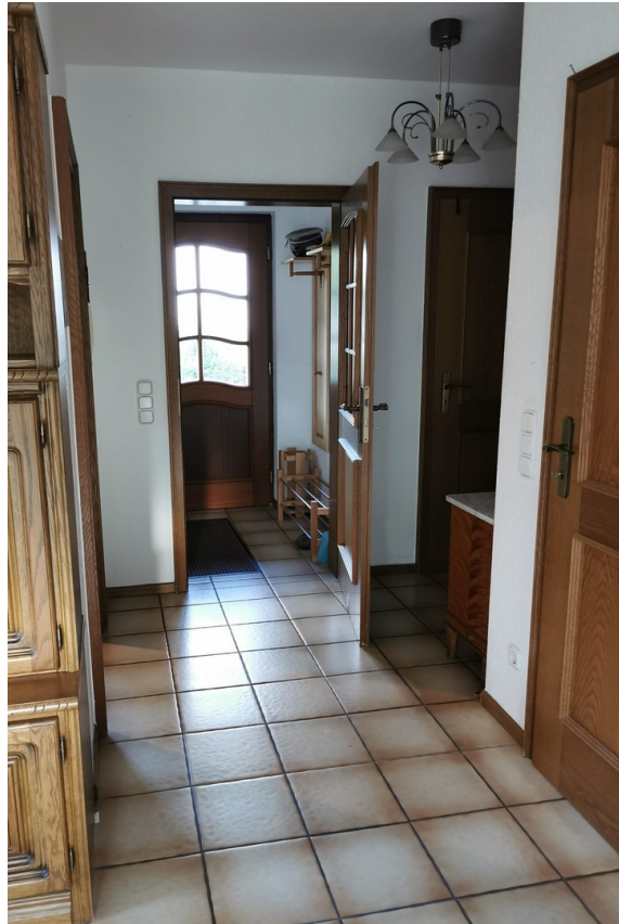
Flur und Eingangsbereich