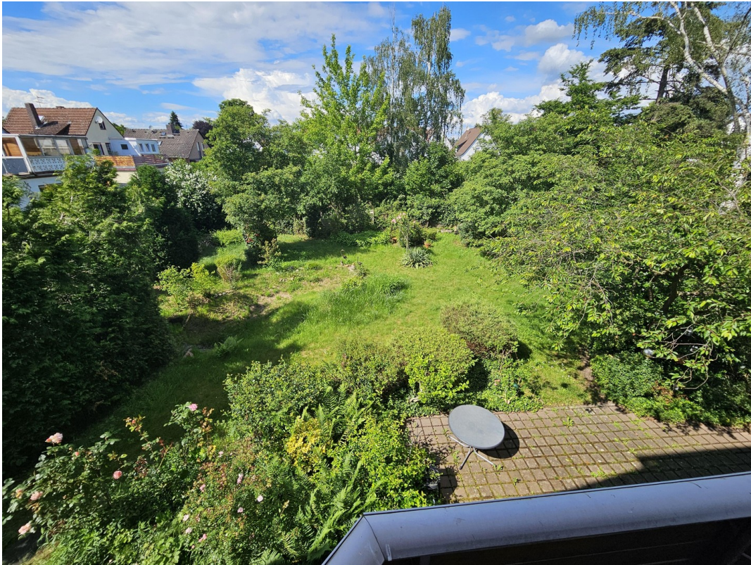
Balkonblick (SZ und KiZi 2)