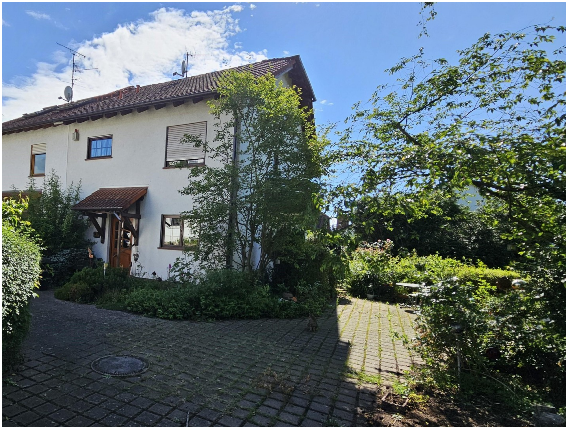
DHH am Ende eines Privatwegs