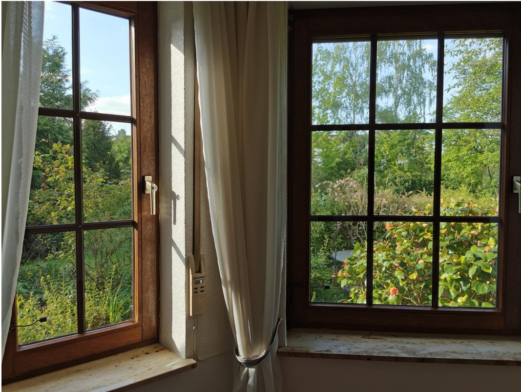
Gartenblick vom Ess-Erker aus