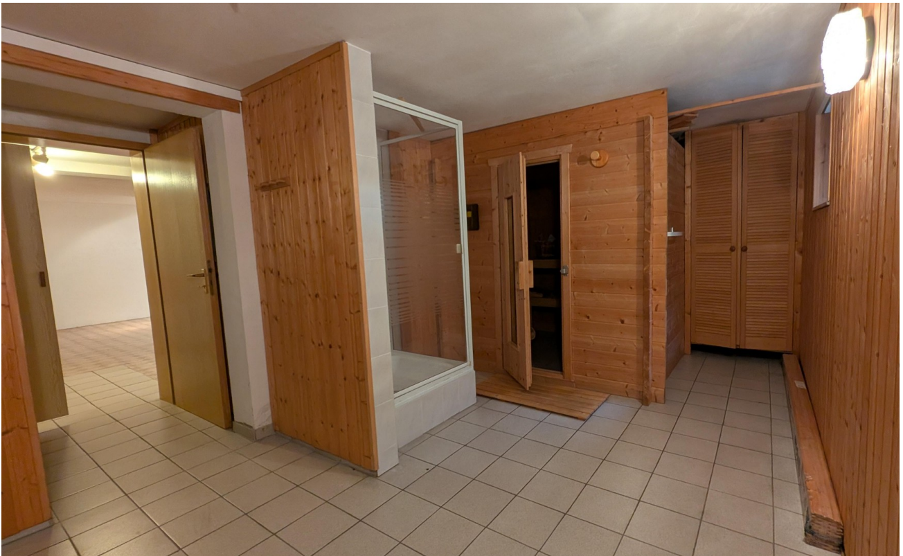
KG (Waschküche, Sauna)