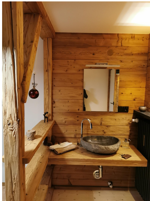
Chalet Zimmer DG