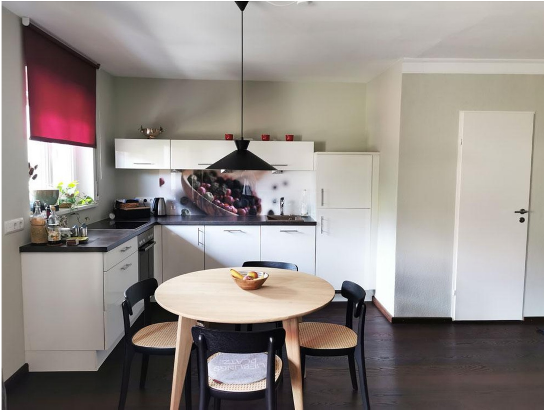
Küche mit Essplatz