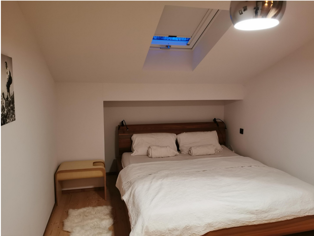
Chalet Zimmer DG