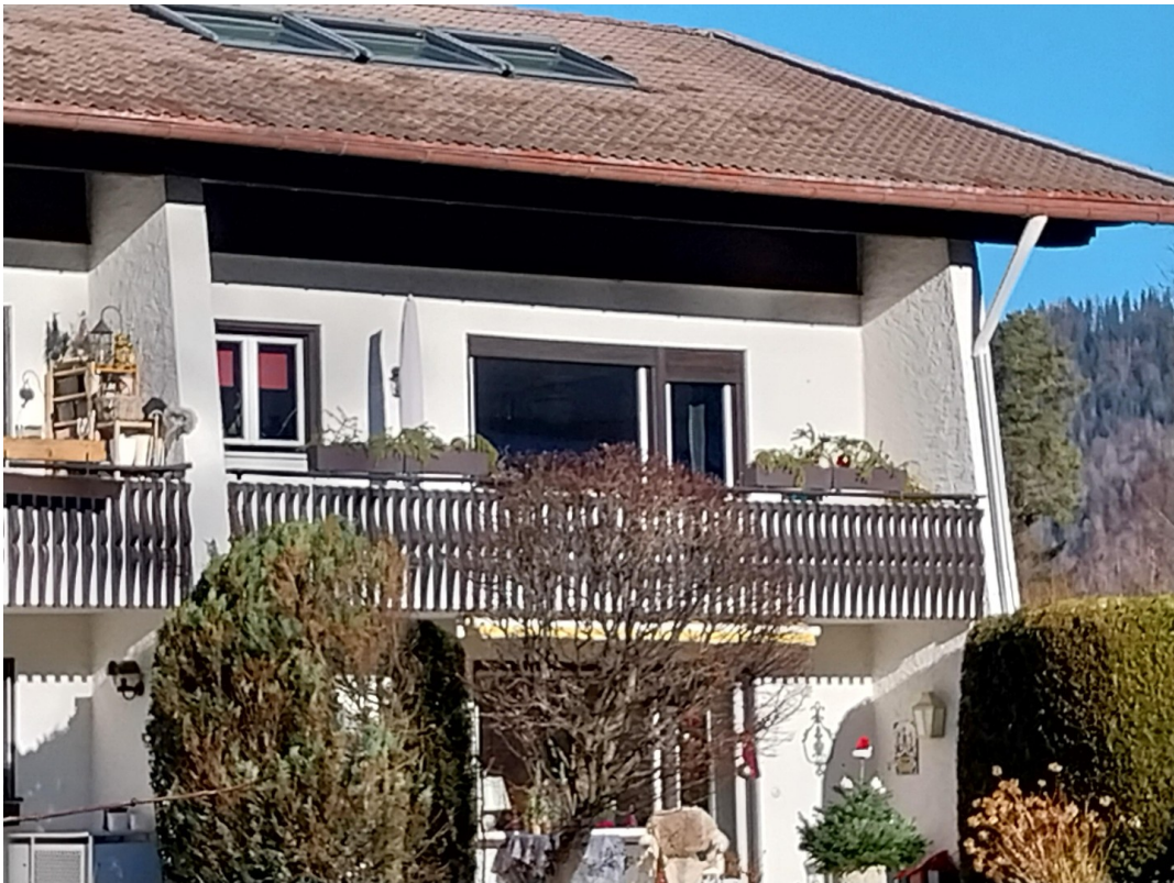
Süd/Ostbalkon Ansicht Herbst