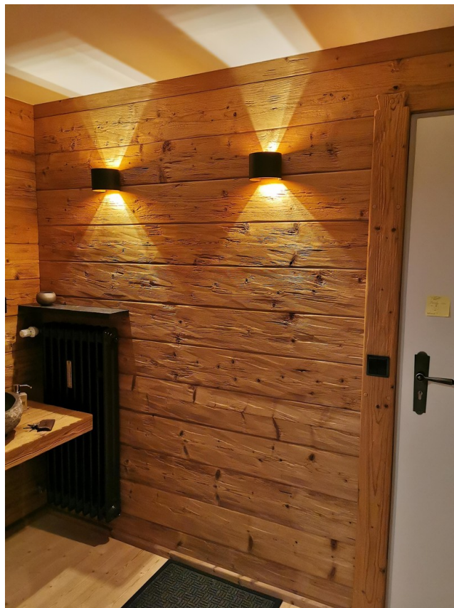
Chalet Zimmer DG