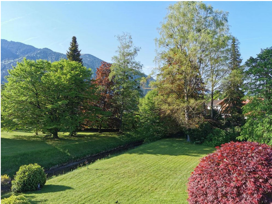
Blick in Gemeinschaftsgarten