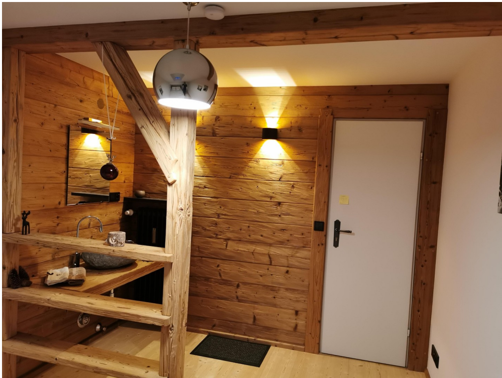
Chalet Zimmer DG