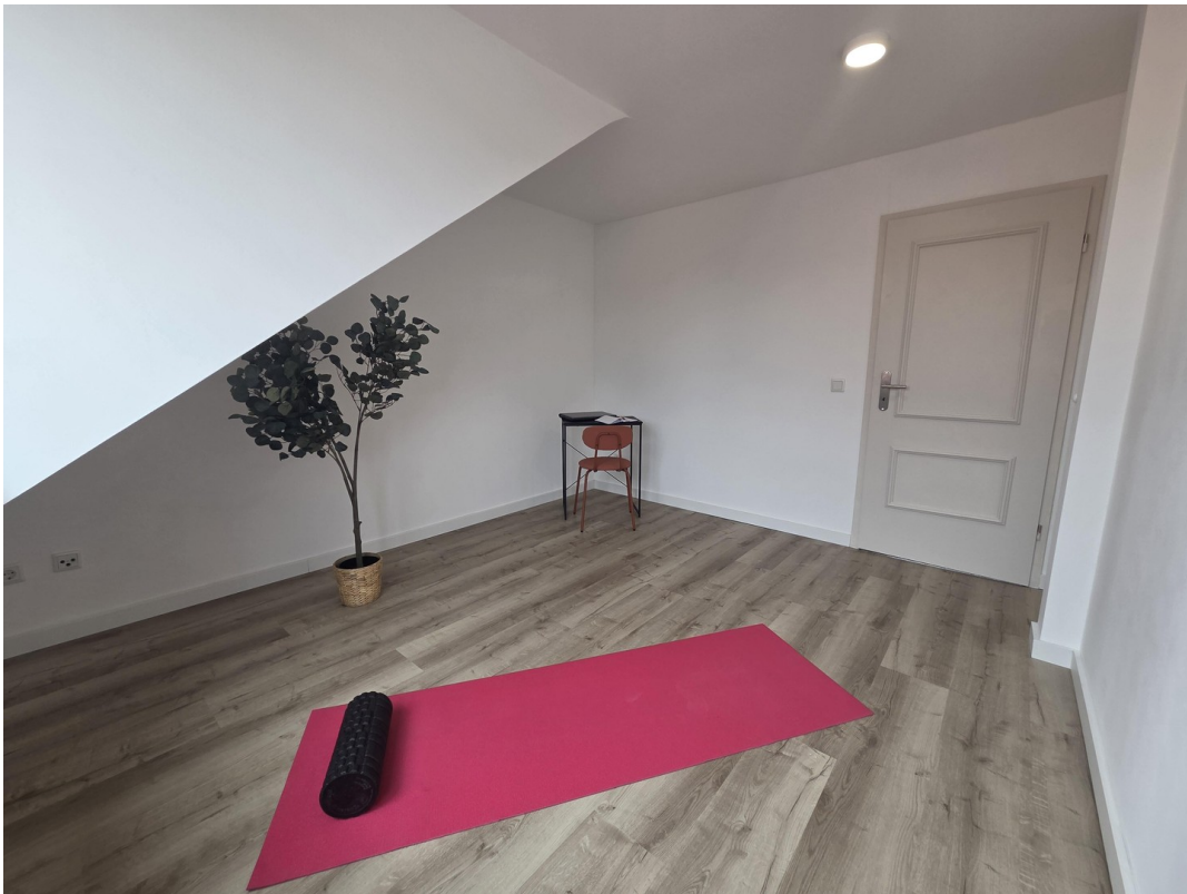
Schlafzimmer 1 / Büro