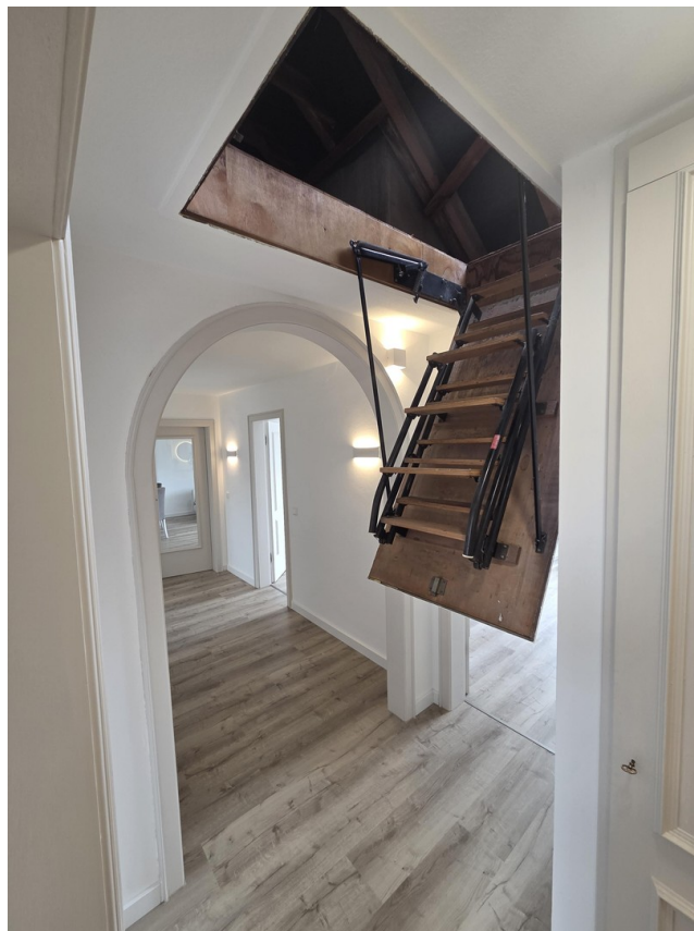
Zugang zum Spitzboden