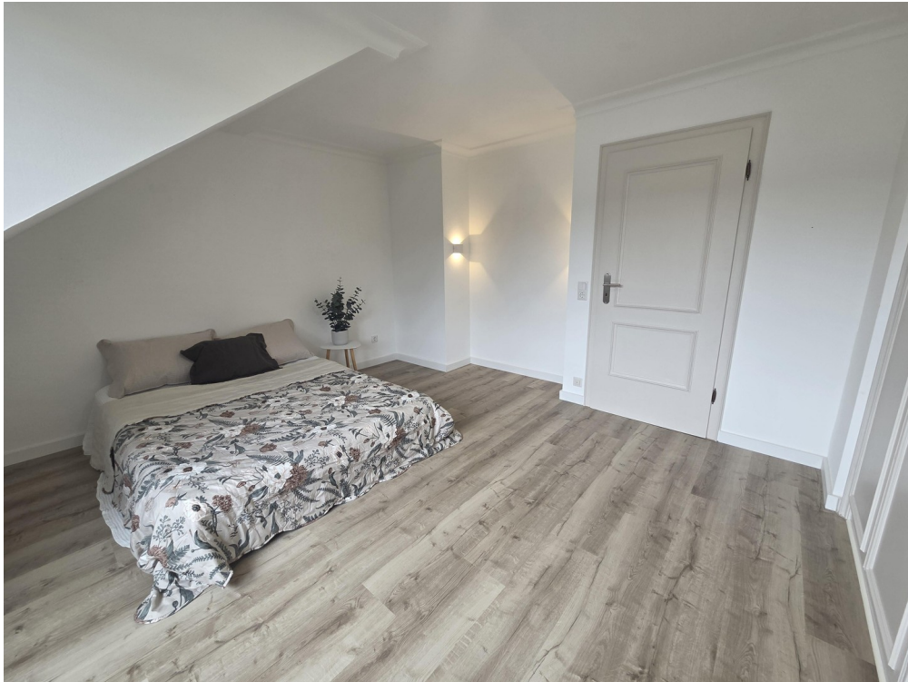
Schlafzimmer 3 / Einbauschränk