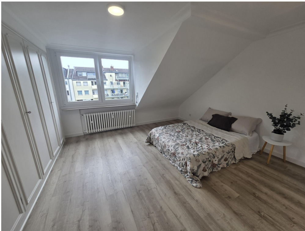
Schlafzimmer 3 / Einbauschränk