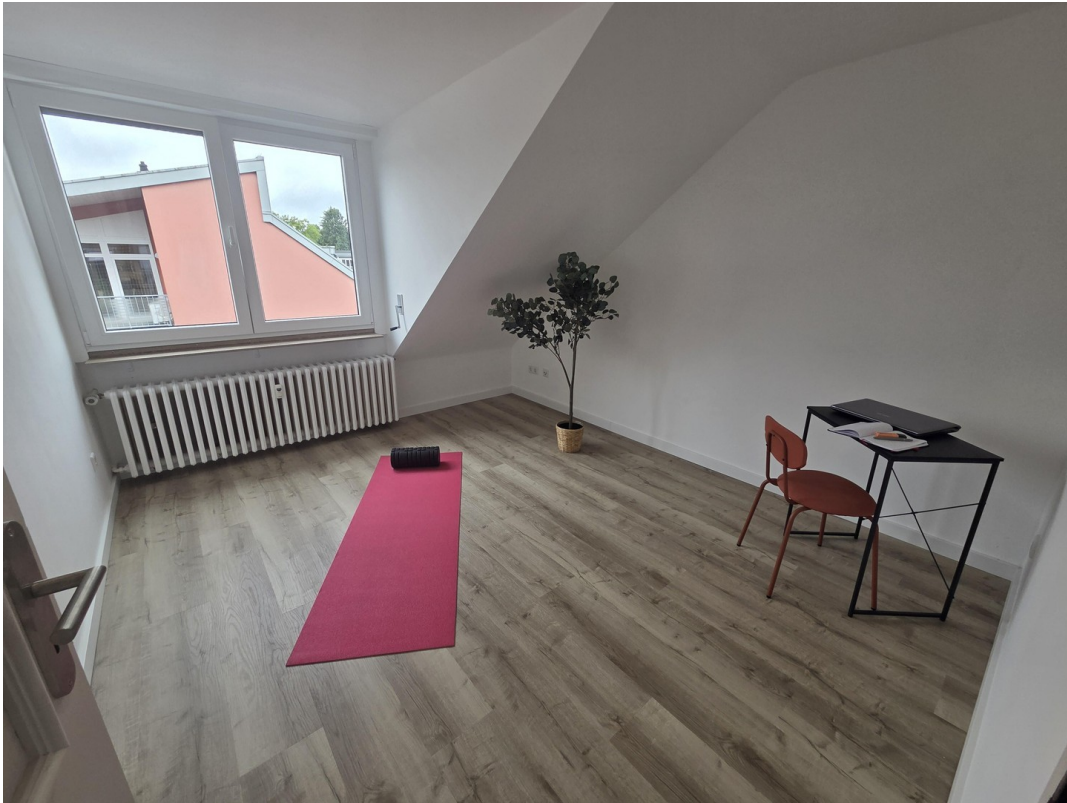
Schlafzimmer 1 / Büro