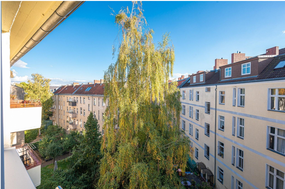
Blick Richtung Hinterhof