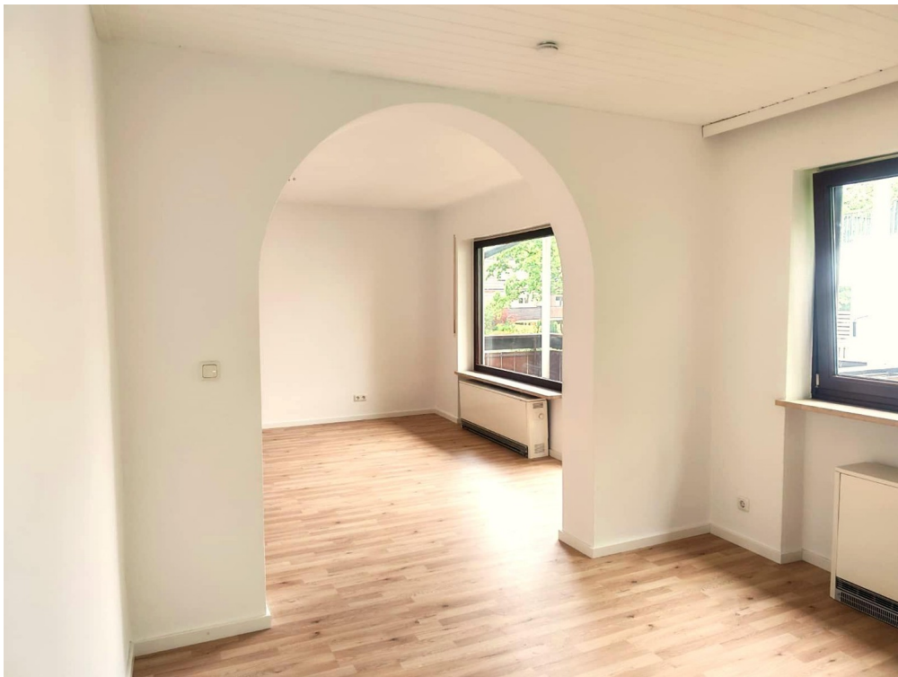
Wohn -und Esszimmer