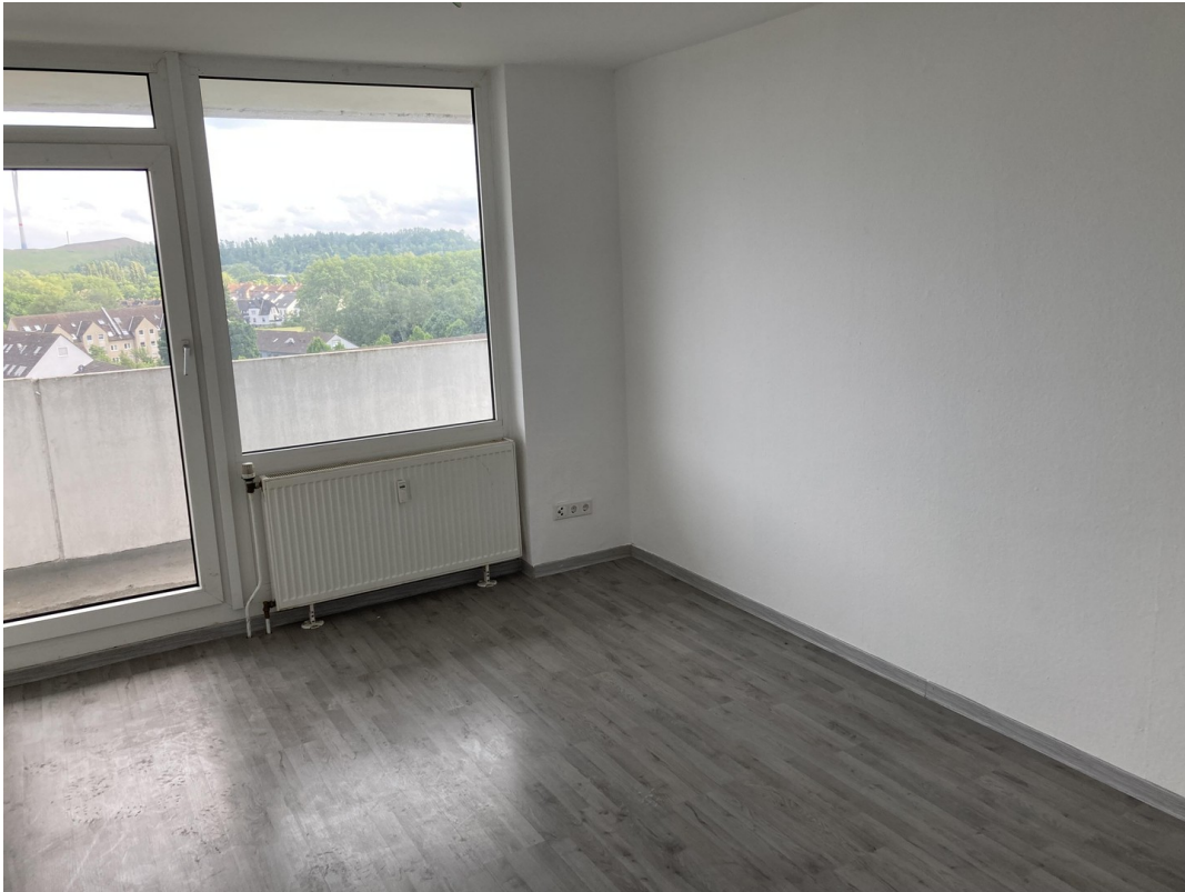
Wohnzimmer mit Fernblick